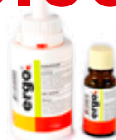
EM104-SB ERGO SPIEGELHALTER KLEBSTOFF (50G)

Ausgezeichnete Eignung für Metall/ Glas-Klebung. Der Einsatz des beiliegenden Aktivators ermöglicht eine Aushärtung innerhalb von 20 Sekunden (Raumtemperatur von ca. 23°C).