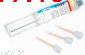
EM104-22 2K SEKUNDENKLEBSTOFF FLEXIBEL (10G)

Der Kleber hat im statischen Mischrohr eine Verarbeitungszeit von ca. 6 Minuten und härtet innerhalb von 10 Minuten aus, wobei er eine Bruchdehnung bis 200 % entwickelt.