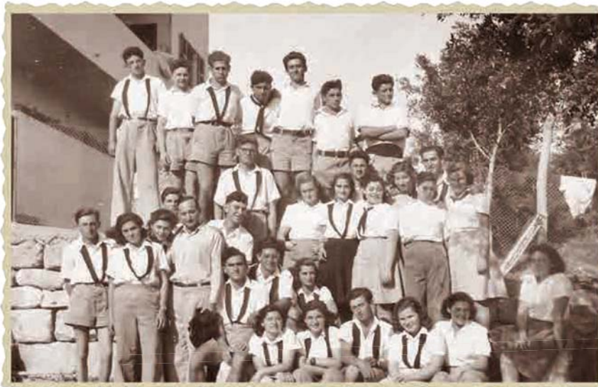
סיום הלימודים בשער העמקים של נוער ג' (בני 18 3 בנות בנות 16)

בקבוצה שאליה צורפנו כבר הייתה בחורה בשם יהודית, ולכן התבקשתי שוב לשנות את שמי. זה היה שוק בשבילי. לא הסכמתי והתחלתי לבכות. בסוף הוחלט שיקראו לי יהודית ב'.