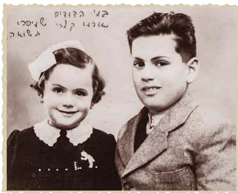
בני הדודים שניספו בשואה

אני לא צריכה לראות את התמונה של בת דודתי, כי היא נמצאת אצלי ואיתי לאורך כל ימי חי". כל פעם שנכדוטיי הגיעו לגיל שלה, חשבתי עליה ועל מה שהייתה יכולה להיות. היא הייתה ילדה מיוחדת, חכמה, נבונה ומאושרת. בגיל חמש היא ידעה מי הוא זר שמגיע לבית ומי מקורב, ואז הייתה מגיעה אלי למקום המסתור, ומודיעה לי, האם ומתי אני יכולה כבר לצאת. היא ידעה לכתוב ולקרוא. שיחקתי איתה משחקי חברה, למרות שהייתי כפול מגילה. כל פעם כשהיינו מגיעים לסבים ולדודים, היא הייתה פלא בעינינו. כשביקרתי באוהל הילדים ב"יד ושם", היא הייתה שם בליבי. בכל המעבר הארוך והחשוך בכיתי את אובדנה. קשה לי עד היום לתאר, איך ילדה בת שש, שכבר מבינה הכול, כתאום עומדת מול מצב בלתי נתפס, מול המוות. אני כותבת ואני בוכה, כל כך אהבתי אותה.