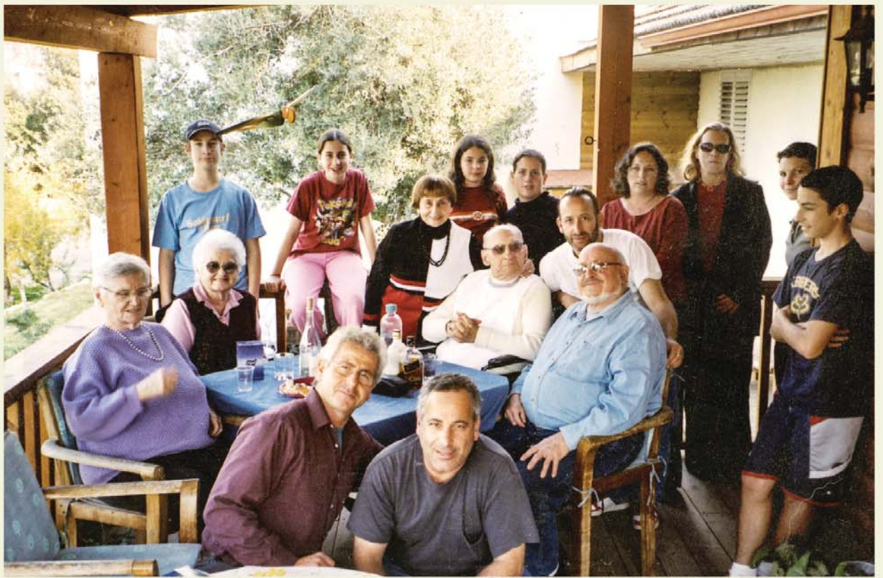
משפחתי (חסרים ערן ושחר)