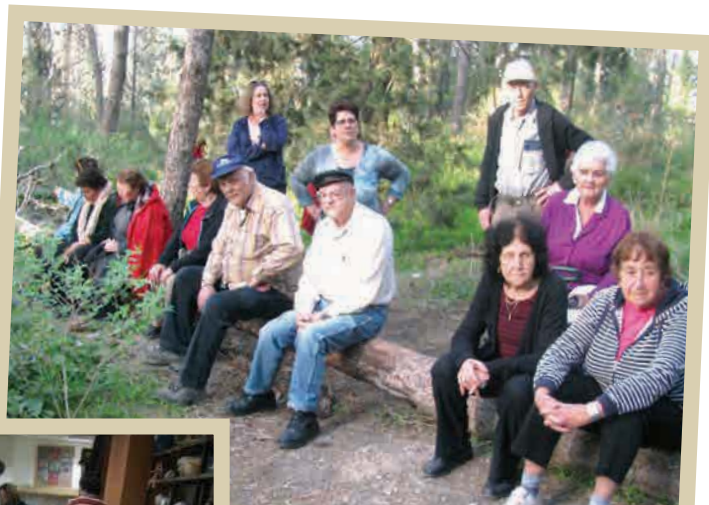
בחיק הטבע טיול עם "דורות"

אומנם ציירתי וקראתי הרבה גם לפני "דורות", אך מאז הצטרפתי לפעילות שם, אני מרגישה יכולות שלא הייתי ערה להן לפני כן וגם לא היה לי זמן. היינו כה עסוקים בעבודה ובמשפחה, והנה לעת זיקנה, כשחשבתי לי: "אוי, מה אעשה בפנסיה?" אני מרגישה כוחות וסקרנות להמון נושאים שלא נפתחו לפני קודם. הגעתי למסקנה שאפשר עוד ועוד להתחדש וללמוד בכל גיל. כך התחלתי ליהנות גם מהמחשב. לא מזניחה את הקריאה ואת משק הבית. היחיד שניזוק אולי זאת העיתונות טוב שכן. "דורות" מאפשר לנו ללמוד, ליצור ולהתחדש עוד ועוד.