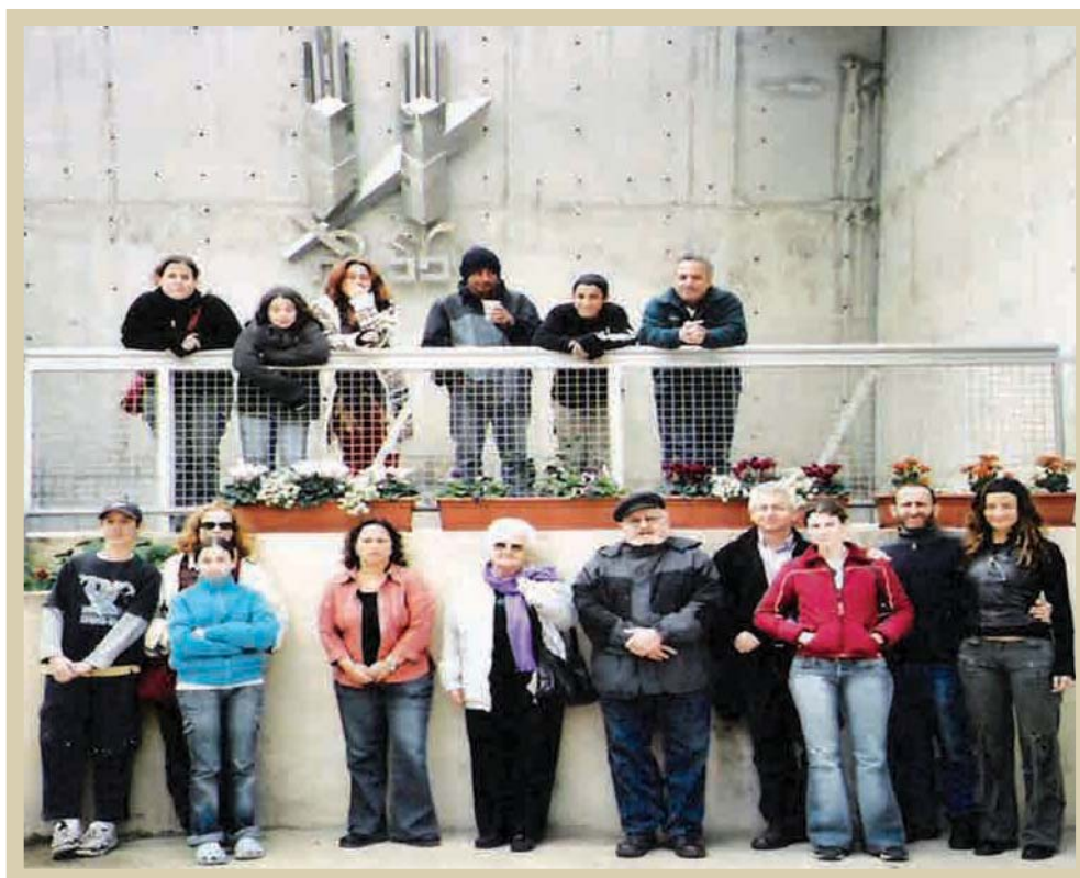
"אני והסבתא ישבנו בצוותא..." עם סבא והבנים ליד בית הפלמ"ח (2005)