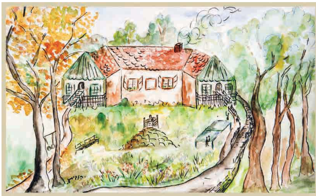
ציור מהזיכרון של בית הורי

גרנו די רחוק מהעיר, בחיק הטבע, כחצי שעה הליכה טובה וחזרה עם עלייה תלולה. מכוניות לא היו, כמובן, אמנם היו חשמליות ואוטובוס, אבל הם לא הגיעו עד אלינו. אמא הכינה סיר חמין ביום שישי, ואבא לקח אותו למאפייה בעיר, והשאיר אותו עד למחרת. כל שבת באותה השעה חיכינו לאבא שיגיע מהעיר. ירדנו עד לשער, כי סבלנותנו פקעה. "נו, מה קורה? למה הוא לא מגיע?" חוש הריח כבר עבד, עוד לפני שראינו את אבא. ואז, הנה, סוף-סוף אבא. בצעדים כבדים הוא מתקרב ואנו רצות לקראתו, מקפצות סביב הסיר וסביב אמא, גם לעזור, אך בעיקר שהארוחה תתקרב יותר מהר. הריח כבר התפזר בכל הבית וכעת מחכים לפתיחת הסיר, לראות איך החמין נראה היום. האם סמין? האם דליל? או בדיוק טוב. כולנו סביב הסיר, כמובן אמא היא הפותחת. מתירים את השרוך, מורידים את הבד ואז את המכסה. זה נראה נפלא וכל המיצים כבר פועלים. מוציאים את החמינדות ואת הקוגל ולבסוף את החמין. השולחן כבר ערוך. אנו יושבים, משתדלים לחכות בסבלנות על אף הקושי. סוף, סוף אמא מחלקת לצלחות, כל אחד לוקח ביצה וקוגל וכף הטשולנט כבר בפה, והטעם גן עדן. זהו. אין כמו הטשולנט של אימא וגם אין כמו השטרודל של אמא.