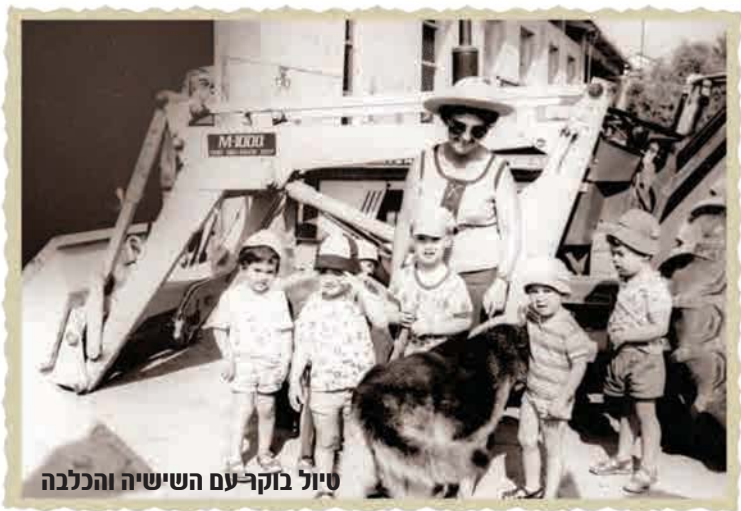
טיול בוקר עם השישיה והכלבה