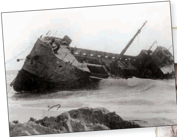
אוניית המעפילים "חנה סנש"

עזרא הגיע ארצה באוניה ששמה היה "andrata" ושונה אחר כך ל"חנה סנש". היא נרכשה באיטליה. ב-14.12.1945 יצאה לכיוון ארץ ישראל, כשעל סיפונה העלו מאתיים חמישים עולים, ניצולי שואה. זו הייתה אוניה קטנה, ספינה, שבין גלי הים הגבוהים הייתה כקליפת אגוז. המעפילים הסתובבו על הסיפון מרבית שעות היום, צפופים ורעבים, כי מזון ומים כמעט לא נשארו להם. ב"הגנה" הוחלט לנצל את ליל ה-25 בדצמבר, שהוא למחרת חג המולד ורוב החיילים מתעוררים משנתם שיכורים. ניתן היה להניח שזו הזדמנות פז, שלא במהרה תחזור. וכך היה, לאחר מסע של שלושה-עשר ימים, הגיעה הספינה לחוף נהריה. הים היה סוער ורוח עזה נשבה, והספינה שהיטלטלה בין הגלים מצאה עצמה על הסלעים, כשהיא נוטה על צידה. צוות החוף של הפל"ם, נערי "הימיה" (פלוגת הים של הפועל נהריה) ותושבים מנהריה התגייסו ועזרו למעפילים לרדת מהאוניה ולעלות על החוף. בניסיונות הראשונים להורדת האנשים, התהפכה אחת הסירות ושתי נשים טבעו. לאחר שהספינה נקשרה לחוף חודשה הורדת האנשים. חלקם הגיעו לחוף בשחייה, ביניהם היה גם עזרא. לאחר שהגיע לחוף פשט עזרא את בגדיו הרטובים והחליף באחרים יבשים, שהמתנדבים על החוף הכינו להם. המעפילים פוזרו בין קיבוצי הסביבה. צוות האניה הוברח לארץ. לאחר ימים אחדים חזרו אנשי הצוות לאיטליה. על אירוע ההעפלה בחוף נהריה כתב המשורר נתן אלתרמן את שירו המפורסם "נאום תשובה לרב חובל האיטלקי".