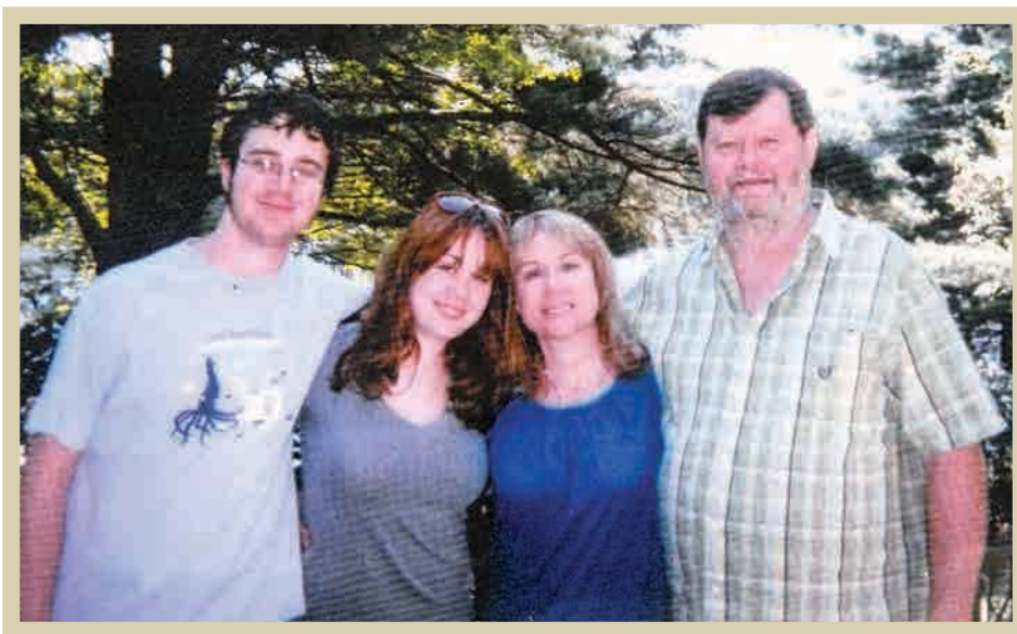
בנינו המאומץ ובני משפחתו, משפחת הנסי