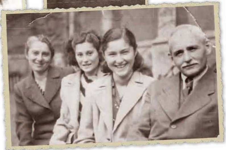
הור', אחותי ובת-דודה (צילום שנשלח אלי לאחר עלייתי ארצה)