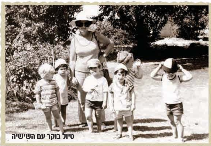
טיול בוקר עם השישיה