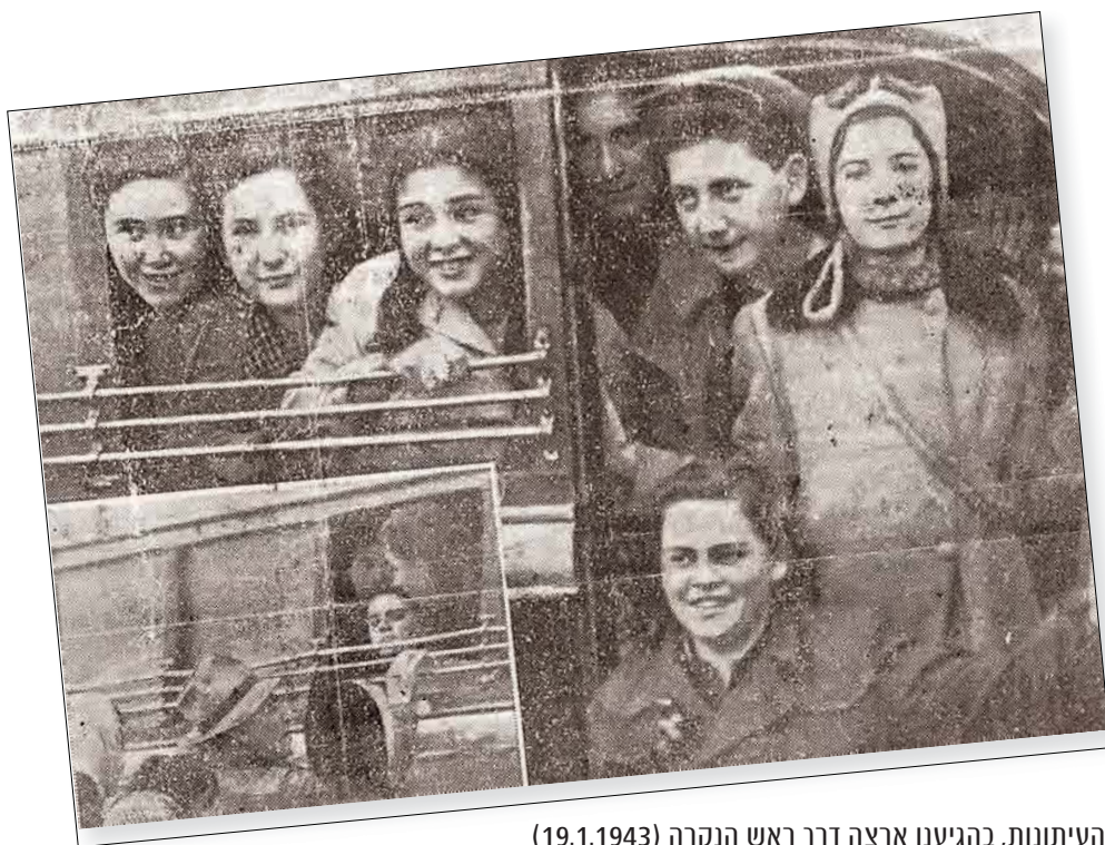
מהעיתונות, בהגיענו ארצה דרך ראש הנקרה (19.1.1943)