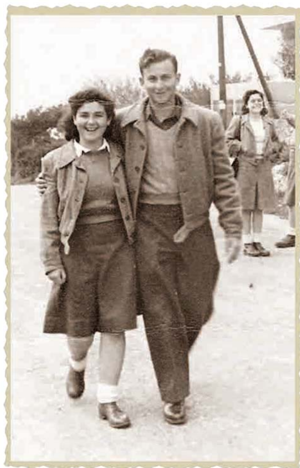
חופשה מהפלמ"ח (1947)