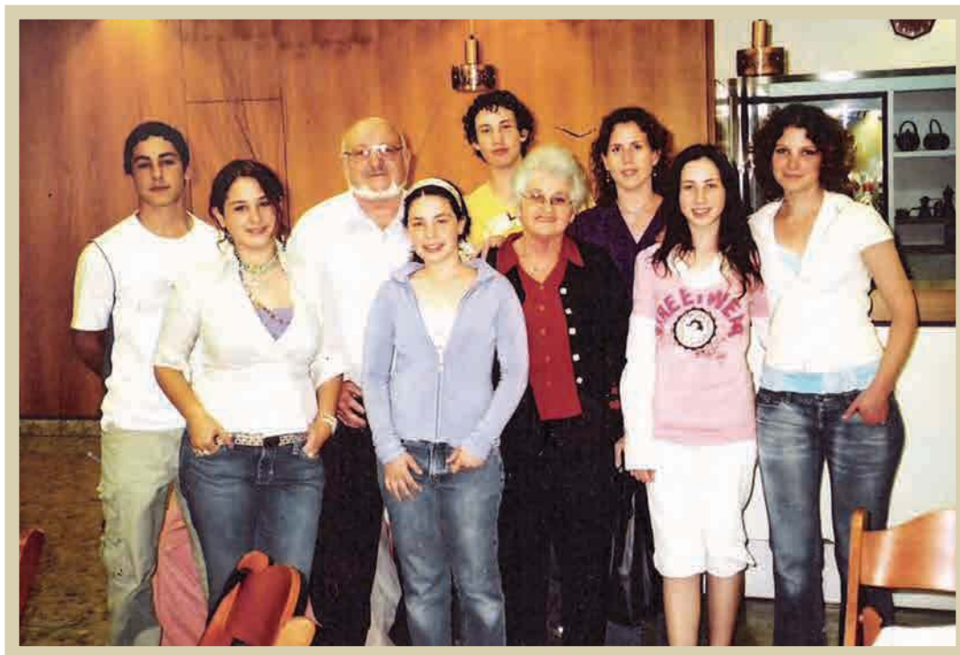
עם שבעת הנכדים שלנו, בבת-מצווה של אורי, 2006

עברו 50 שנה מאז שסבתא שלכם עלתה. יצאנו מהגיהנום הנאצי והקמנו משפחה. היינו ילדים, גם סבא וגם אני הדחקנו זיכרונות, רגשות, כי הכאב היה טרי ללא הורים, בלי משפחה רק קבוצת ילדים הייתה לנו לנחמה. התבגרנו, התגייסנו לפלמ"ח, חזרנו לקיבוץ, להיות בו חברים.