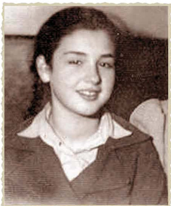
בטורקיה, בעת המסע לארץ ישראל (ינואר 1943)