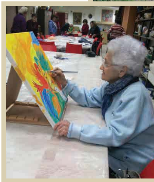
מציירת ב"דורות", 2015