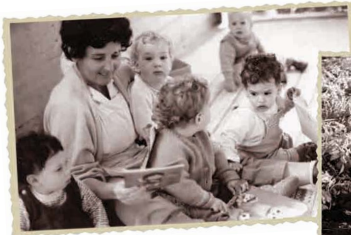
קוראת סיפור לילדים