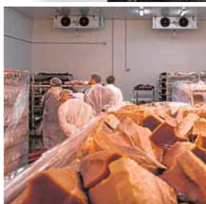
Pescado ya procesado para el Banco de Alimentos.

La seguridad alimentaria es otra de las patas sobre la que se basa el trabajo solidario del Colegio de Veterinarios. De forma voluntaria, seis de sus miembros