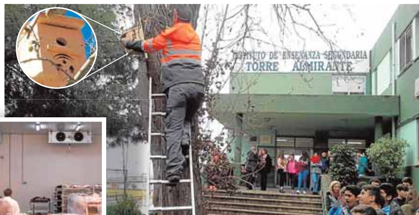
Medio millar de cajas nido se instalan en este proyecto.

se encargan desde 2012, de colaborar con el Banco de Alimentos para garantizar la salubridad de los alimentos almacenados en sus naves.