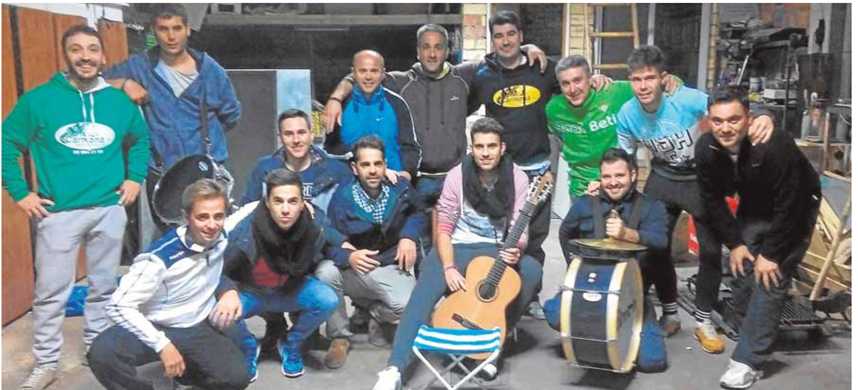
«Los primerizos» vuelven a la carga con la difícil tarea de mejorar su inolvidable tipo de mariscada, varias veces premiado

ta de los vecinos historias de amor ocurridas en la primera mitad del siglo pasado. A partir de ellas se seleccionarán diez relatos para su posterior dramatización y puesta en escena durante la V edición del festival el próximo agosto.