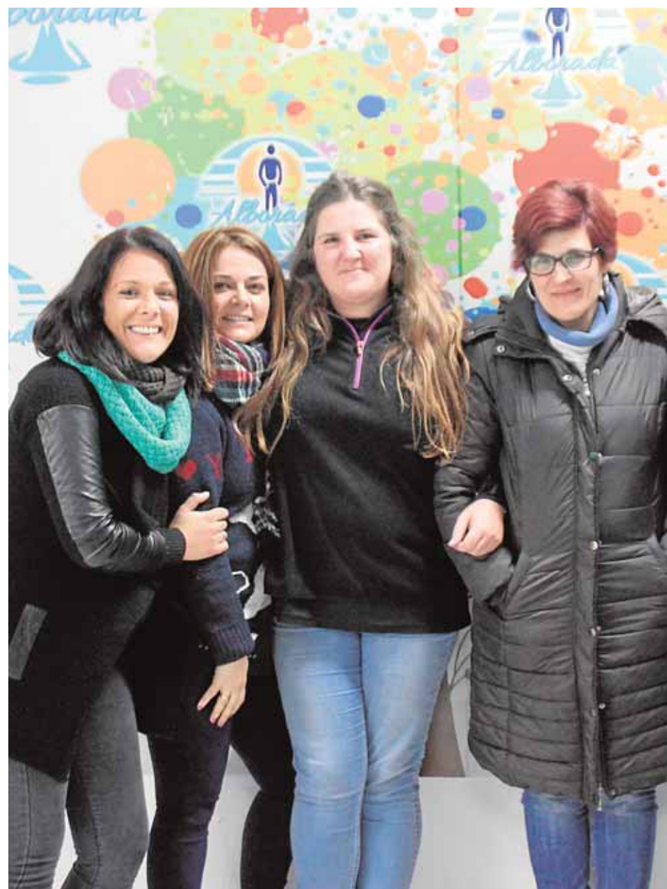
Varios miembros de la asociación pileña Alborada, en su sede aljarafeña