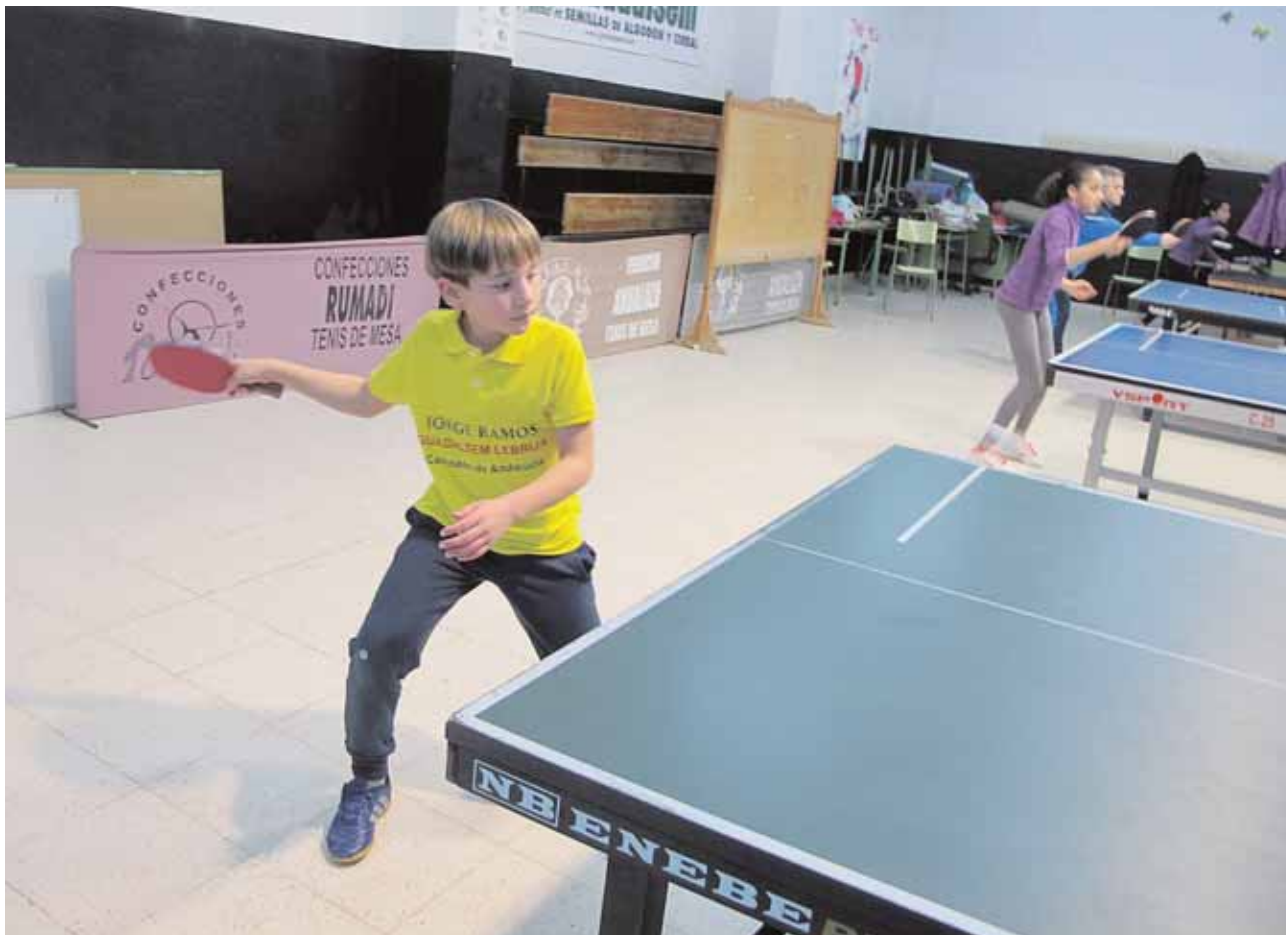
El campeón andaluz prebenjamín de tenis de mesa durante uno de sus intensos entrenamientos

públicas del municipio y recogida de residuos sólidos urbanos. La bolsa estará vigente hasta el 31 de diciembre de 2019. El Ayuntamiento contratará temporalmente, por un mes como mínimo, a los aspirantes que superen las pruebas de selección. A.H.