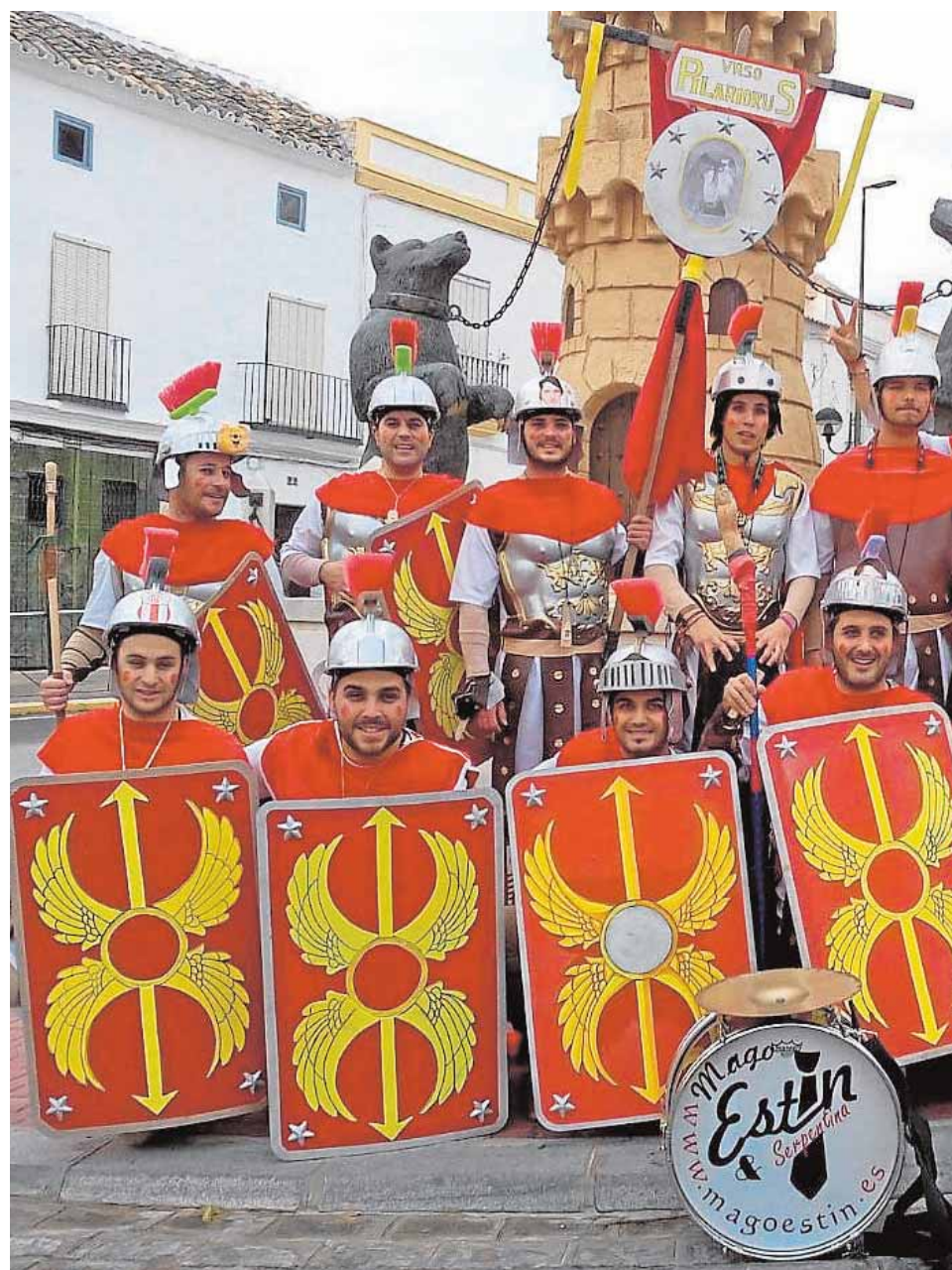
Los ursanonenses sorprendieron el año pasado a sus vecinos con el disfraz del prim

Al cabo de una semana, «con algunas letrillas en mente y la idea de presentación nos volvimos a encontrar y nos animamos», señala. Ese primer año acabó en un intento fallido, pero fue la chispa necesaria para hacer ese