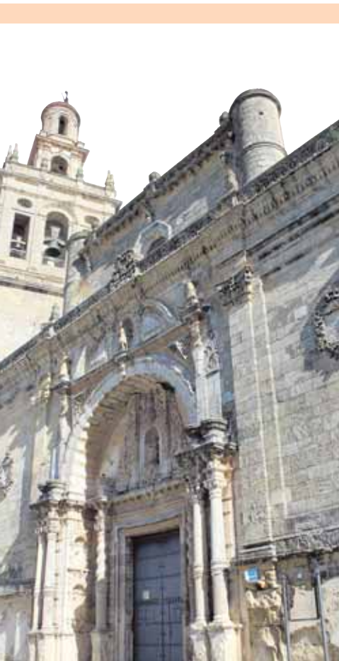
PARROQUIA DE SAN EUTROPIO (PARADAS)

glo XVII) se encuentra una colección compuesta por nueve pinturas de Francisco de Zurbarán. Esta colección, encargada por la propia parroquia en 1634, se compone por un crucificado, la famosa Inmaculada (que ha viajado a exposiciones de primer nivel) y San Juan Bautista, además de medio apostolado. Pero no son las únicas obras por las que merece la pena visitar San Juan. También se encuentra una imponente pinutra de Vasco Pereira, «La Anunciación». Una demostración de que hay más patrimonio del que muestran los museos.