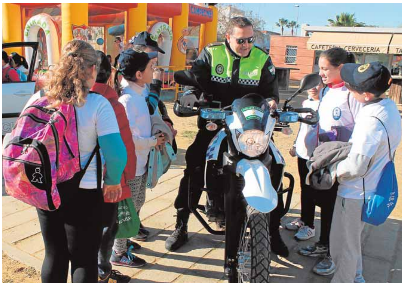
Un agente de la Policía explica a escolares loreños la función de uno de los vehículos del cuerpo