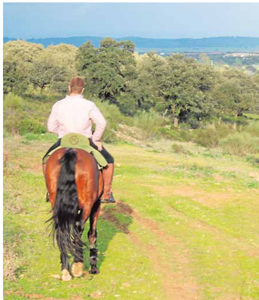
El plan local prevé la recuperación de los caminos públicos de Gerena

La tercera y última fase del plan contempla la señalización de los itinerarios y su promoción turística.