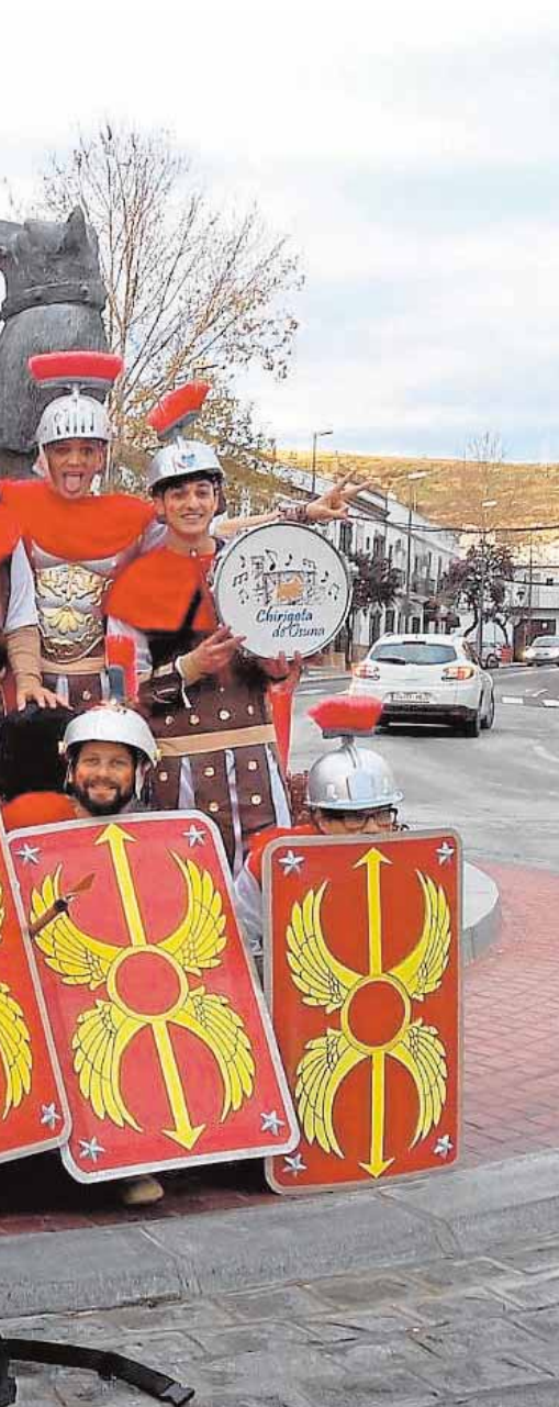
er romano que pisó la antigua Urso.

fama cada año, y para esta ocasión ha cerrado un cartel que hará las delicias de los aficionados a las marchas de Semana Santa. Entre las formaciones participantes estarán las de Presentación al Pueblo, Las Cigarreras, El Sol y Coronación. B.M.