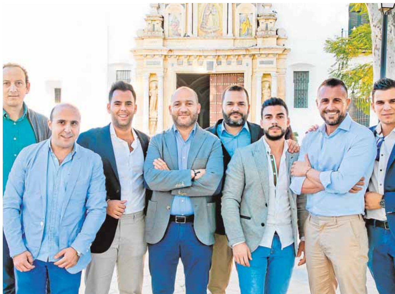
«Activa Ocio Conectado» está formada por jóvenes empresarios procedentes de diversos ámbitos