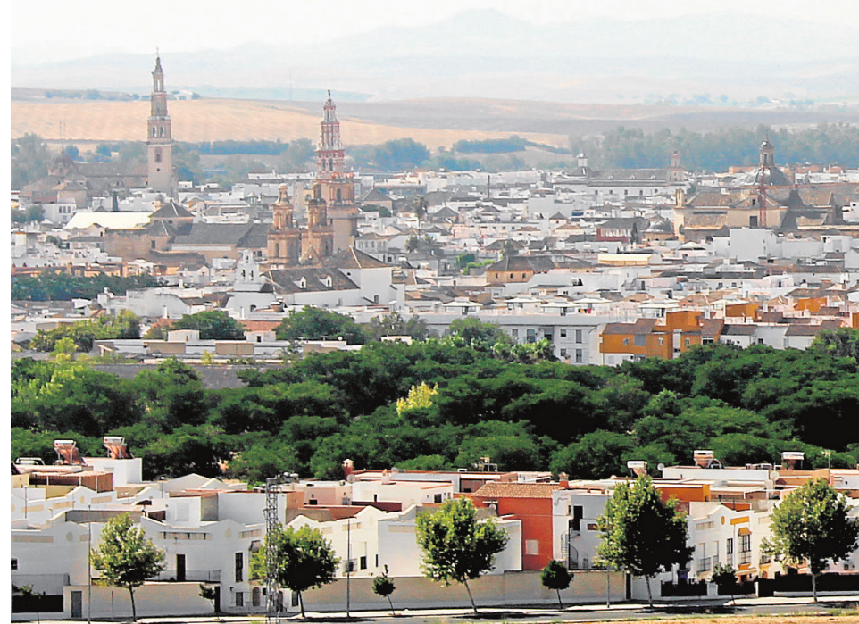
Vista del horizonte de Écija desde el cerro de San Cristóbal, con su inconfundible e

Sin embargo, tal y como opina la doctora en Arquitectura, Montserrat Díaz Recasens, autora de la primera tesis universitaria sobre las torres de Écija, «sin comunidad que las apoye, ni iglesia que las considere símbolo necesario, con la única función de campanario, puede que las torres no encuentren un argumento que las mantenga». La única opción es «conseguir