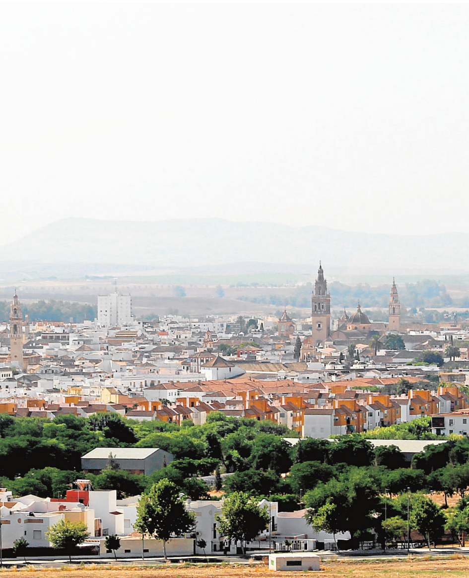
stampa de torres y espadañas

uno de los municipios pertenecientes a su Patronato, entre los que se encuentran Cañada Rosal y La Luisiana. Los alumnos interesados deberán remitir su solicitud antes del 30 de septiembre de este año a sus respectivos Ayuntamientos.