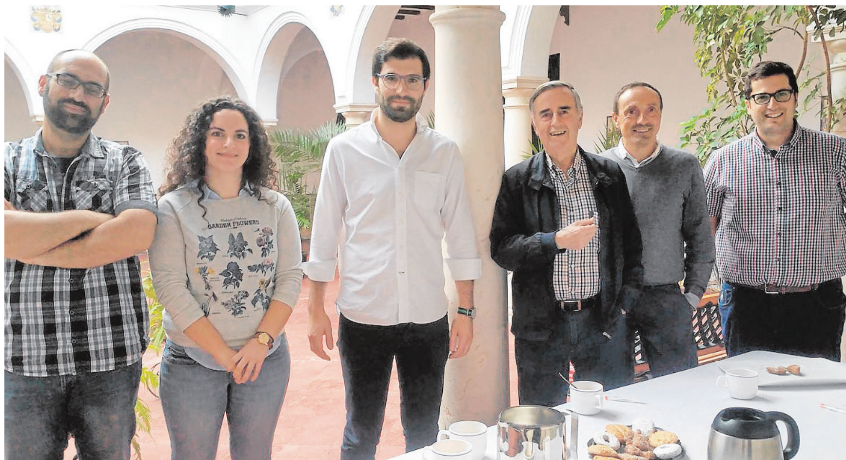
Reunión de varios miembros de los Amigos de los Museos de Osuna en el claustro del Monasterio de la Encarnación