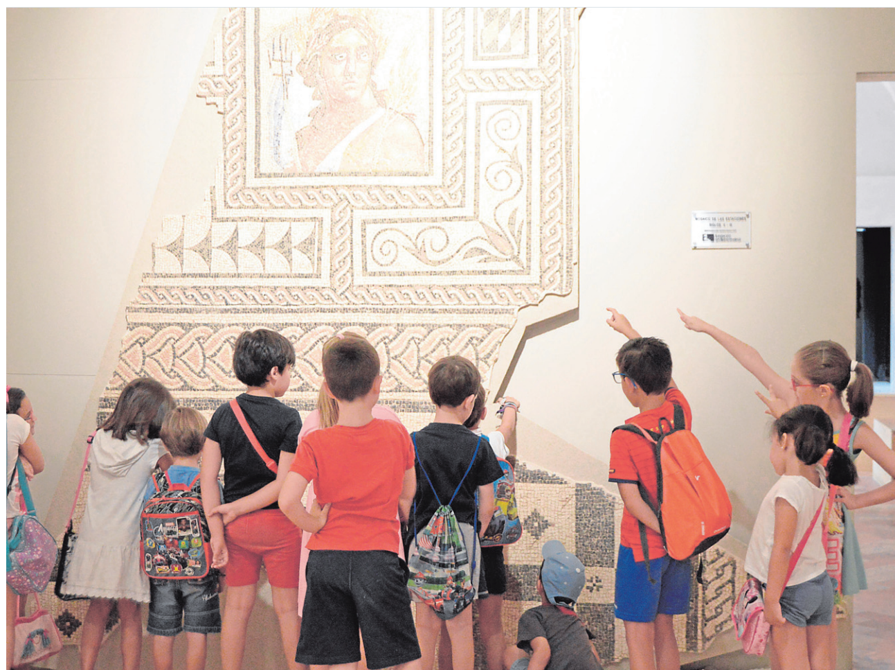
Los niños aprenden la historia con las piezas del Museo de Carmona como recurso