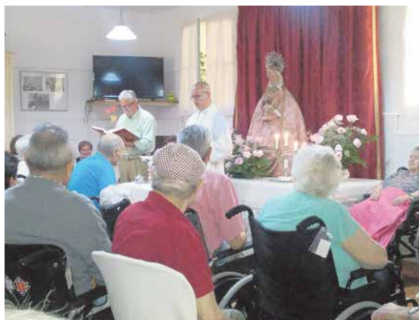
Un momento de la Eucaristía celebrada en el Centro de Mayores

importante), los residentes tuvieron la oportunidad de poder recibir el sacramento de la Eucaristía en el Salón de la misma. Para ello, contaron con la presencia de una imagen antiquísima de la Virgen de Gracia que, para la ocasión, nos es cedida por la parroquia de San Pedro para que permanezca en la residencia durante toda la novena. Entre las peticiones que los mayores realizaron, cabe destacar la salud para todos y la paz en el mundo.