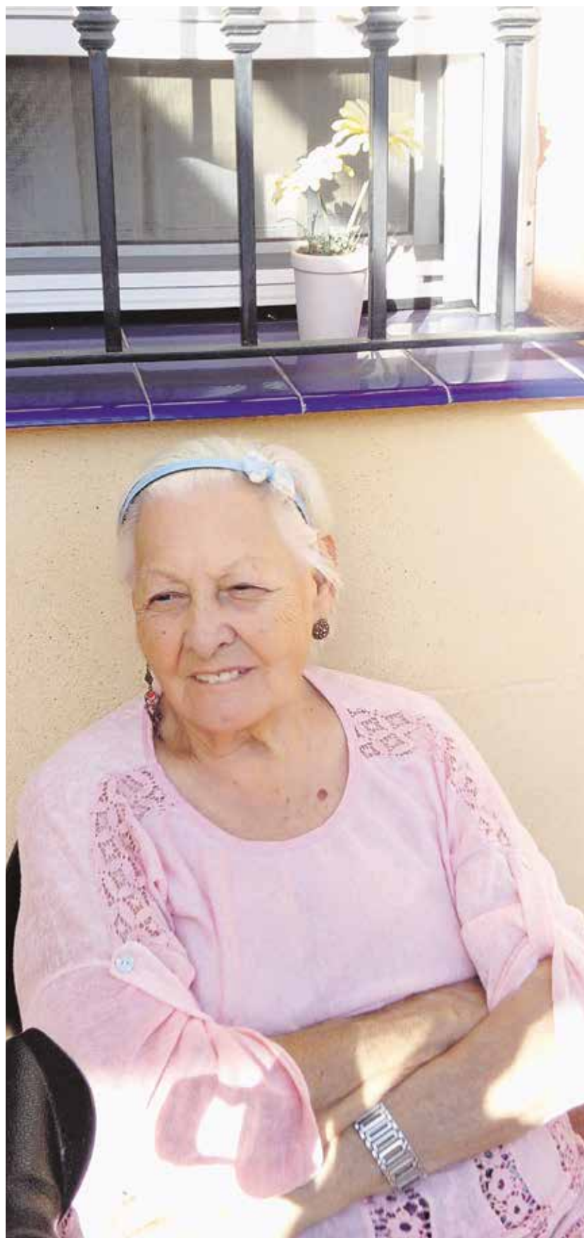
Una de las participantes en este Taller de Memoria

Entre todos, durante el año pasado hicimos una recopilación de refranes po-