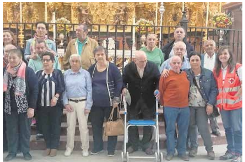
Los mayores ante el altar de la Virgen del Rocío