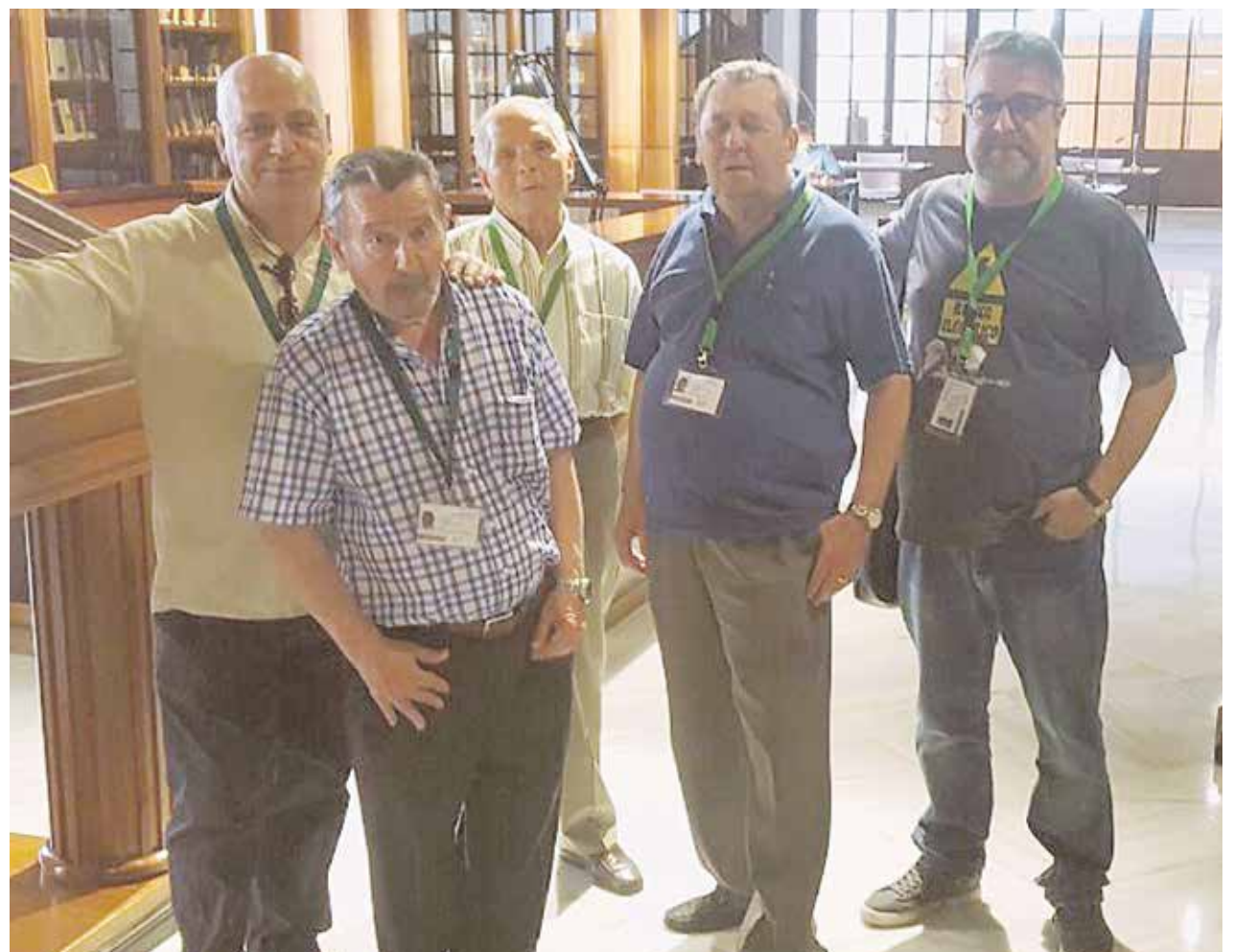
Algunos de los participantes en la visita al Parlamento Andaluz

Y repletos de historia y cultura nos dirigimos hacia la Residencia de Mayores de San Ramón donde celebramos la Fiesta de La Primavera y nos esperaban el resto de compañeros para el almuerzo.