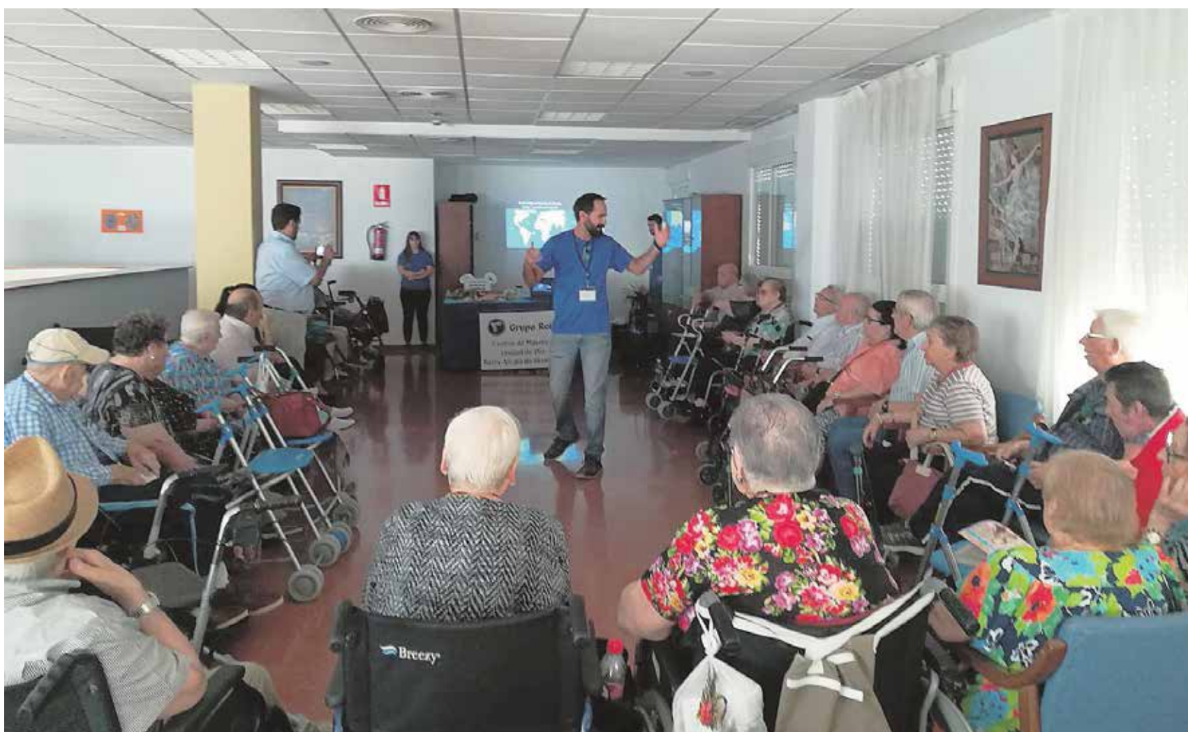
Los mayores pudieron ver muestras de distintas especies marinas

«Pudimos tocar 'en vivo' una estrella de mar»