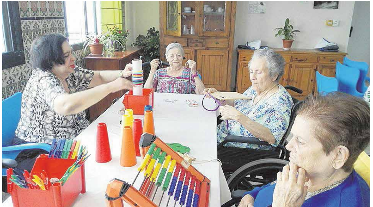
En este taller se realizan una gran variedad de actividades

Según nos explicaba la terapeuta ocupacional, la psicomotricidad fina son todos aquellos movimientos del cuerpo que requieren una mayor destreza y habilidad y un mayor dominio de los movimientos, en especial de las manos y los brazos, es decir, los movimientos voluntarios y muy precisos de las manos y los dedos, como por ejemplo escribir, pasar las páginas de un libro o introducir una llave en una cerradura.