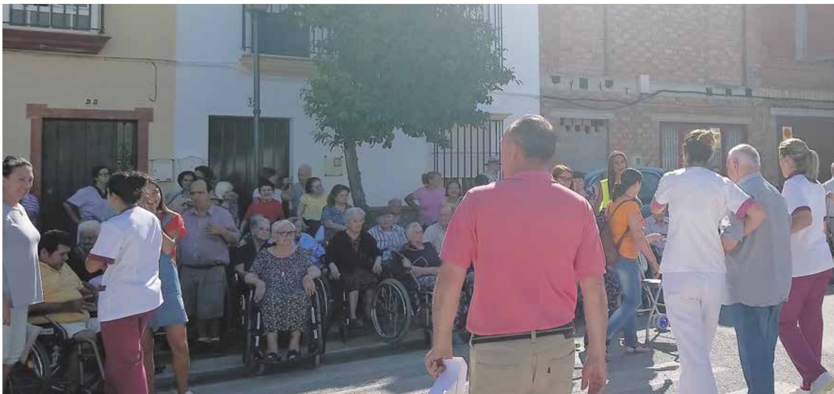
Los participantes en el simulacro, reunidos en el exterior del centro