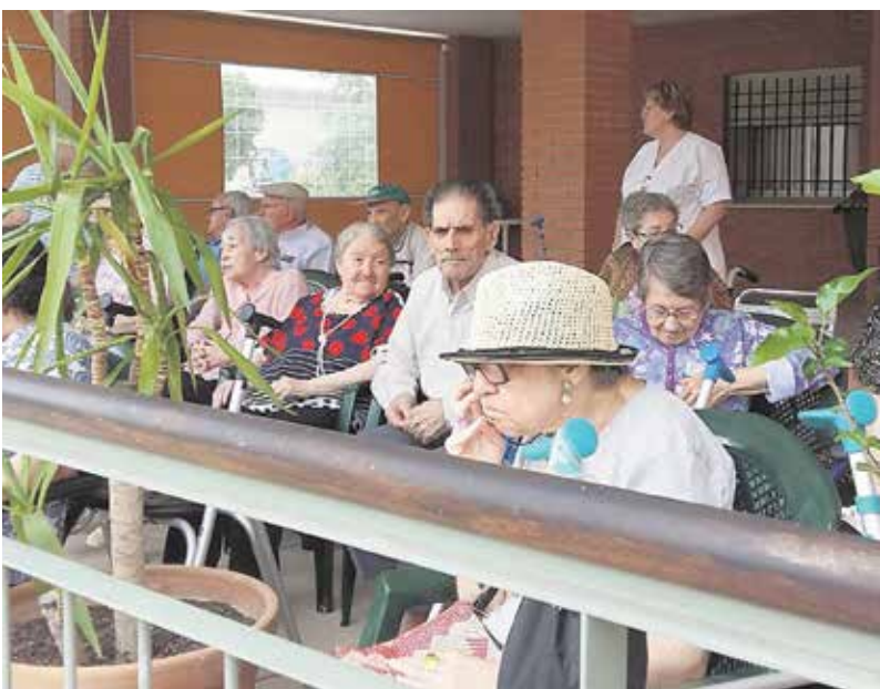
Fue una jornada muy emocionante