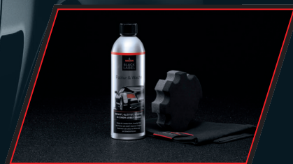
Politur & Wachs Set