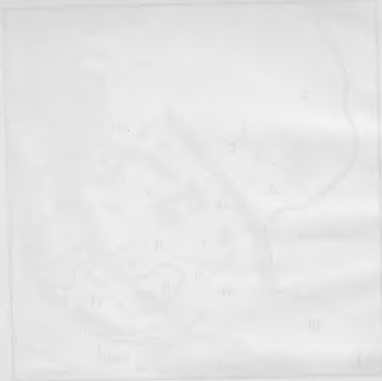
Map of the United States showing state boundaries and major cities.