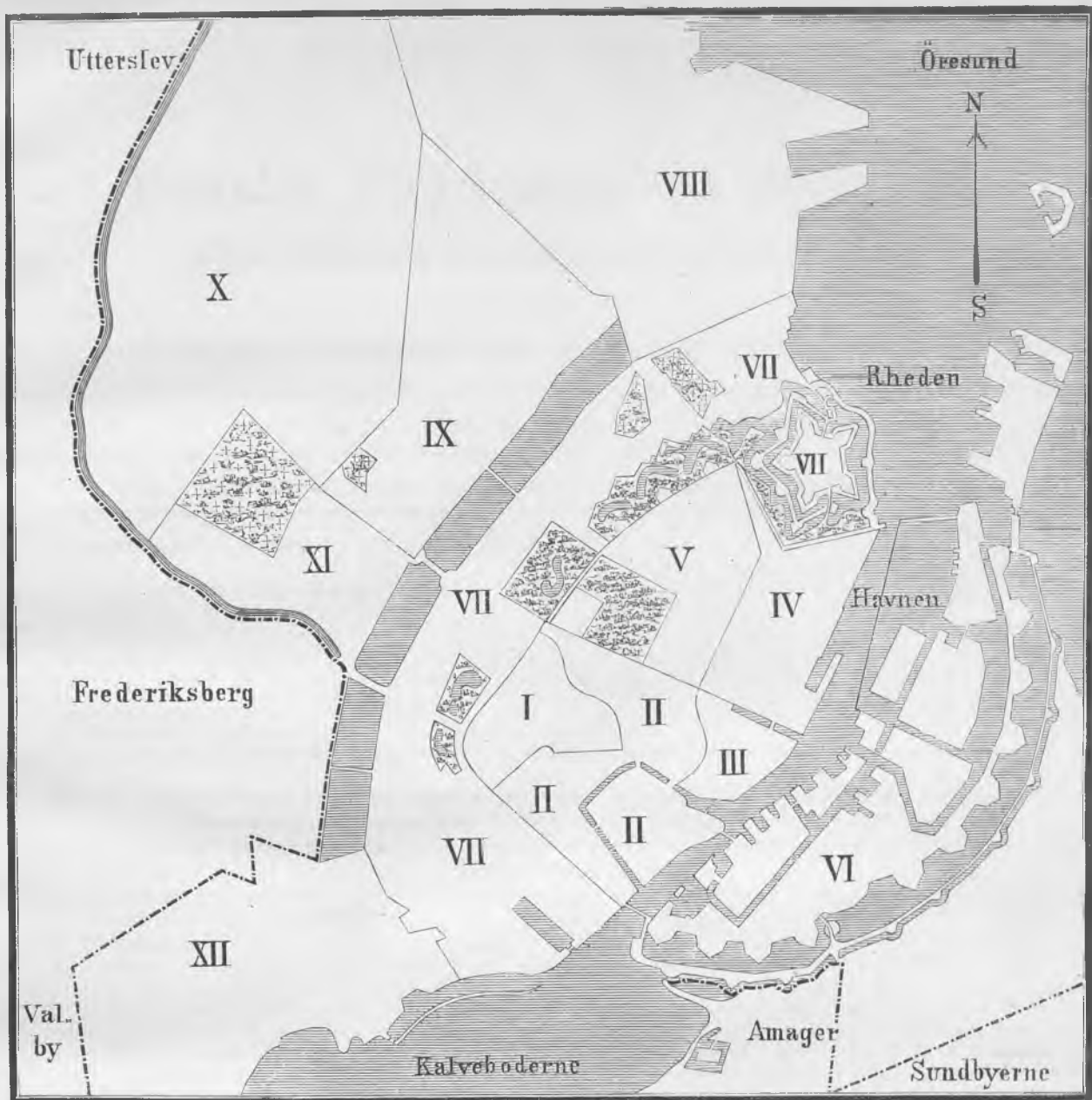
Oversigt over Befolknings-, Beboelses- og Dødelighedsforhold i ethvert af Stadens hygiejniske Kvarterer i Aaret 1892.