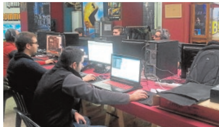
Miembros de la asociación juegan en la sede de Canalejas A.L.

La asociación de aficionados a los videojuegos Écija Gaming Community ha cumplido un año ofreciendo a los «gamers» un espacio de juego colectivo, intercambio de conocimientos y formación hasta ahora inexistente en el municipio. Desde su sede de la calle Canalejas, sus promotores ofrecen las instalaciones, el equipo informático y electrónico necesario para disfrutar de juegos de todas las generaciones: desde el clásico fútbol o sección de juegos de mesa hasta computadoras, consolas y grandes pantallas de televisión. La formación en videojuegos, incluso con fines profesionales, es otro de sus objetivos.