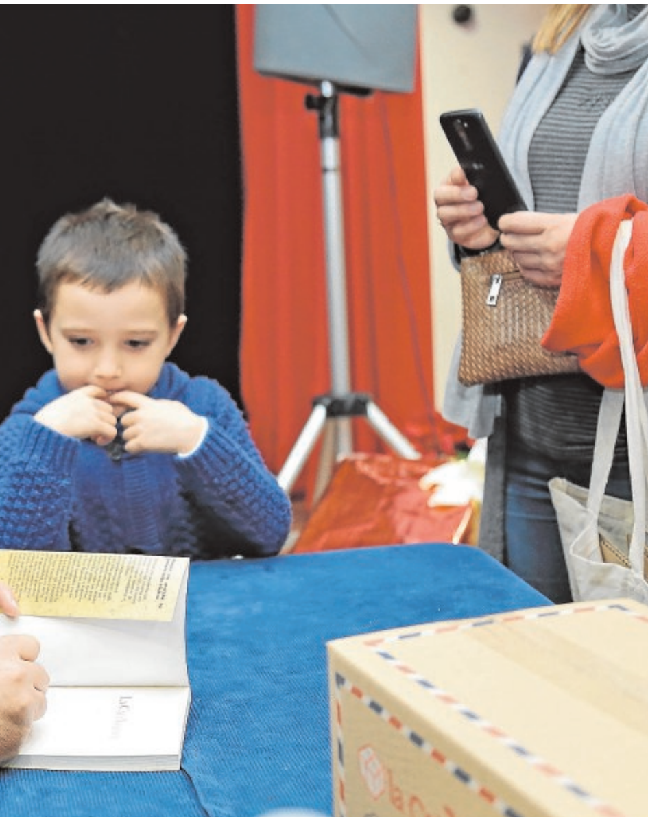
del proyecto en la caseta municipal de Lantejuela

Navidad en el salón de la Plaza del Carmen, a las 18,00 horas. El programa de conciertos, que comenzó ayer, se completa mañana con la audición de los Talleres de música y movimiento de la escuela municipal, a las 17,00 horas, en la Casa de la cultura. B.M.