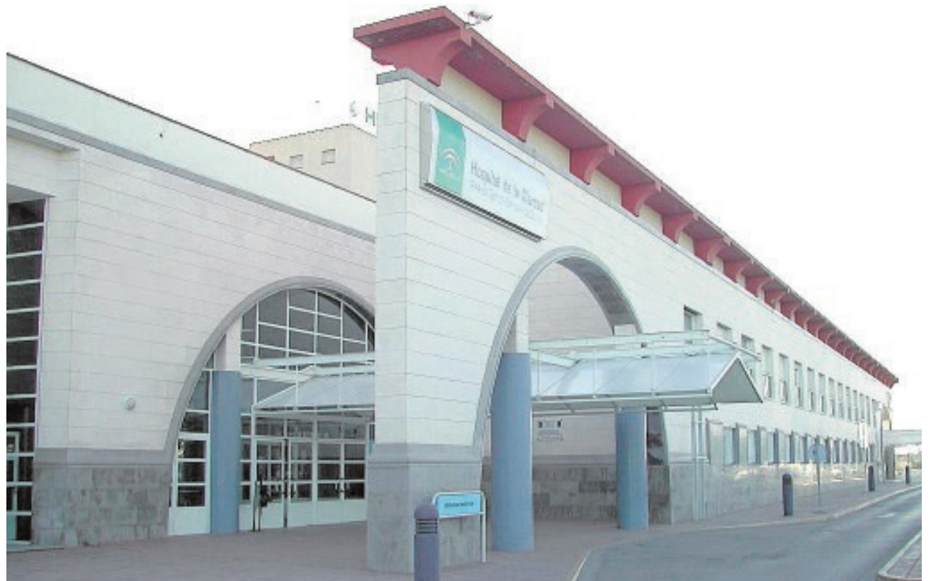
Puerta de entrada del Hospital de la Merced de Osuna

En la misma línea, desde el año 2012 los pacientes de esta Área Sanitaria que sufren un infarto se recuperan de forma más rápida, tanto física como psicológicamente, en la Unidad de Rehabilitación Cardíaca del Hospital Comarcal de la Merced de Osuna. En los diez primeros meses de este año, un