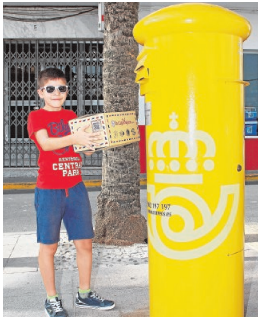
Los primeros niños lantejonenses ya han enviado su «caja viajera»