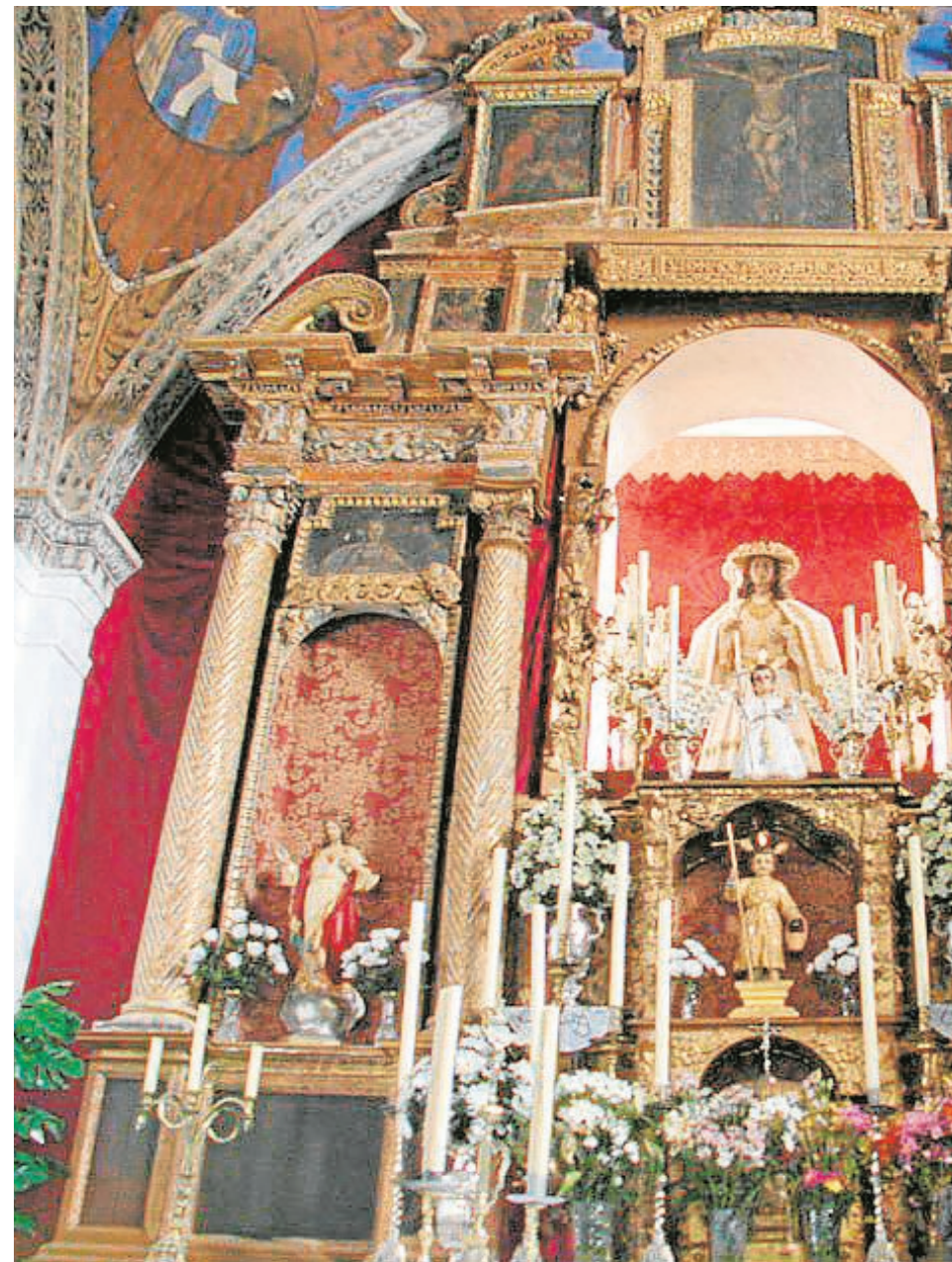
La pugna por el Niño Bellotero, de la Virgen de Guaditoca, deja estampas como los