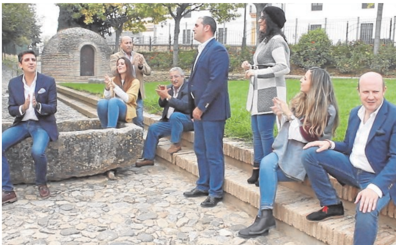
Los componentes del grupo Punto y Aparte, de La Puebla de Cazalla

mes de enero. Tras aprobar las obras de colocación del sistema anti-incendios, la reapertura de la biblioteca tendría lugar entre el 6 y el 20 de enero. Se pondría fin de esta manera a un problema que se ha extendido en los últimos siete meses.