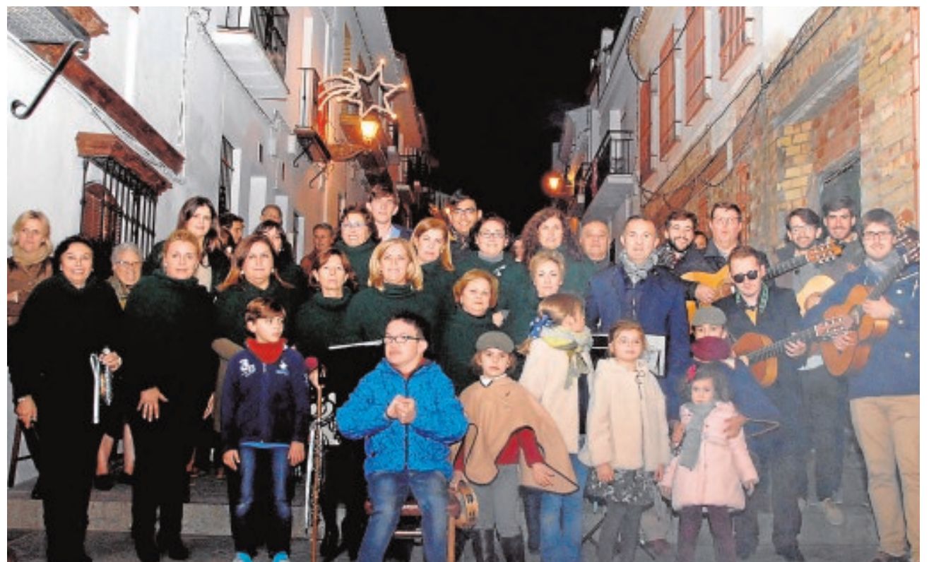
Actuación del Coro de Campanilleros de San Juan al pie de las escaleras de El Cerro