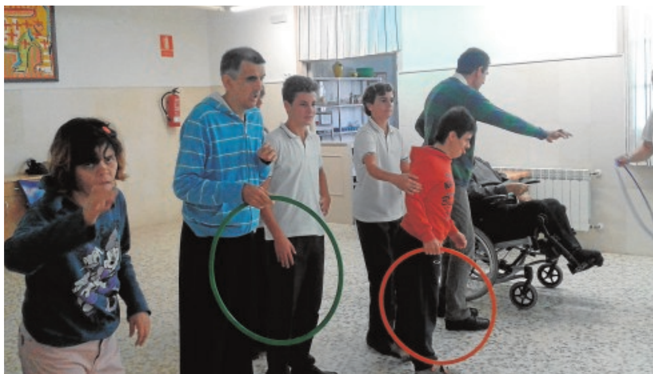
Alumnos del colegio Altasierra ayudan a personas discapacitadas de forma habitual

a fecha de 1 de enero de 2016, frente a 44.388 empadronados a fecha 1 de enero de 2015. Le sigue Écija, que en este periodo ha pasado de 40.320 habitantes empadronados a 1 de enero de 2015, a 40.270 a la misma fecha de 2016.