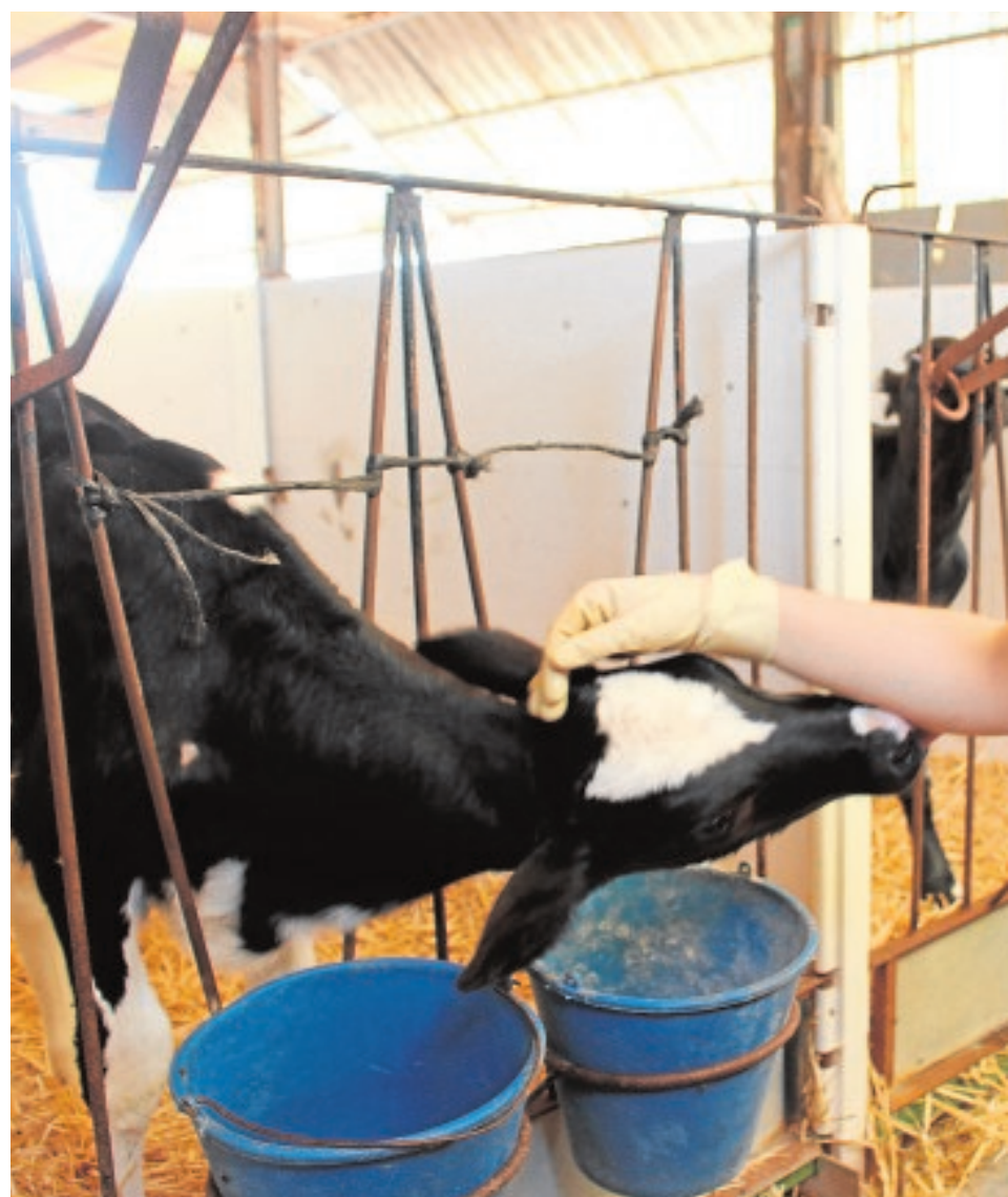
Entre 50.000 y 60.000 litros de leche diarios se producen en el municipio. En la imagen, una vaca en el ordeño.

La práctica totalidad de la leche que se produce posee el nivel Triple A, el máximo estándar de calidad