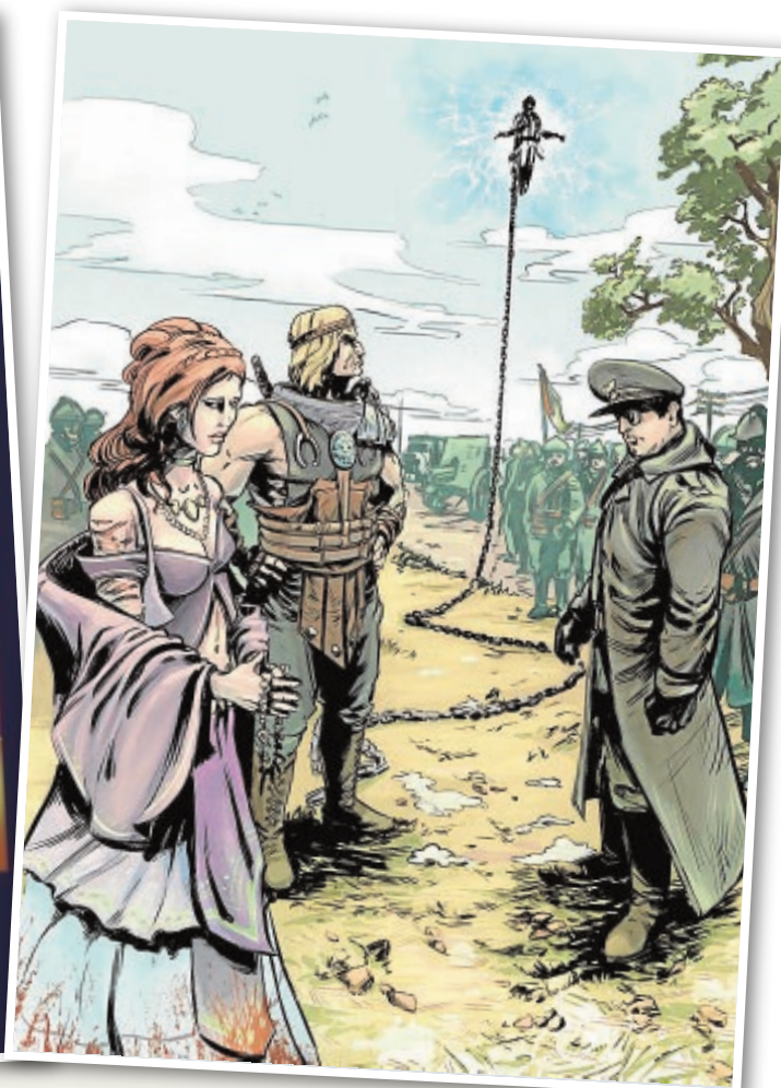
Tres equipos trabajan en los cómics, uno para narrar las batallas clave en la toma de Madrid: Jarama, Brunete y Guadalajara. En ellas los superhéroes luchan al lado de personajes históricos