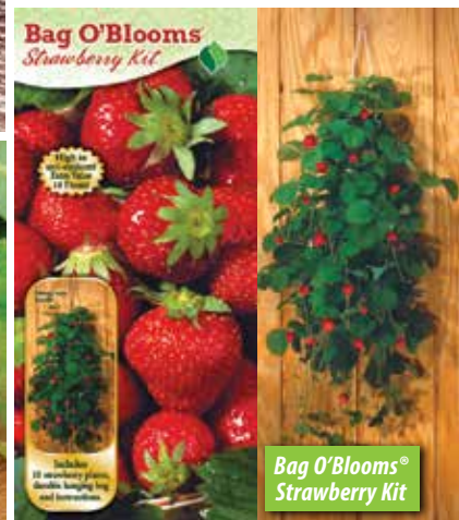
Bag O'Blooms Strawberry Kit