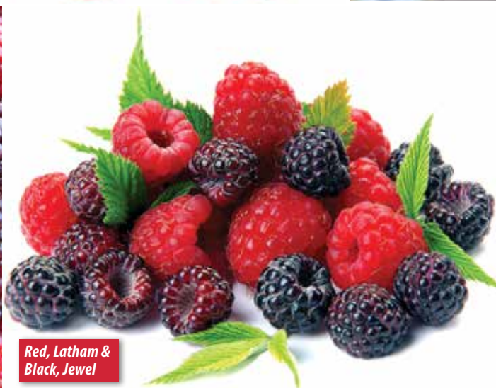
Red, Latham & Black, Jewel