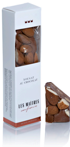
NOUGAT AUX CHOCOLAT