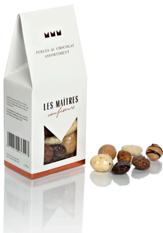
PERLES AU CHOCOLAT ASSORTI