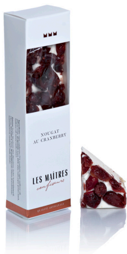
NOUGAT AU CRANBERRIES