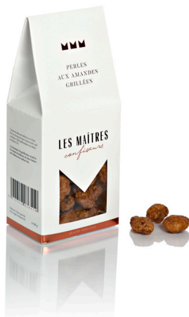
PERLES AUX AMANDES GRILLEES