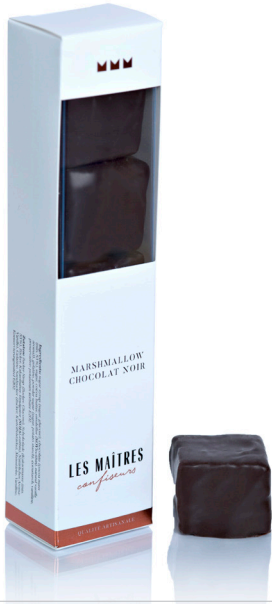
MARSHMALLOW CHOCOLAT NOIR