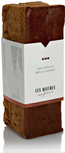
MIEL & CAMEL