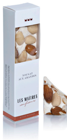
NOUGAT AUX AMANDES