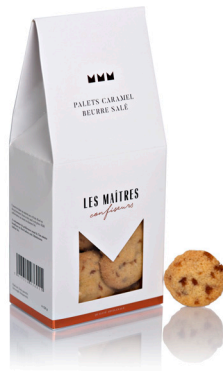
PALETS CARMEL BEURRE SALÉ