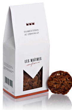
FLORENTINES AU CHOCOLAT