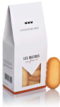
LANGUES DE CHATS