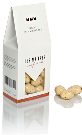
PERLES AU MASCARPONE