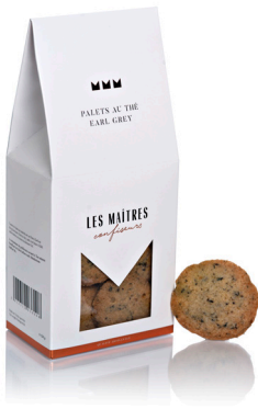
PALETS THÉ EARL GREY