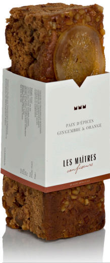
GINGEMBRE & ORANGE