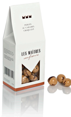
PERLES AU CARAMEL CROQUANT