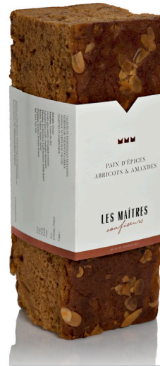
ABRICOTS & AMANDES