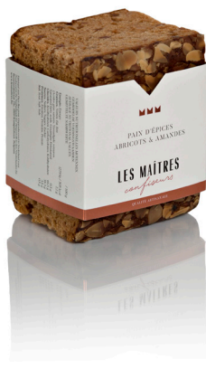
ABRICOTS & AMANDES