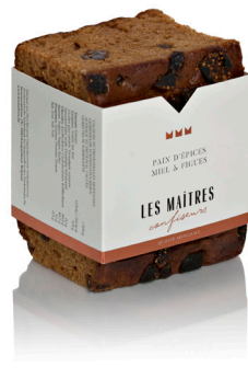
MIEL & FIGUES