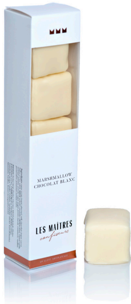
MARSHMALLOW CHOCOLAT BLANC