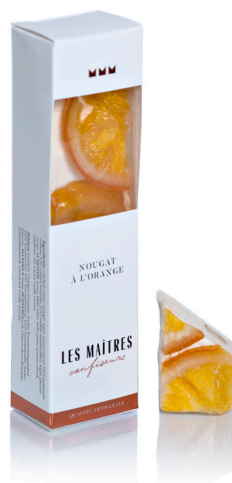
NOUGAT À L'ORANGE