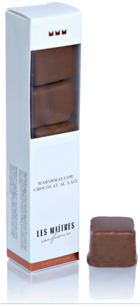
MARSHMALLOW CHOCOLAT AU LAIT