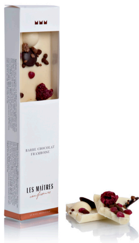
BARRE CHOCOLAT FRAMBOISE