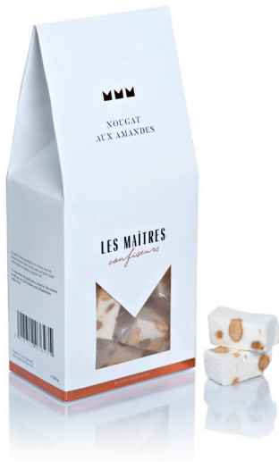
NOUGAT AUX AMANDES (MINI)