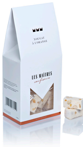
NOUGAT A L'ORANGE (MINI)