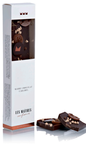
BARRE CHOCOLAT CARAMEL