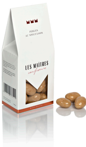
PERLES AU SPECULOOS