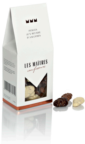
PERLES AUX BEURRE D'AMANDES