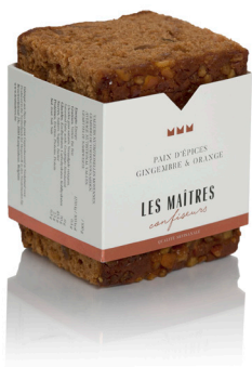
GINGEMBRE & ORANGE