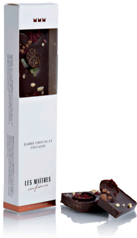
BARRE CHOCOLAT PISTACHE