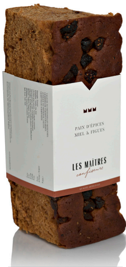
MIEL & FIGUES