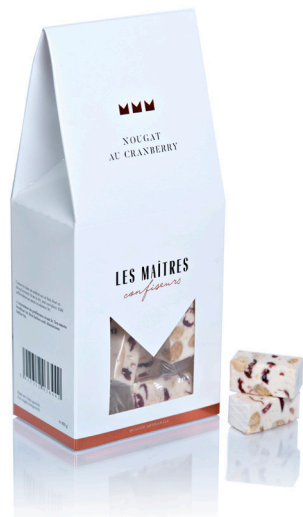
NOUGAT AU CRANBERRY (MINI)