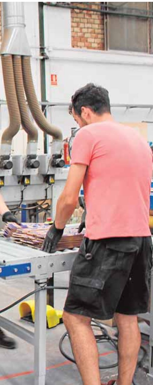
lada en Sanlúcar de Barrameda

dinario de Urgencia Municipal en la La Luisiana y El Campillo. La información necesaria será proporcionada desde los Servicios Sociales del Ayuntamiento de La Luisiana y la Tenencia de Alcaldía de El Campillo.