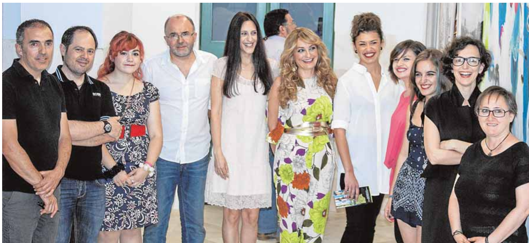
La primera edición de «Conectiva» reúne en una exposición el trabajo de 12 artistas multidisciplinares y con un fuerte vínculo con la localidad

en el Virgen de la Macarena la iniciativa «El museo en pijama», donde en colaboración con el Museo Arqueológico de Sevilla enseñarán a los pacientes más pequeños el relieve de Estepa y reconstruirán un instrumento romano, el «cornu». B.M.