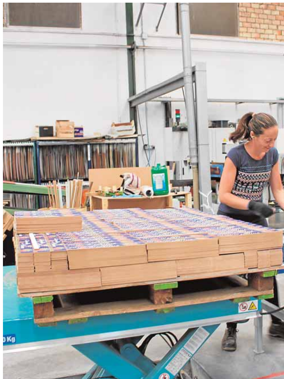
El complejo reúne seis líneas de producción de cajas y envases más otra línea instalada