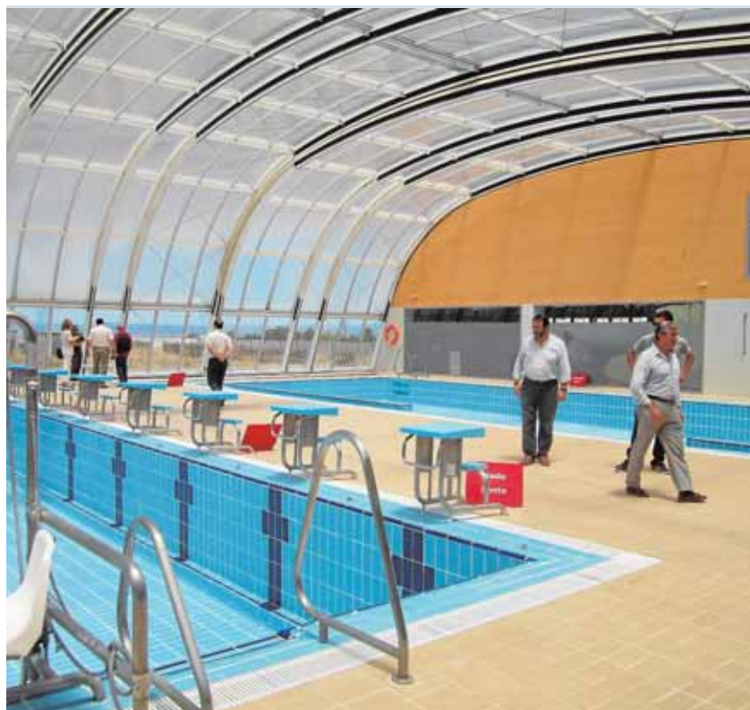
El Ayuntamiento reclamaba desde febrero poder acceder a la piscina A.M.

Aunque la inauguración oficial será el viernes, desde la organización afirman que «desde el jueves por la tarde podrán venir e instalarse los participantes que estén ya en Mairena». Tras el pistoletazo de salida casi 70 horas por delante, cuyo horario tope será el domingo a las siete de la tarde, momento del cierre oficial.