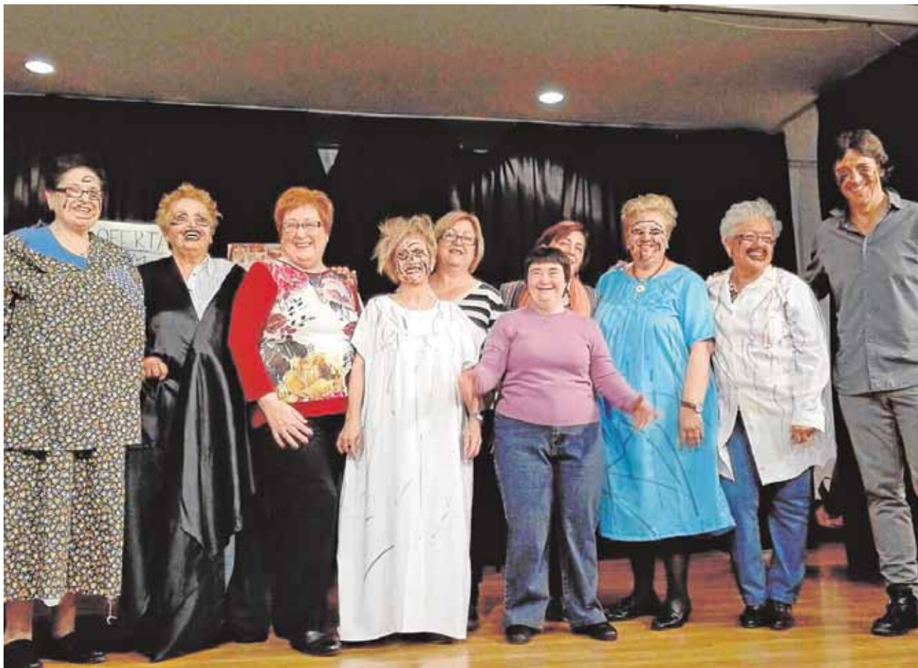
Las abuelas del grupo de teatro Rosa Viva levantan expectación en Tocina y Los Rosales durante los estrenos J.C.R.

la hermandad matriz de San Benito Abad, patrón de Castilblanco de los Arroyos. Los burguilleros procesan desde hace siglos gran devoción a la imagen del Santo que se venera a doce kilómetros de Castilblanco en una ermita en el valle del Río Viar. J.C.R.