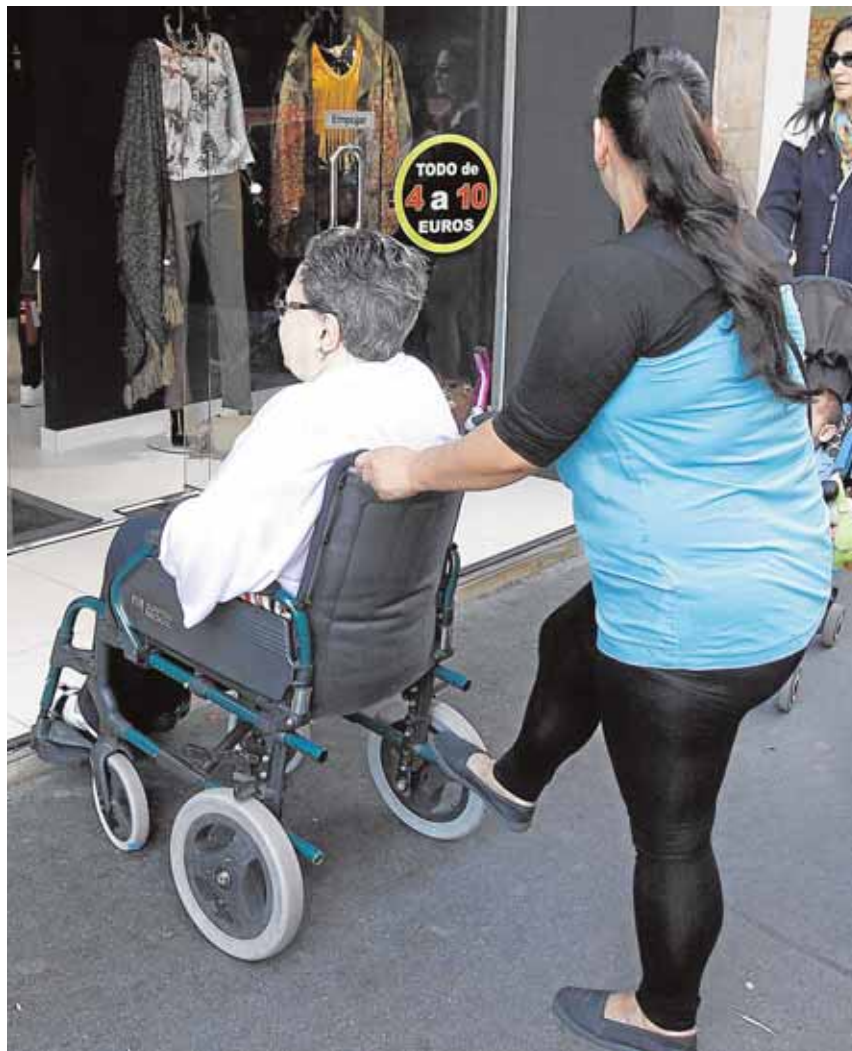
El hospital de Bormujos lanza un programa pionero de apoyo al cuidador M.A.