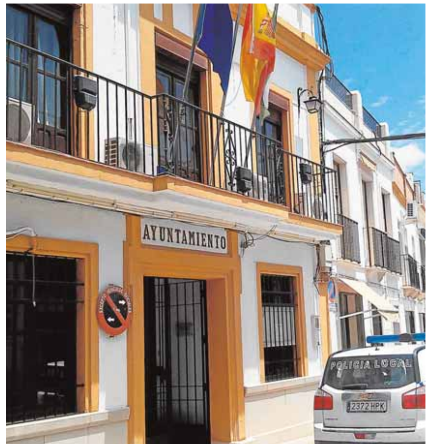
Los comerciantes se reunieron en el Ayuntamiento para pedir ayuda B.M.

Cada noche, y hasta llegar la mañana, una patrulla vigilará las calles del pueblo y «los puntos calientes», en especial las entradas y salidas. Esta