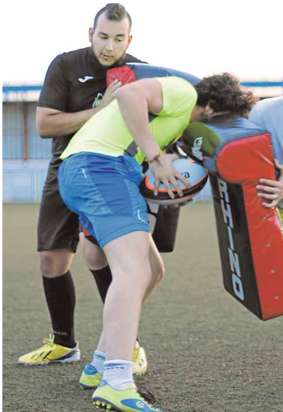
El nuevo equipo de rugby ha despertado el interés y la curiosidad de los

Poco a poco la idea va tomando forma: un par de negocios locales se han interesado por patrocinarlos, mientras el Ayuntamiento les ha cedido un par de horas a la semana las instalaciones deportivas. Sin embargo, les han comu-