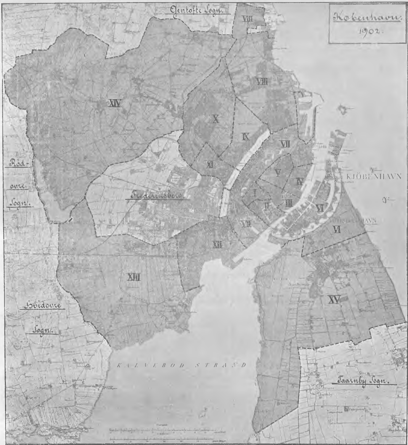
Oversigt over Befolknings-, Beboelses- og Dødelighedsforhold i ethvert af Stadens hygiejniske Kvarterer i Aaret 1901.