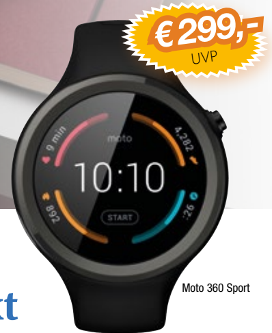
Moto 360 Sport