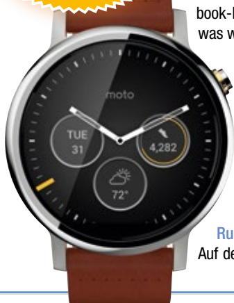
Moto 360 black leather