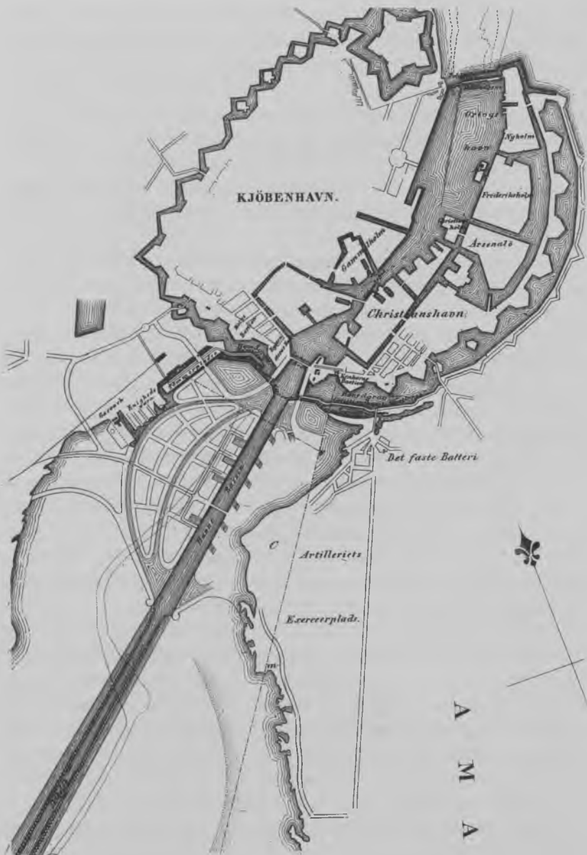
Murrays projekt til en sydhavn. Bemærk det gamle kanonbådsløb fra krigen med englenderne