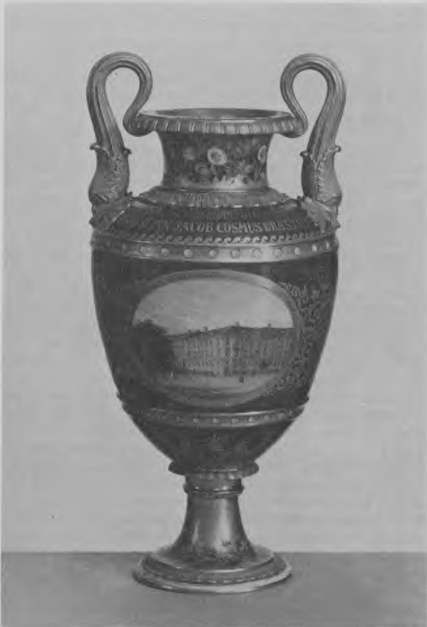
Vase fra Den kgl. Porcelainsfabrik, skænket politidirektør Cosmus Bræstrup 1860