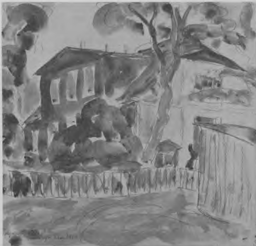
Landstedet »Christiansminde« på Strandvejen, nu Østerbrogade 111-117 Akvarel af Sigurd Swane 1924

rens produktion, idet hans speciale i almindelighed var blomster- og figurbilleder, er det til gengæld typisk for hans manér, præget som det er af en »hektisk, noget metallisk klingende farveglød«.