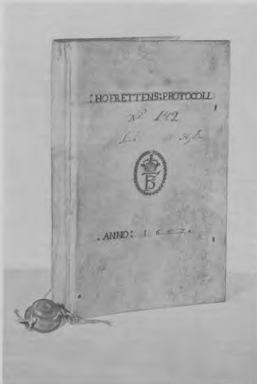
Retsprotokollen med det kgl. monogram i guld