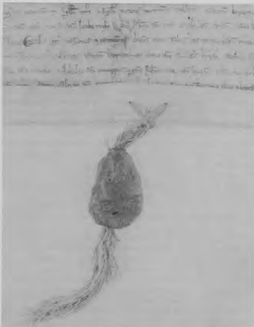
Stadsarkivets ældste dokument, bisp Peder Skjalmsen Bangs stadfæstelse af stadsretten af 1254, dat. 20. februar 1275, fylder i 1975 700 år. Her ses et afsnit med byens segl under. Kun et brudstykke af seglet er bevaret