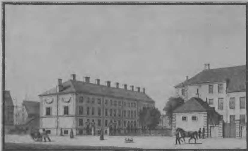
»De engelske huse« i Toldbodgade, ca. 1875 Akvarel af ukendt kunstner

italienske Stats Turistbureau (Enit) også ydede økonomisk støtte til dens gennemførelse. Et smukt illustreret katalog udarbejdet af Armando Ravaglioli og oversat til dansk gav de besøgende et udmærket indtryk af pladsens udvikling. Ialt blev den set af mere end 6000 gæster.