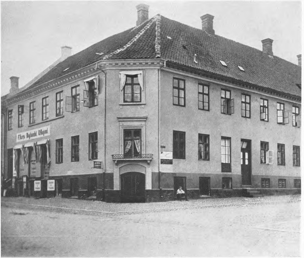
Den Bruun'ske Gaard i Fredericia