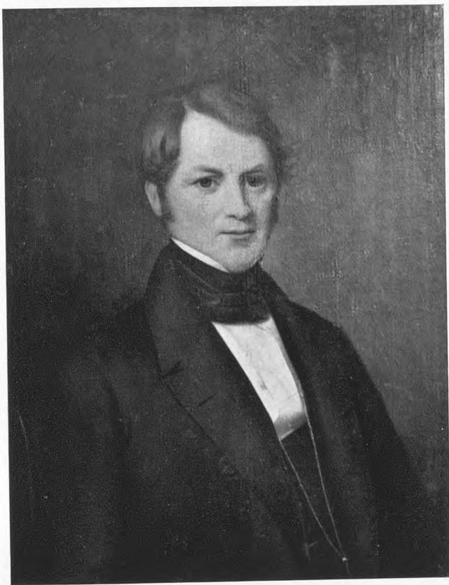
Købmand ELIAS BENDZ MUUS 1805—1893