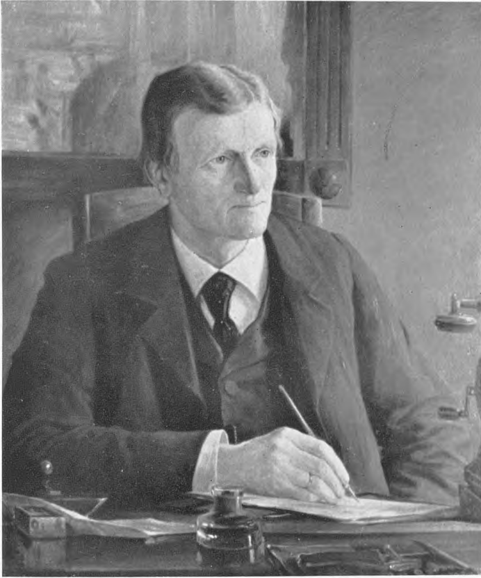
Grosserer, fhv. Handelsminister OSKAR B. MUUS 1847—1918