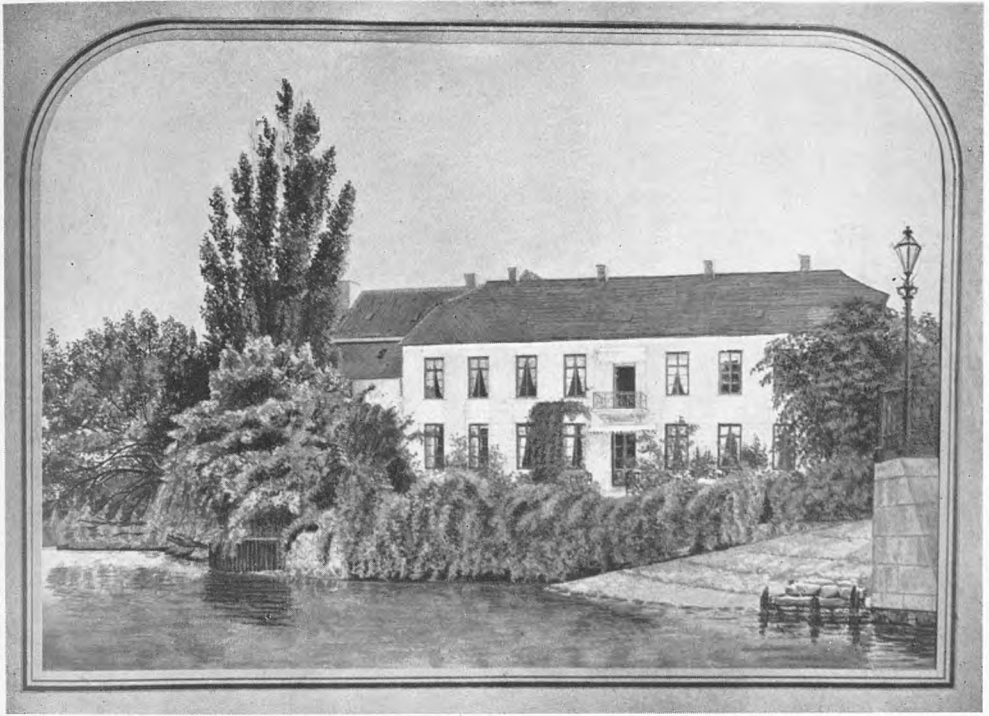
„Sukkergaarden“ i Odense