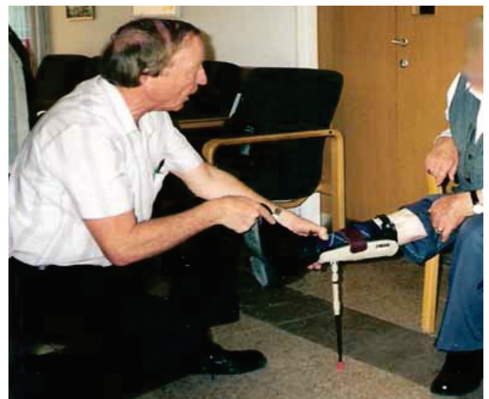
רגלית לרגל ישרה (עבור פרטיזן יהודי ממלחמת העולם השנייה)

"תן לי דוגמאות", ביקשתי. "פנה אליי אדם שאיבד את ידו השמאלית במלחמת יום הכיפורים בתעלת סואץ. מדובר באדם דתי שרצה מאוד להניח תפילין. הלכתי לחב"ד וביקשתי שילמדו אותי כיצד מניחים תפילין בכל מיני שיטות. לאחר מכן התרכזתי בפיתרון הטכני והגעתי למסקנה שאפשר להכין מתקן דמוי גלגלת שאדם מכניס ידו לרצועת התפילין לאחר מכן הוא מעביר ידו למעלה ולמטה והתפילין מתקפלים סביב ידו הבריאה ללא צורך בעזרה של יד נוספת. המתקן עצמו נעשה מחומרים המצויים בסביבה כגון גלגל, בקבוק טמפו שמשמש כמאריך, ותפס שמוצמד למשקוף הדלת".