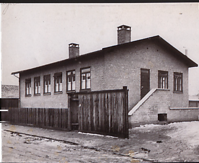
Det nyopførte hus på Drejervej 6, 1944.