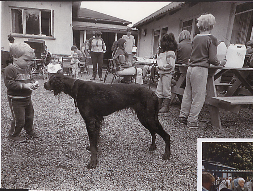
Kirkens Korshærs sommerlejr i Skaverup ved Vordingborg i begyndelsen af 1980'erne. Den har gennem alle årene været et fristed for mødrene og deres børn.