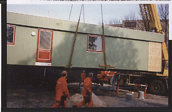
En ny skurvogn, den tredje Hotel Jens, bugseres på plads i april 1990.

Tomsgårdsvej henvendte sig ofte på Drejervej for at få hjælp.