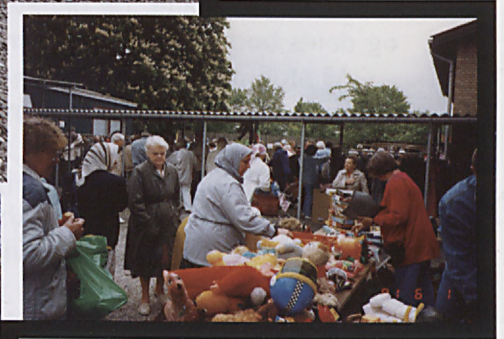
De to årlige loppemarkeder på Drejervej er en vigtig indtægtskilde. Billedet er fra sommerens loppemarked i 1991.