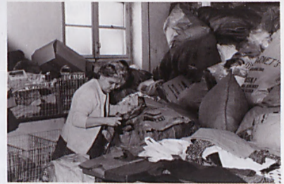
Tøjet væltede ind i kasser og i sække, nogle gange hele læsfulde.