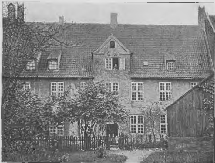
VALKENDORFS KOLLEGIUM CA. 1860, SET FRA HAVEN.

kunne fjernes. En saadan Ombygning vilde koste 15000 Rbd., naar Bygningen udvidedes til Bolig for 22 Alumner, 14000, naar det tidligere Antal af 16 Alumner bibeholdtes. — I Skrivelse til Ministeriet af 21. Sept. 1863 udtalte Konsistorium sig til Gunst for denne sidste Plan, og paa Finanslovforslaget for