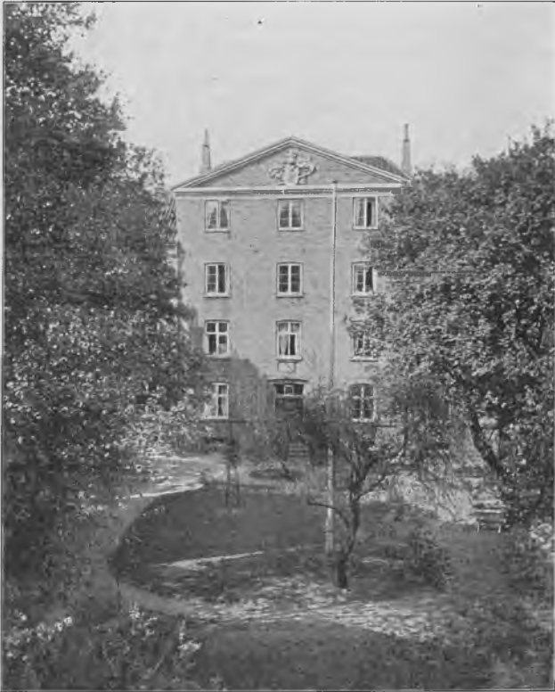
VALKENDORFS KOLLEGIUM EFTER OMBYGNINGEN 1913. Efter Fotografi.