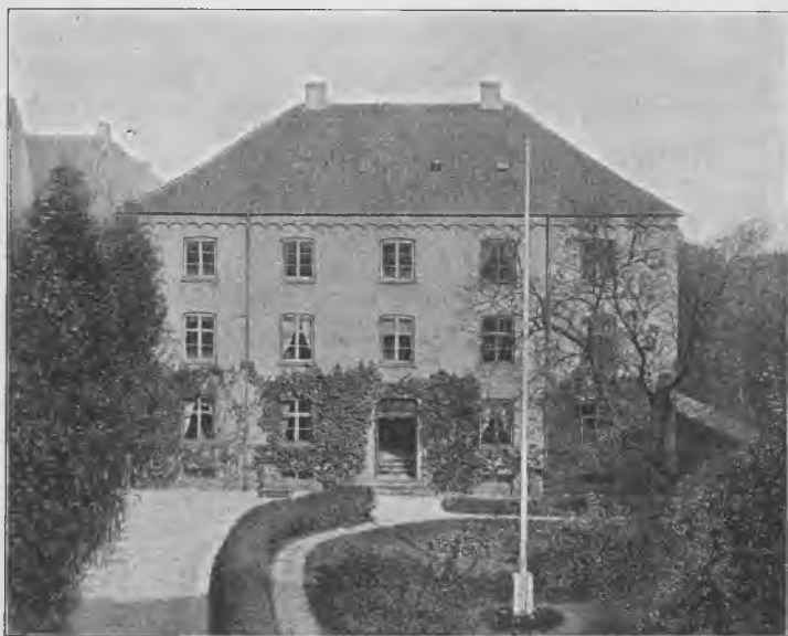
DET NY VALKENDORFS KOLLEGIUM, OPFØRT 1865—66.

butts til Alumnerne (denne havde i Aarene før 1865 varieret mellem 20 og 30 Rdlr. aarlig til hver Alumne), overtoges Distributsen indtil videre af Kommunitetet, idet den til Stipendier fastsatte Sum ved Finansloven 1866—67 forhøjedes med 1000 Rdlr. aarlig; og siden