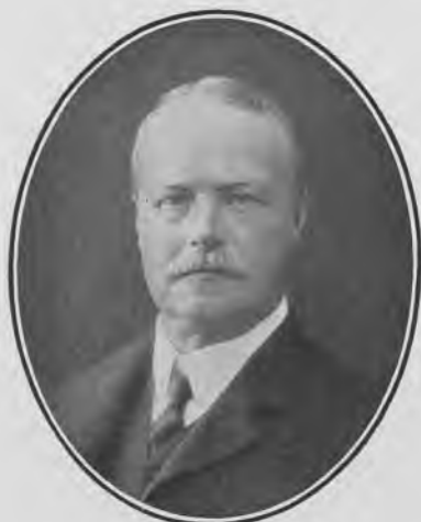
K. FABER. Efter Fotografii

Til at afhjælpe dette Savn gjordes det første Skridt ved et Kandidatgilde paa Kollegiet den 24. Febr. 1904, idet vedkommende Kandidater, ude af Stand til at imødesee en evig Skilsmisse indbyrdes og med deres kære Studenterbolig, vedtog for Fremtiden at mødes