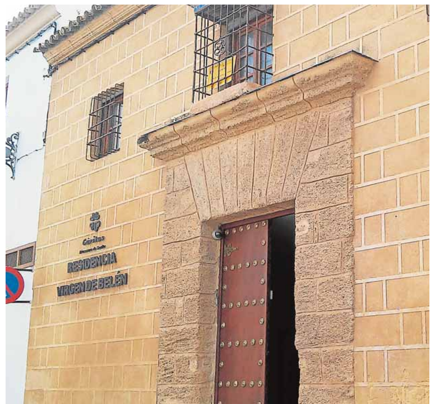
La residencia ocupa el antiguo convento de Santa Catalina

La residencia se destinará a adultos de edades de entre los 16 a los 60 años con discapacidad intelectual gravemente afectada o con alto grado de falta de autonomía. Los servicios que prestará se adecuarán a la asistencia y el desarrollo de los usuarios, por lo que contará con personal médico, psicólogos, neurólogos, trabajadores sociales, fisioterapeutas y enfermeros destinados al cuidado y al apoyo de forma personalizada.