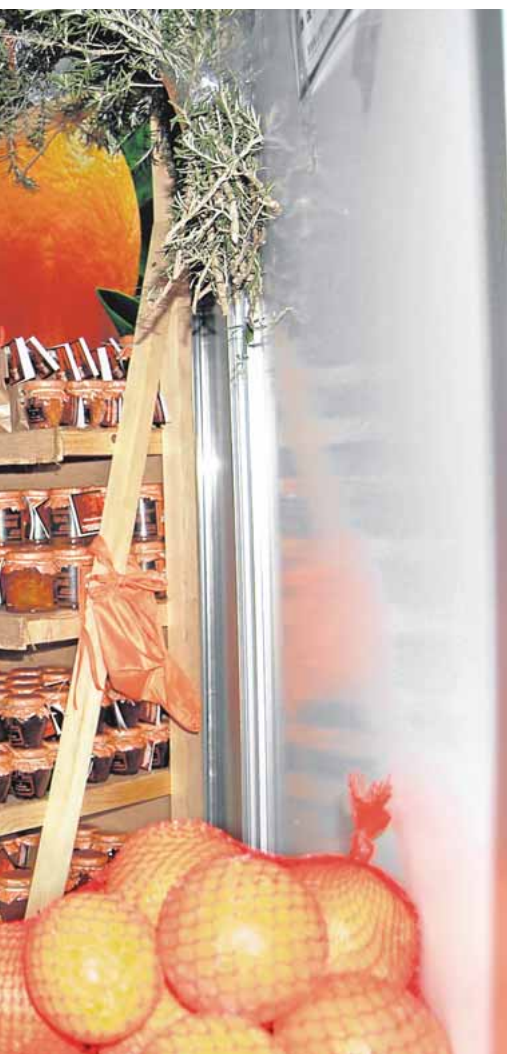
de sus productos

nisterio de Cultura. Platea traerá al teatro de la Villa del Conocimiento y las Artes hasta seis espectáculos a lo largo de todo 2016, en los que se podrá ver a actores y actrices como Beatriz Carvajal o la compañía de Rafael Álvarez «el Brujo».