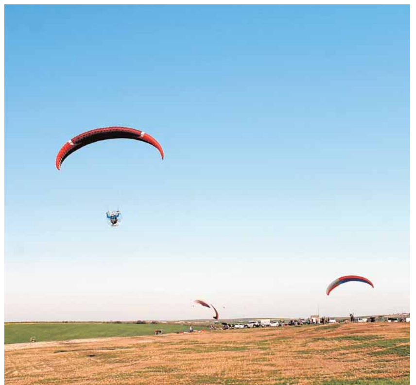
El nuevo terreno es ideal para el aeromodelismo y paramotor

Así, la intención de la entidad es fomentar la práctica del aeromodelismo y el paramotor en Écija con espectáculos de vuelo, cursos de formación y otros eventos.