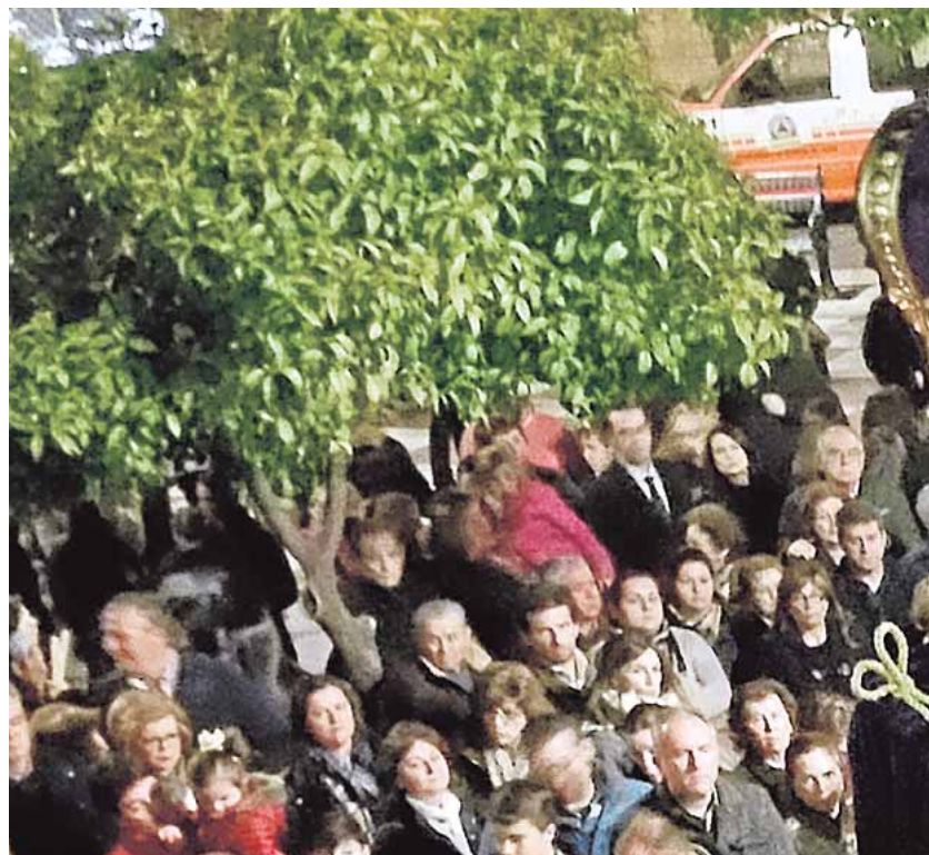
Mairena rinde tributo al Cristo de la Cárcel desde el siglo XVII

Como manda la centenaria tradición mairenera, cada 11 de marzo el Santísimo Cristo de la Cárcel, acompañado por Nuestra Señora del Amparo, abandona su capilla en dirección a la Parroquia de Nuestra Señora de la Asunción, donde se expone en el altar mayor para recibir una semana de adoraciones y cultos. Tras este periodo y la respectiva misa, el Cristo co-