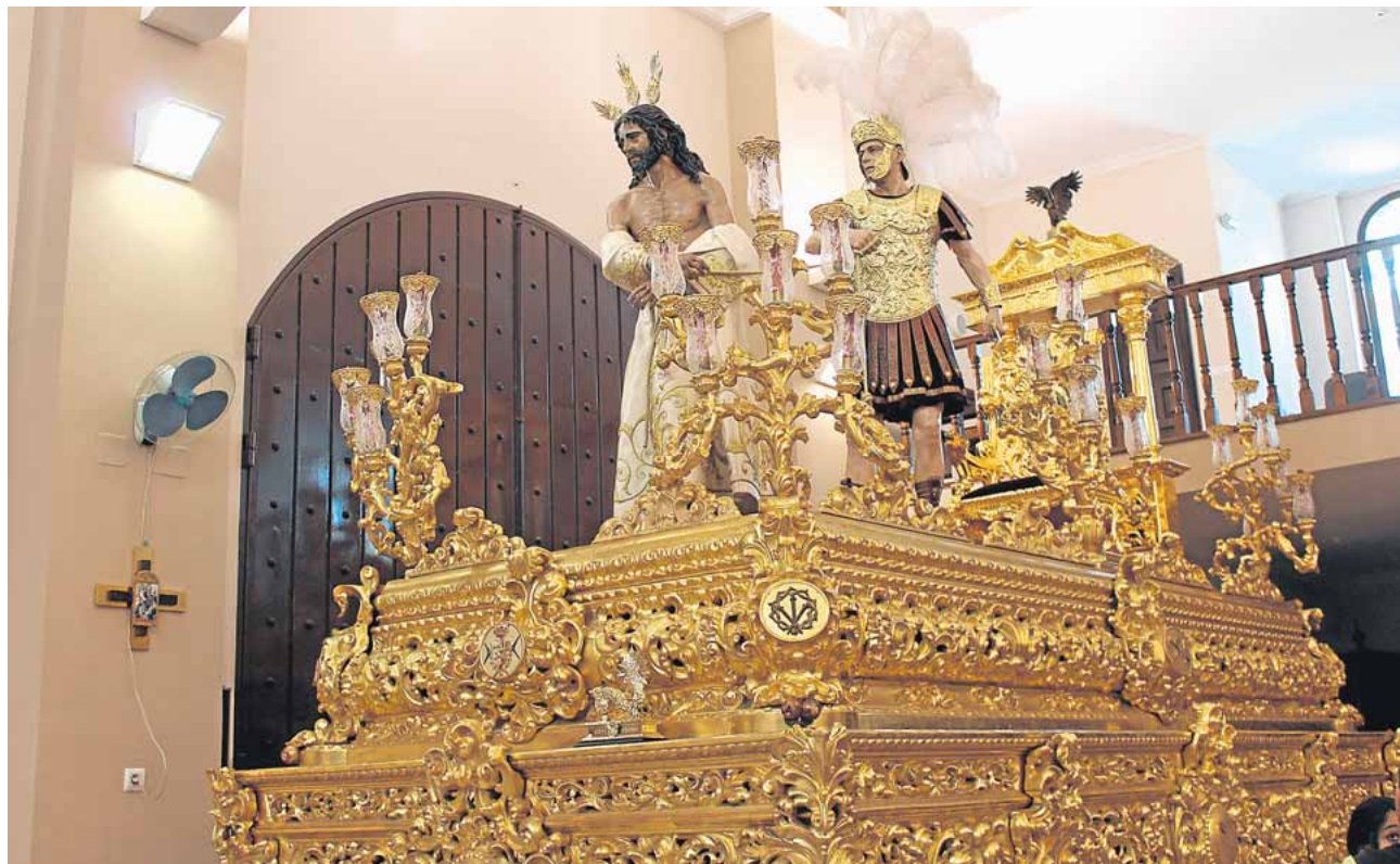
El Señor en su paso, preparado para la procesión de mañana

que se ha convertido en un clásico en estos años. A las diez y cuarto saldrá un autobús desde la gasolinera para la finca, donde se plantarán árboles y arbustos. Para ello es indispensable llevar una azada y una regadera.