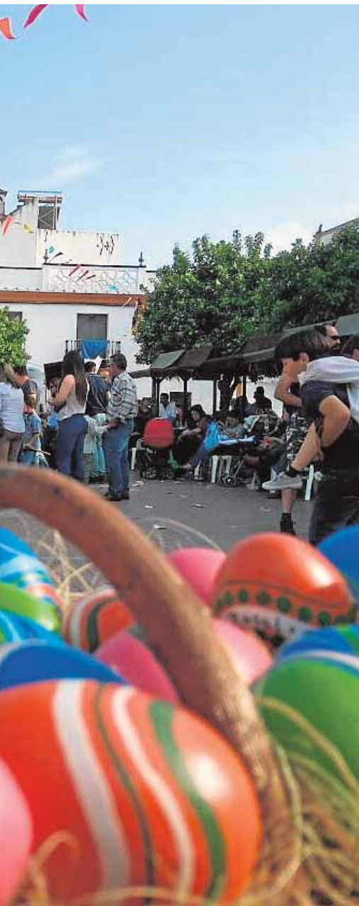
as de huevos de colores

ma Andalucía Orienta para facilitar la inserción laboral. El horario de atención será de miércoles de 9.00 a 14.00 horas. Entre otros, se facilitará el acompañamiento en la búsqueda de empleo y asesoramiento para el autoempleo.