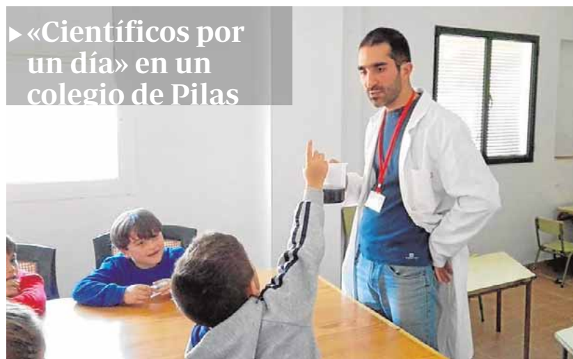
El AMPA del colegio Virgen del Rocío de Pilas organizó las jornadas «Científicos por un día», donde los jóvenes pudieron realizar todo tipo de experimentos científicos, a cargo de la empresa Engranajes. D.C.