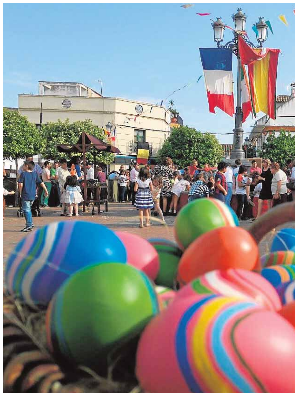
La Plaza de Santa Ana se transforma con los vecinos vestidos de colonos y las cestas

La tradición carrosaleña tiene su correspondencia en otros municipios andaluces de ascendencia colona como Guarromán y Carboneros en Sierra Morena, que celebran la Fiesta de los Pintahuevos, o Santa Elena, donde el nombre cambia a «Rulahuevos». También en Asturias, en Polos de Siero, se mantiene la Fiesta de los Huevos Pintados, declarada de Interés Turístico Na-