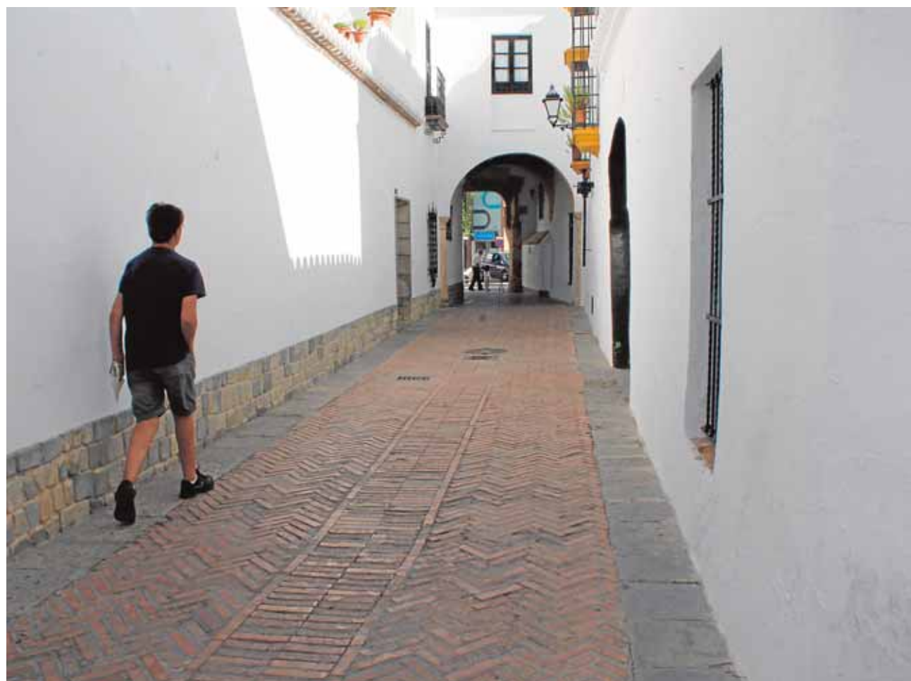
El callejón del Niño Perdido de Utrera fue en su día parte del barrio judío de la localidad

Por tanto, no es para nada extraño pensar, que en un lugar tan simbólico como el Niño Perdido de Utrera, que después fue hospital y lugar al que iban a parar los niños que eran abandonados, se ubicara en su día una calle fundamental para entender más de cinco siglos después la huella que dejó en la localidad el pueblo judío. Todo está por descubrir, es el momento de dejar que avance la investigación para poder escribir un nuevo capítulo de la historia de Utrera.