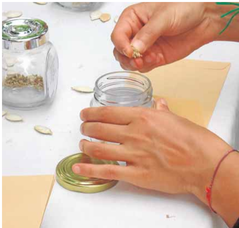
Jornada de intercambio de semillas entre agricultores

Destaca la gran importancia de realizar este tipo de iniciativas porque «cuando se recuperan las variedades locales no sólo se recupera la semilla, también el conocimiento asociado a ella». De esta forma, las semillas