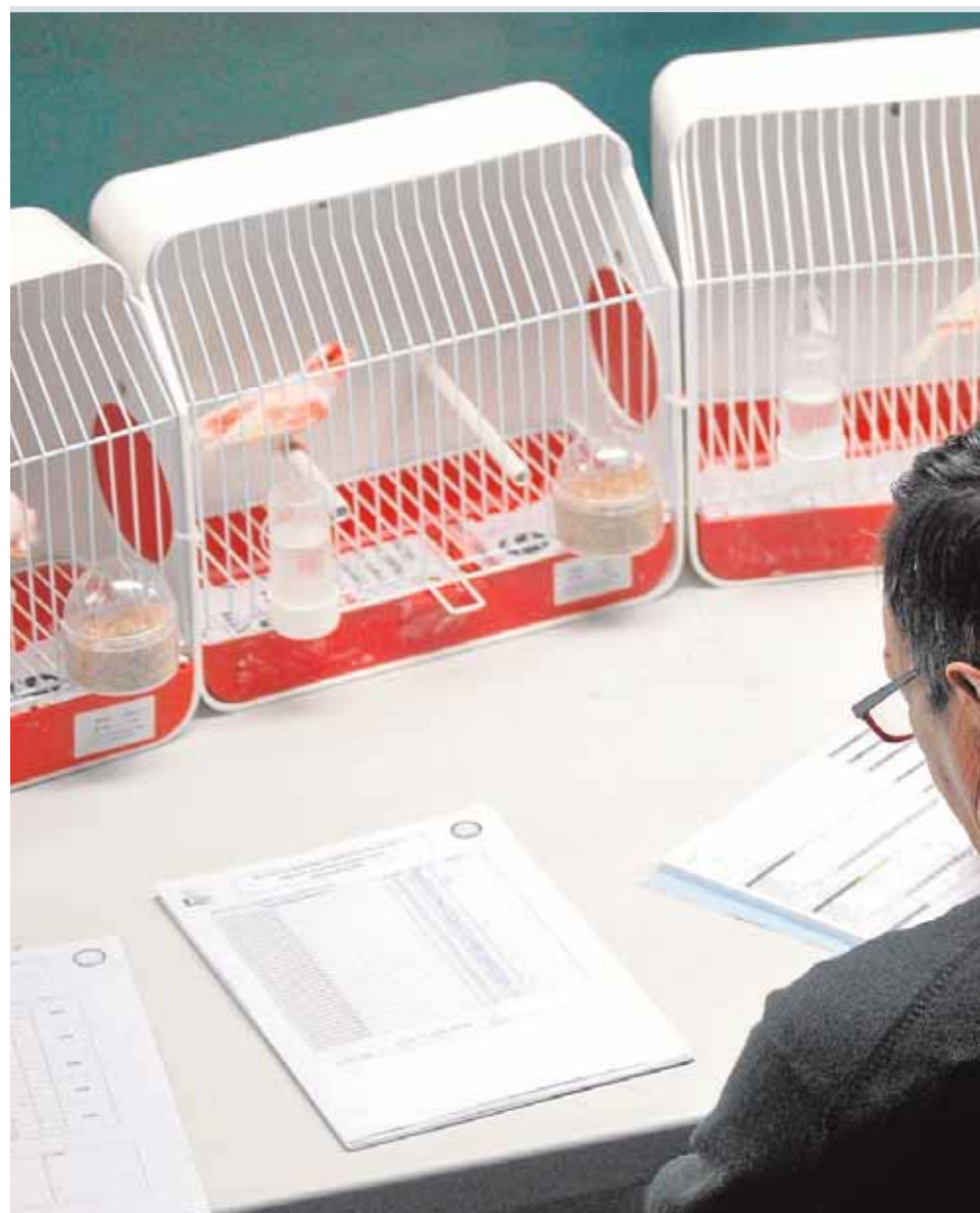
Unos jueces que deben pasar una etapa de formación y superar un complicado examen

Pero no es suficiente con criarlos, se trata de lograr que sean campeones. Entra en juego la genética y la selección. Para ello cuentan con las herramientas de las leyes de Mendel y hoy