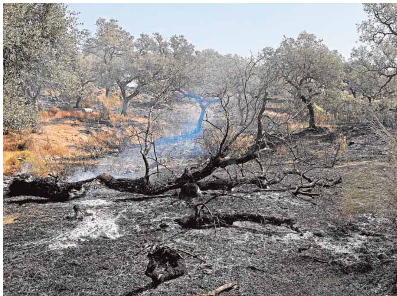
El incendio de El Castillo de las Guardas, declarado a finales de agosto, fue el más grave del año en Andalucía EFE

El pleno de la Diputación de Sevilla sacó adelante el pasado jueves en sesión ordinaria una declaración institucional avalada por los cinco grupos con representación en el ente provincial para instar a los ministerios de Hacienda y Administraciones Públicas y del Interior a que propongan al Consejo de Ministros en funciones la declaración de «zona afectada gravemente por una emergencia de protección civil» para paliar cuanto antes la depresión económica sobrevenida.