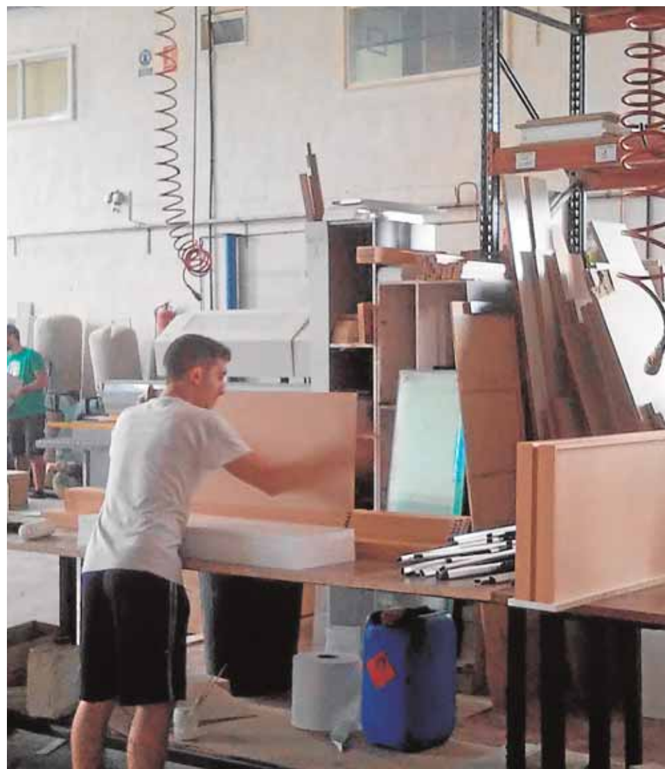
Los trabajadores de La Rodense transforman más de 30.000 tableros al año en mu-

Por último, hace una década llegaría el último cambio importante con una fuerte inversión por parte de los socios para innovar y desarrollar diferentes avances tecnológicos. Moder-