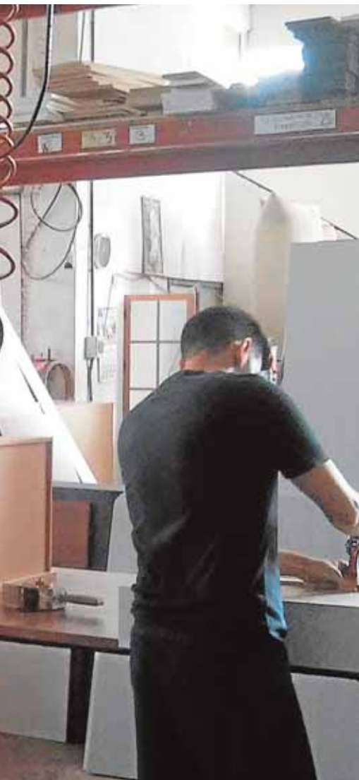
Muebles que se venden en toda España

señora de la Encarnación. La actividad, que tendrá lugar este sábado a las 20.00 horas, forma parte de las propuestas culturales que se extenderán durante los meses de octubre y noviembre, y que incluyen conciertos, teatro y visitas turísticas. B.M.