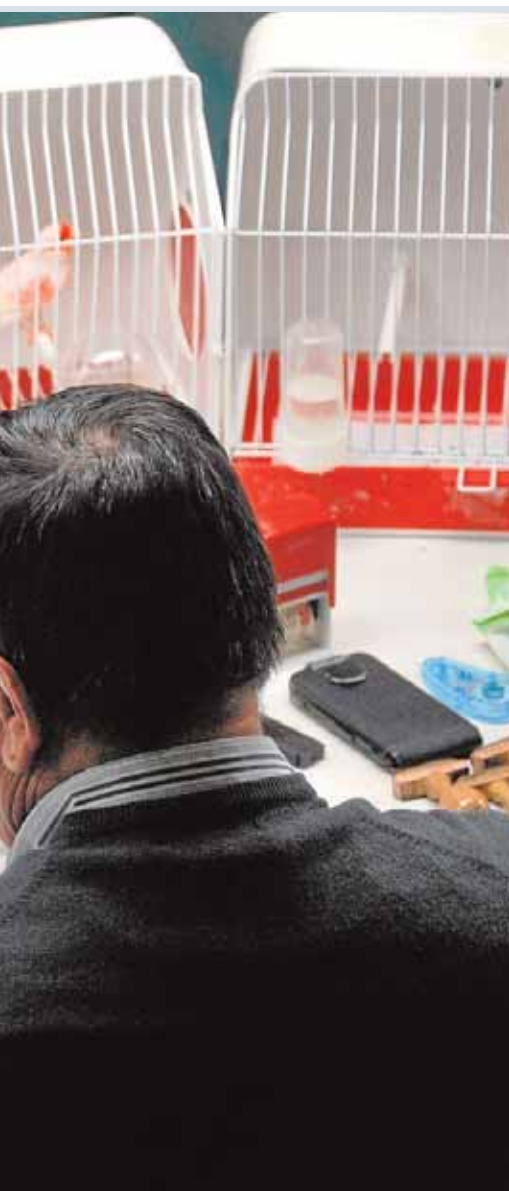
se encargan de evaluar los pájaros A.M.

del Alcor. Es gratis y se llevará a cabo en horario de 10:00 a 12:00 horas en el recinto de la feria. En la Policía Local se comunican los avisos llamando al teléfono 95 594 27 03, y también mediante la app gratuita Línea Verde de manera rápida y sencilla.