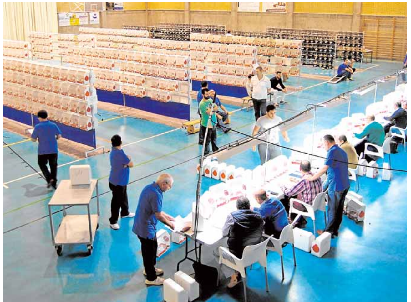
Los jueces examinan a cientos de ejemplares antes de tomar la decisión final en el último concurso de El Viso A.M.