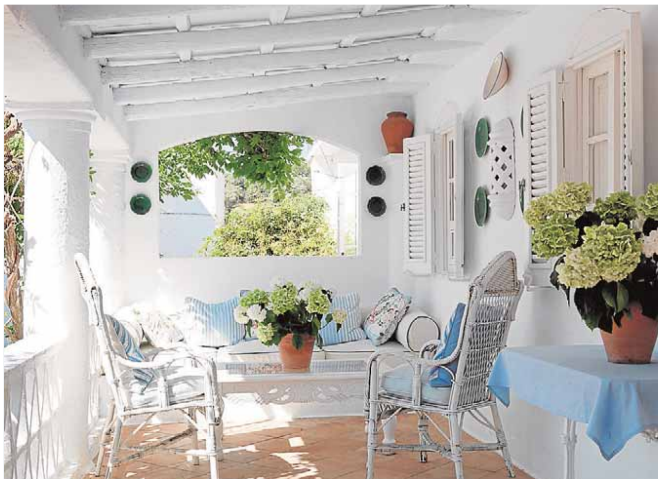
El cortijo de Trasierra está ubicado en la carretera de El Pedroso, a un kilómetro de Cazalla.

ciones musicales y concursos tradicionales. Además, el sábado tendrá lugar la salida procesional de la Virgen del Pilar y el miércoles 12 de octubre las fiestas del Pilar acabarán con la romería en el parque El Gergal de la localidad. G.J.L.