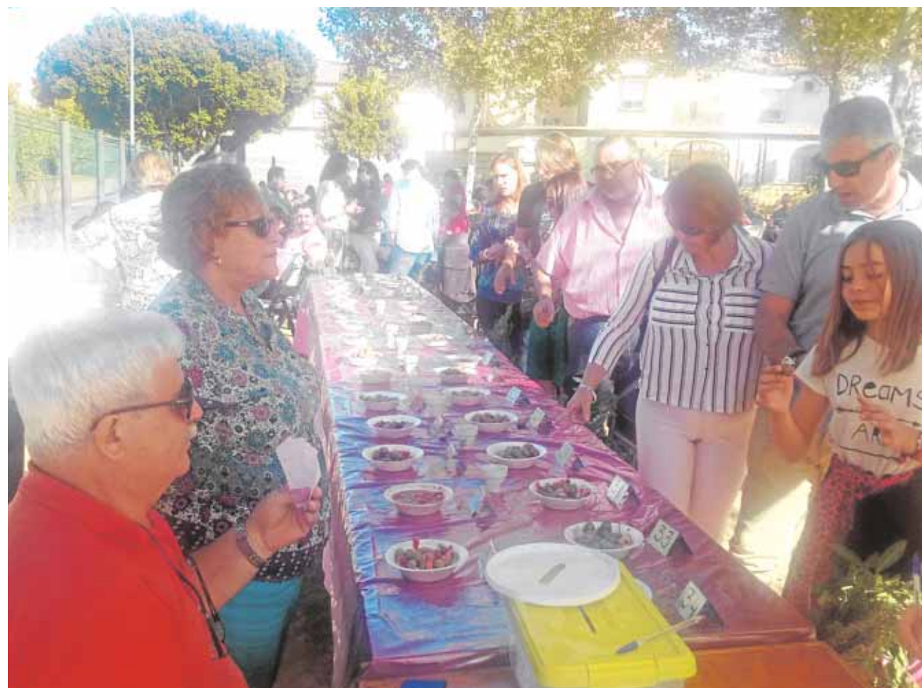
Los ganadores son elegidos por un jurado popular que conforman los asistentes al evento

Otro de los aspectos más positivos de este peculiar y sabroso concurso es que gane quien gane los premios en juego, hay un colectivo que siempre gana: los más desfavorecidos. Plaza del Sol monta de forma desinteresada una barra que gestionan ellos mismos como voluntarios, y a precios muy populares ofrecen bebidas y platos clásicos como paella, garbanzos con bacalao o migas. Todo lo recaudado por la asociación se destina a causas y colectivos sin ánimo de lucro. Solo el año pasado donaron alrededor de 1.500 euros a Cáritas, aunque van rotando. Como dice Morán: «Nosotros queremos que con este granito se pueda ayudar al máximo número de personas posible».