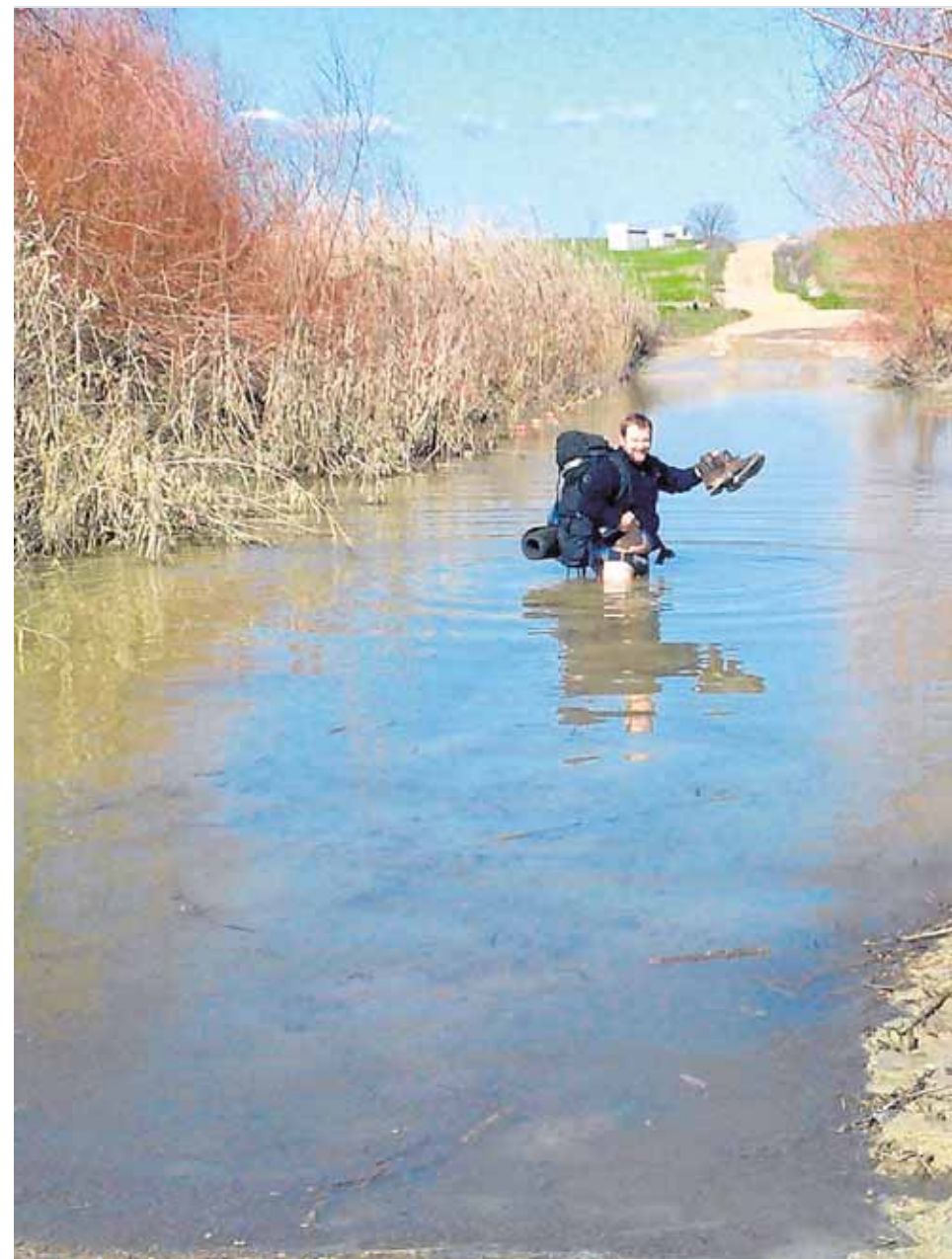
La crecida del Arroyo de Los Molinos obliga a los peregrinos del Camino de Santiago

El proyecto para edificar una pasarela peatonal en este punto que limita con los términos de Guillena, Gerena y Salteras está comprometido por la Diputación de Sevilla, según el consistorio guillenero, y así lo reafirmaron en diciembre de 2015. Reconocen que es una demanda histórica «tanto para la asociación que defiende a los peregrinos por la Vía de la Plata como para el consistorio, que lo ha aproba-