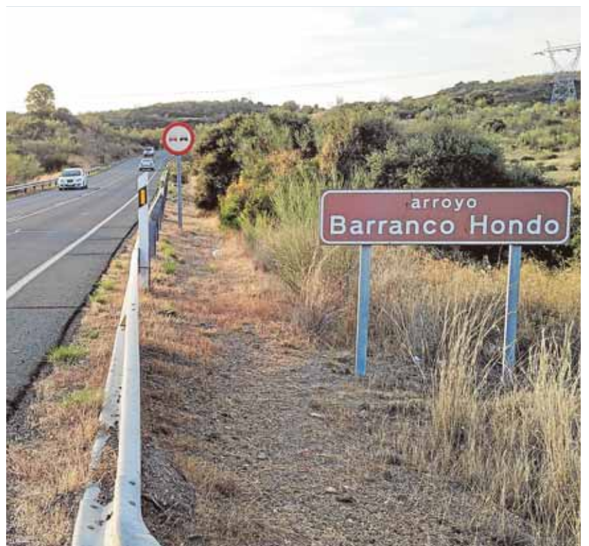
Las obras de mejora en Barranco Hondo están pendientes desde 2009 J.C.R.

El último informe de la Dirección General de Tráfico sitúa el tramo de Barranco Hondo de la carretera A-8013 como uno de los 300 puntos peligrosos de la red de carreteras de España. La vía tiene 19,61 kilómetros de longitud y según datos oficiales, tiene una intensidad media diaria de 2.025 vehículos, una cifra que contrasta con los más de 4.000 vehículos que refería la misma administración en 2009 para justificar las obras de mejora.