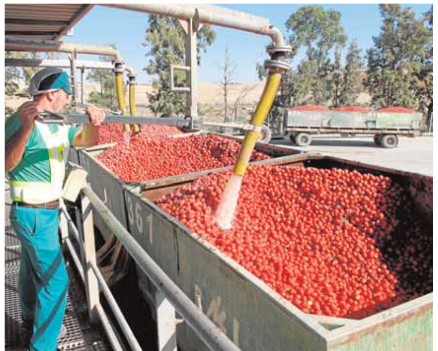
La campaña de recolección genera un millar de puestos de trabajo A.H.

A todo ello hay que sumar el millar de empleos que genera la campaña del tomate industrial, de julio a septiembre, la mayoría en Lebrija; el trabajo en las explotaciones agrícolas desde la