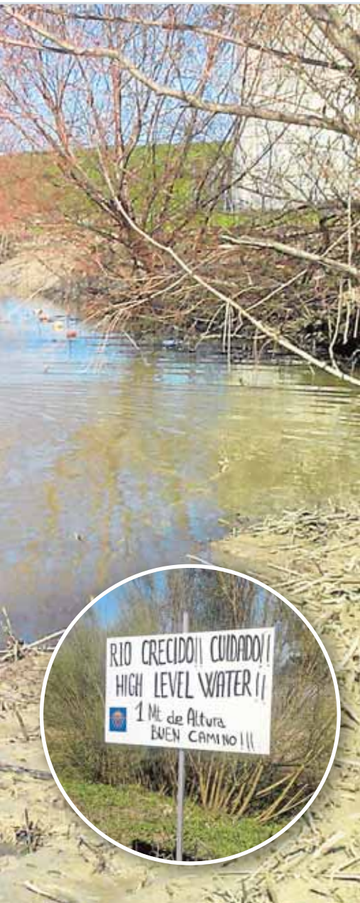
...o a sumergirse hasta la cintura

municipio que tengan pocos ingresos económicos. Para poder beneficiarse de ella el pasado 26 de octubre se abrió el plazo de solicitud. Las instancias pueden llevarse a los Servicios Sociales del Ayuntamiento hasta el 9 de noviembre. G.J.L.