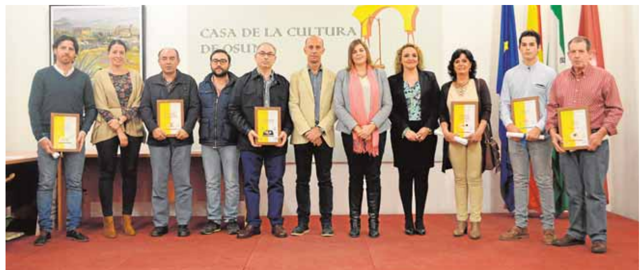
El restaurante Casa Paco y la cafetería-cervecería Santa Ana fueron los ganadores de la pasada edición