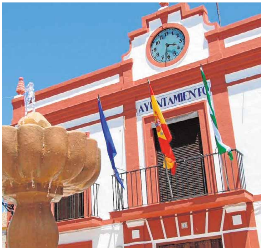
El Ayuntamiento será el primer edificio que lucirá la bandera

Todos estos símbolos, junto a la más moderna corona del escudo, que señala la elevación de Pedrera en 1557 como pueblo independiente de la jurisdicción de Estepa, también tendrán su valor en el nuevo estandarte. A espera de ver la decisión del jurado, que podría elegir a un ganador o declarar el premio desierto, la nueva bandera puede ser ya una realidad.