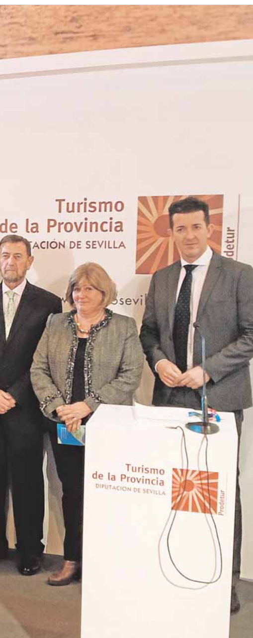
firmaron el acuerdo en Fitur

cin y vecinas desde su puesta en marcha. Según fuentes municipales, se trata de un vehículo de comunicación de primer nivel entre la ciudadanía y el Ayuntamiento con el objetivo de seguir mejorando entre todos los espacios públicos de la localidad.