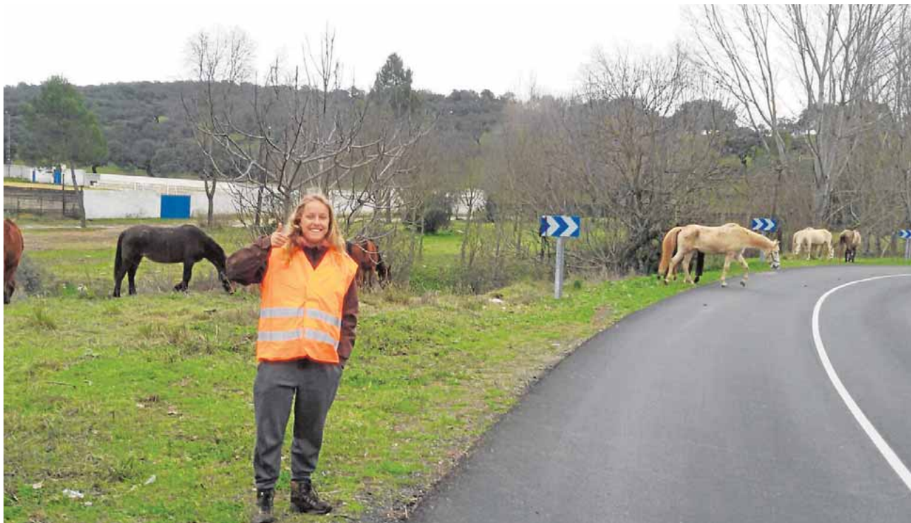
En el centro de «Los caballos Luna» brillan de nuevo los equinos abandonados o desnutridos de Andalucía

El Carmen. A este certamen podrán presentarse hasta el 13 de mayo alumnos y alumnas de Primaria, Secundaria, Bachillerato y Ciclos Formativos que estén matriculados en algún centro docente andaluz durante el curso 2015-2016.G.J.L.