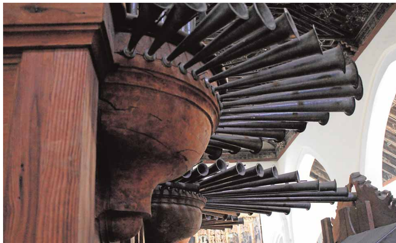
Detalle del órgano de 1765 en la parroquia de San Juan Bautista

No obstante, gracias al movimiento generado, «hacer cursos es algo innecesario». De alguna forma u otra, los órganos de San Juan siempre tendrán organistas que disfruten y hagan disfrutar con sus sonidos.