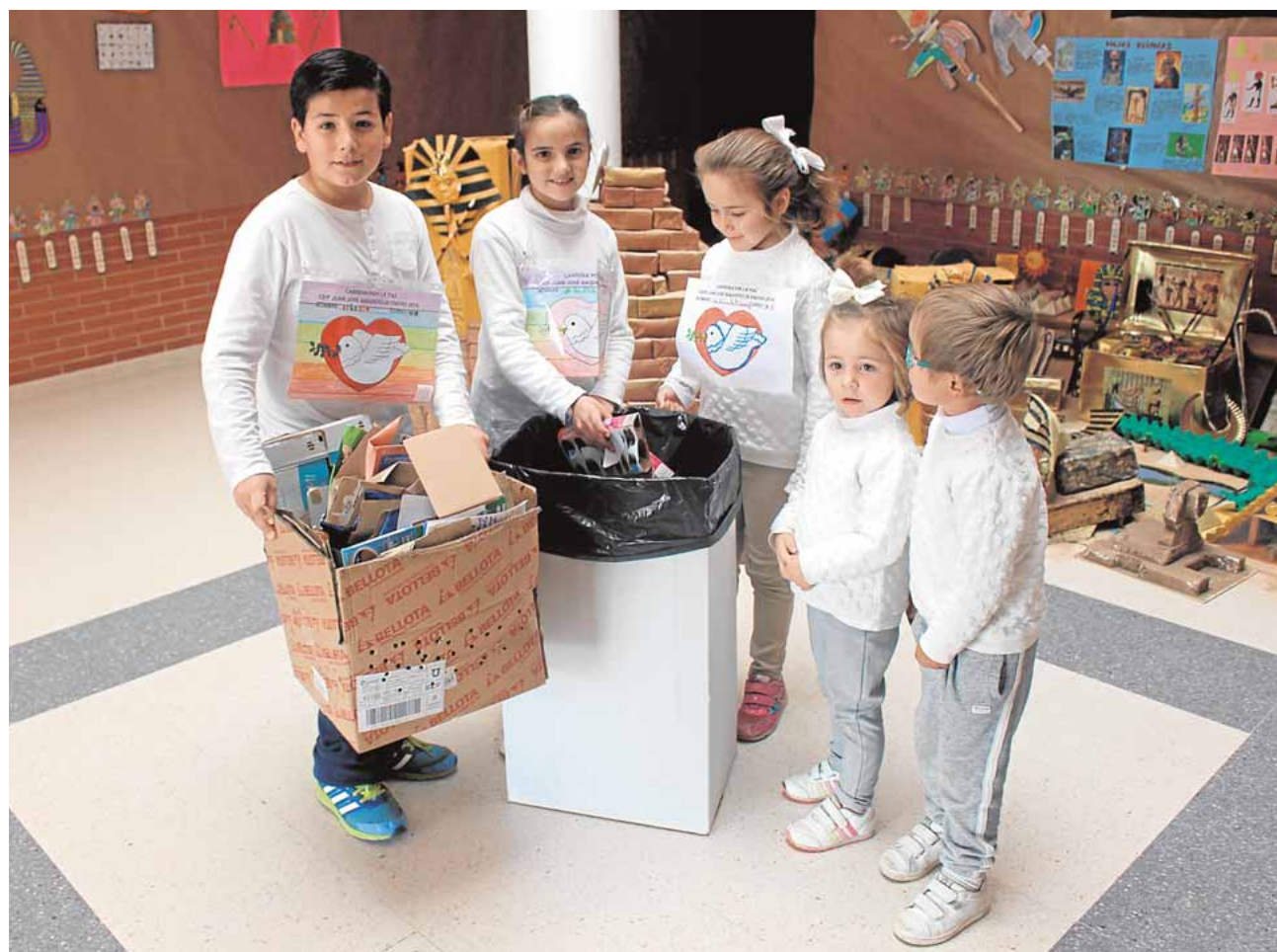
Niños de 3 a 12 años de Los Palacios reciclan residuos de distinto tipo en el colegio Juan José Baquero