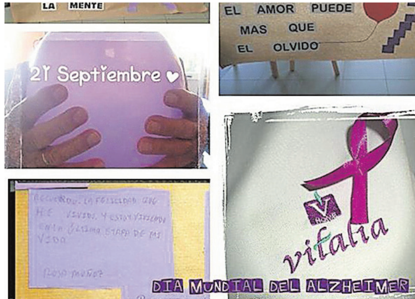
Día Mundial del Alzheimer en el centro de mayores Vitalia de Espiel

Continuamos realizando nuestra sesión de gerontogimnasia al aire libre, ayudándonos de globos morados que soltamos al finalizar, dejando volar un deseo común por todos a los que nos toca de cerca esta enfermedad: que sea posible un avance que permita que nuestros seres queridos permanezcan más tiempo con nosotros.