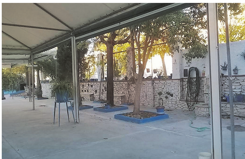
Instalaciones de El Sauce