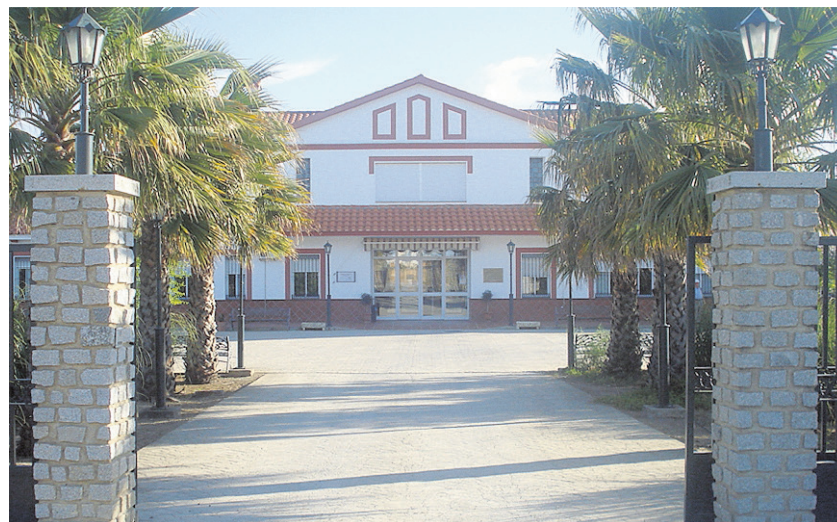
Una de las usuarias de la unidad haciendo uso de sus instalaciones

edificio totalmente adaptado a las necesidades de los mayores, cuenta con 41 plazas para residentes (válidos y de-