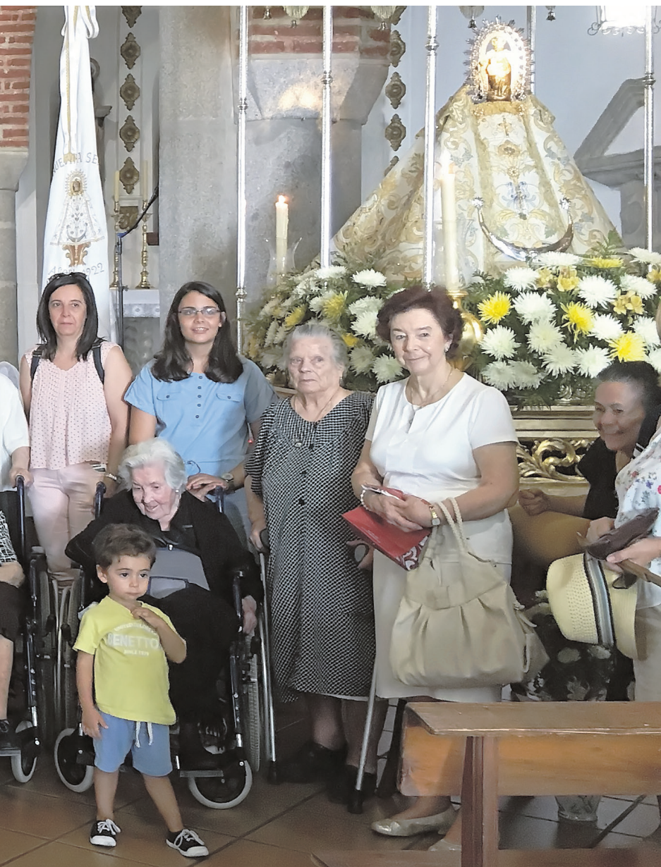
de este municipio cordobés