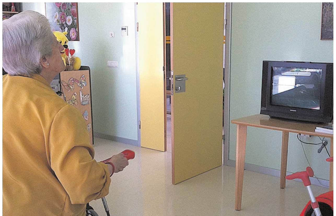
Una de las usuarias de la unidad haciendo uso de sus instalaciones

Con todas estas actividades, que se preparan teniendo en cuenta los intereses, las capacidades y las dificultades de cada persona, los profesionales del centro pretenden «mejorar o mantener la salud física, cognitiva, emocional y social» de sus residentes.