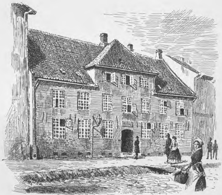
VALKENDORFS KOLLEGIUM CA. 1860, SET FRA ST. PETERSTRÆDE. Efter Tegning, udført 1889.

rives og opføres igen 3 Alen længere tilbage. Bygningen vilde derved blive bred nok til at rumme en Korridor paa langs gennem Bygningen, saa at alle Værelser kunde faa egen Indgang. Kvistetagen skulde erstattes af en ny fuldstændig Etage, hvorved der