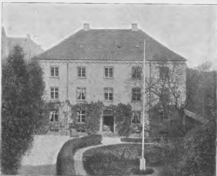
DET NY VALKENDORFS KOLLEGIUM, OPFØRT 1865—66.

buts til Alumnerne (denne havde i Aarene før 1865 varieret mellem 20 og 30 Rdlr. aarlig til hver Alumne), overtoges Distributsen indtil videre af Kommunitetet, idet den til Stipendier fastsatte Sum ved Finansloven 1866—67 forhøjedes med 1000 Rdlr. aarlig; og siden