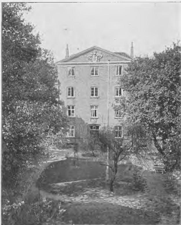
VALKENDORFS KOLLEGIUM EFTER OMBYGNINGEN 1913.