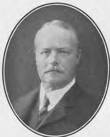
K. FABER, Efter Fotografi

Til at afhjælpe dette Savn gjordes det første Skridt ved et Kandidatgilde paa Kollegiet den 24. Febr. 1904, idet vedkommende Kandidater, ude af Stand til at imødesee en evig Skilsmisse indbyrdes og med deres kære Studenterbolig, vedtog for Fremtiden at mødes