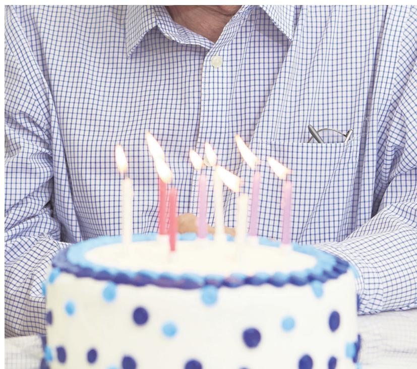
En este centro celebran los cumpleaños de sus residentes

la tarta y reciben regalos por parte del equipo que formamos esta empresa.