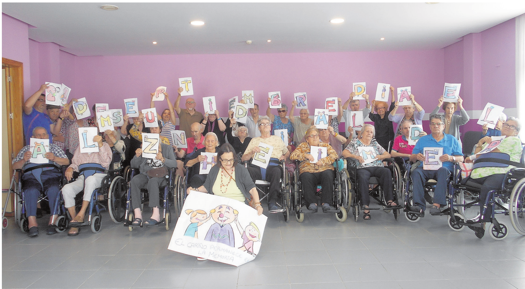
Los mayores del Centro Residencial Novo Sancti Petri haciendo un mural como parte de las actividades de este día