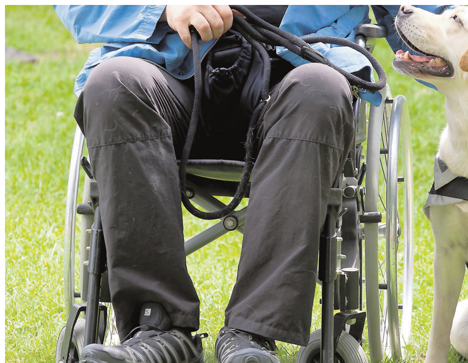
Se han realizado terapias caninas

Para dar a conocer nuevas formas de comunicación, se puso en marcha el proyecto «Hablemos», en