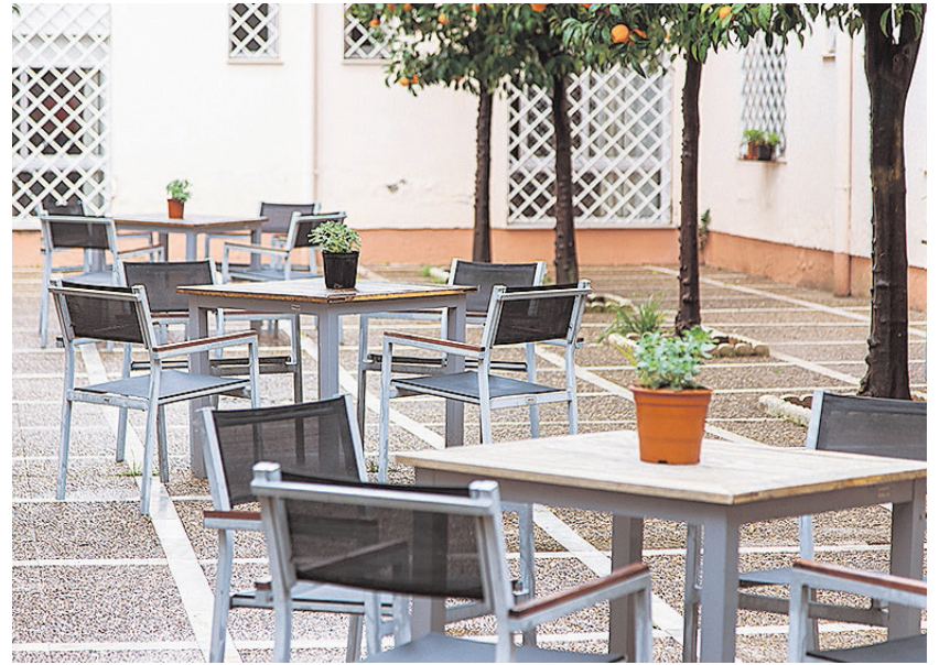
Uno de los espacios abiertos de SARquavitaes Monte Alto

Contamos con intervención psicológica para la atención de residentes tanto a nivel emocional (estados ansiosos, depresivos, duelo...) como conductual. También se interviene para facilitar