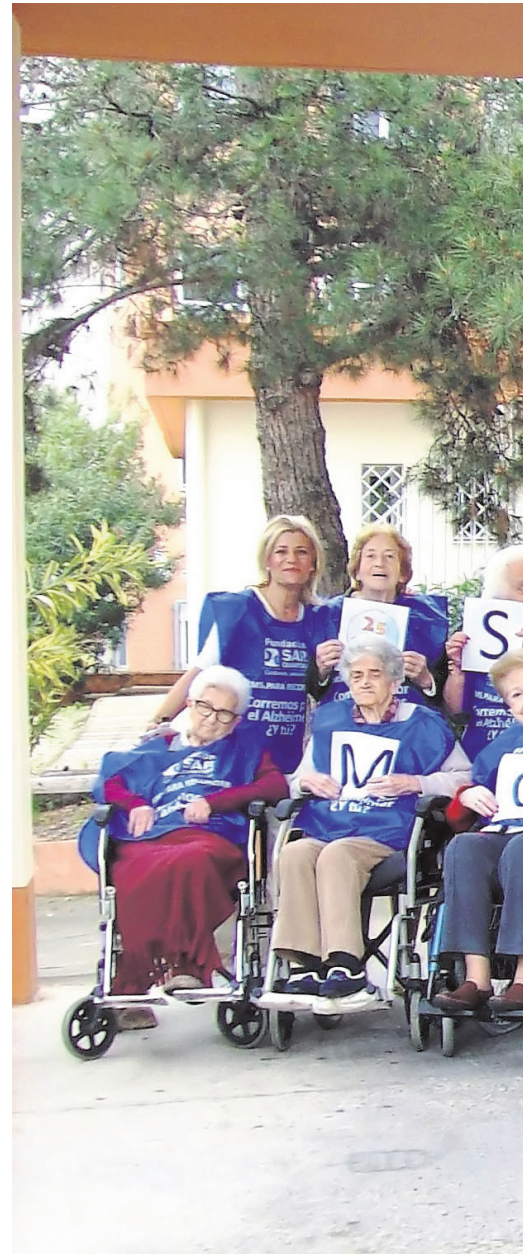
Residentes de SARquavitae Monte Alto

Mensualmente celebramos los cumpleaños de nuestros residentes, en los que les acompañamos mientras soplan las velas, saborean