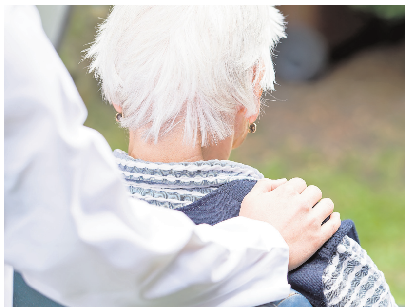
El 21 de septiembre es el Día Mundial del Alzheimer

Tuvimos la oportunidad de recibir una charla informativa por parte de la psicóloga del centro y después compartimos experiencias