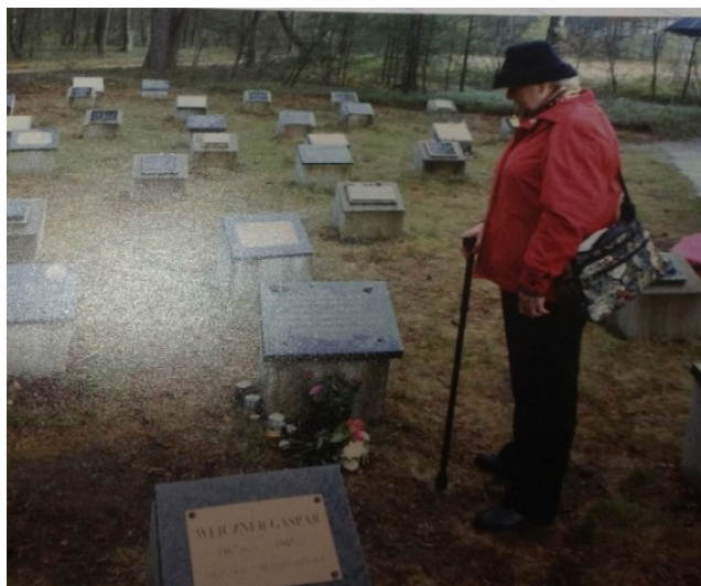
הקמת מצבה בברגן בלזן לזכר המשפחה שנספתה