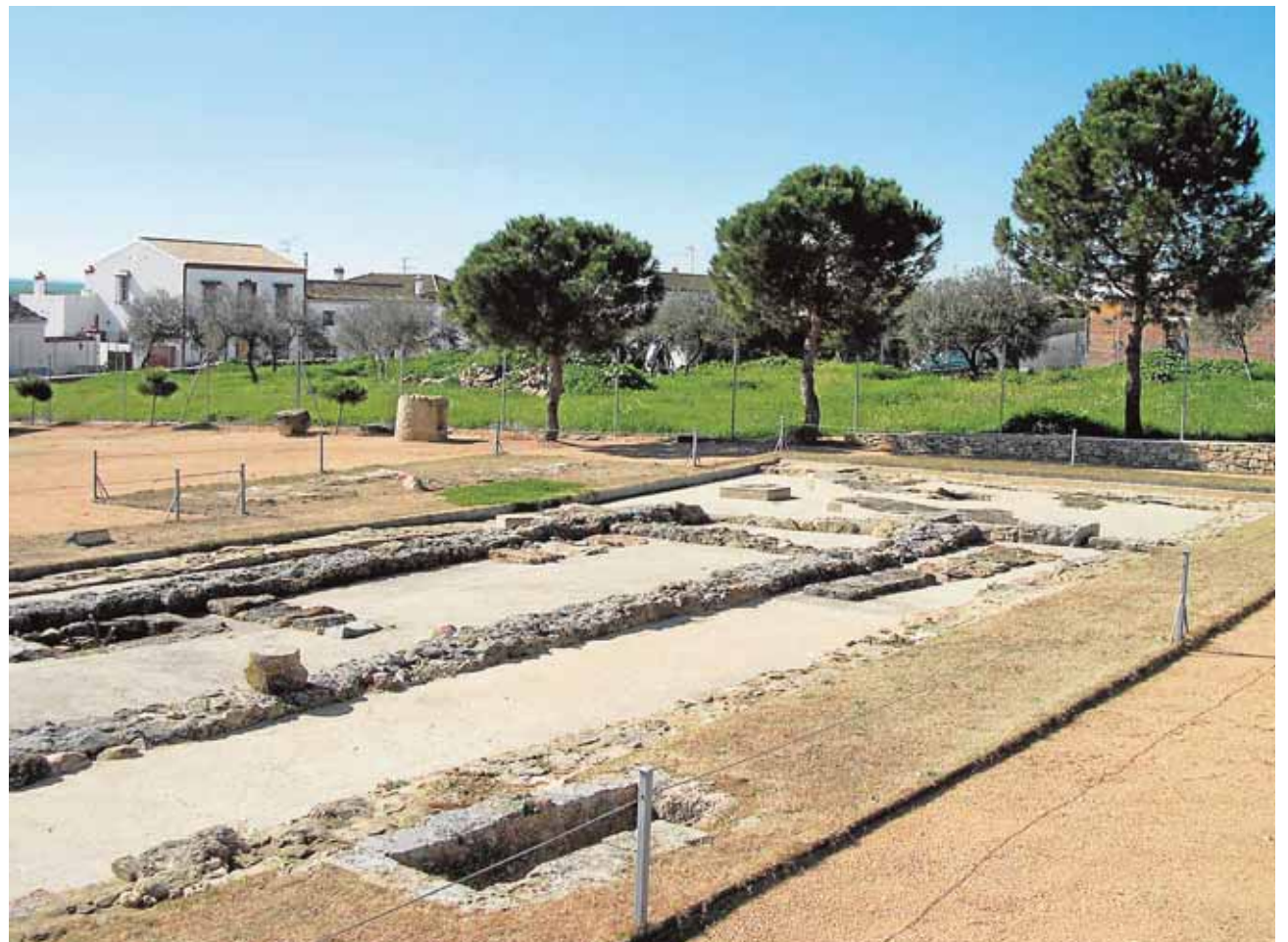
La basílica paleocristiana de Gerena, que aún recibe visitas, conserva la planta originaria y la pila bautismal

De la mano del turismo, el templo que vio rezar a los cristianos de Sevilla busca una nueva etapa de esplendor y ofrece la visita al conjunto en una ruta por la localidad concertada en el teléfono 955782002 o en el correo electrónico gerena@dipusevilla.es que siguen diversos grupos a través de los programas de fomento del turismo de la Diputación. El consistorio ha anunciado que durante la Ruta de la Tapa, del 7 al 9 de octubre, la basílica permanecerá abierta al encuentro con la historia.