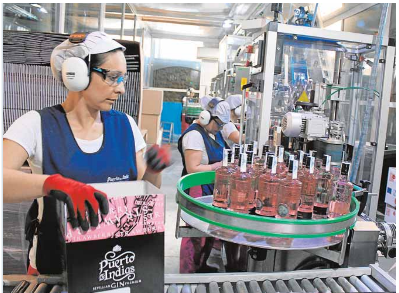
El 85 por ciento de la plantilla de Puerto de Indias está formado por mujeres