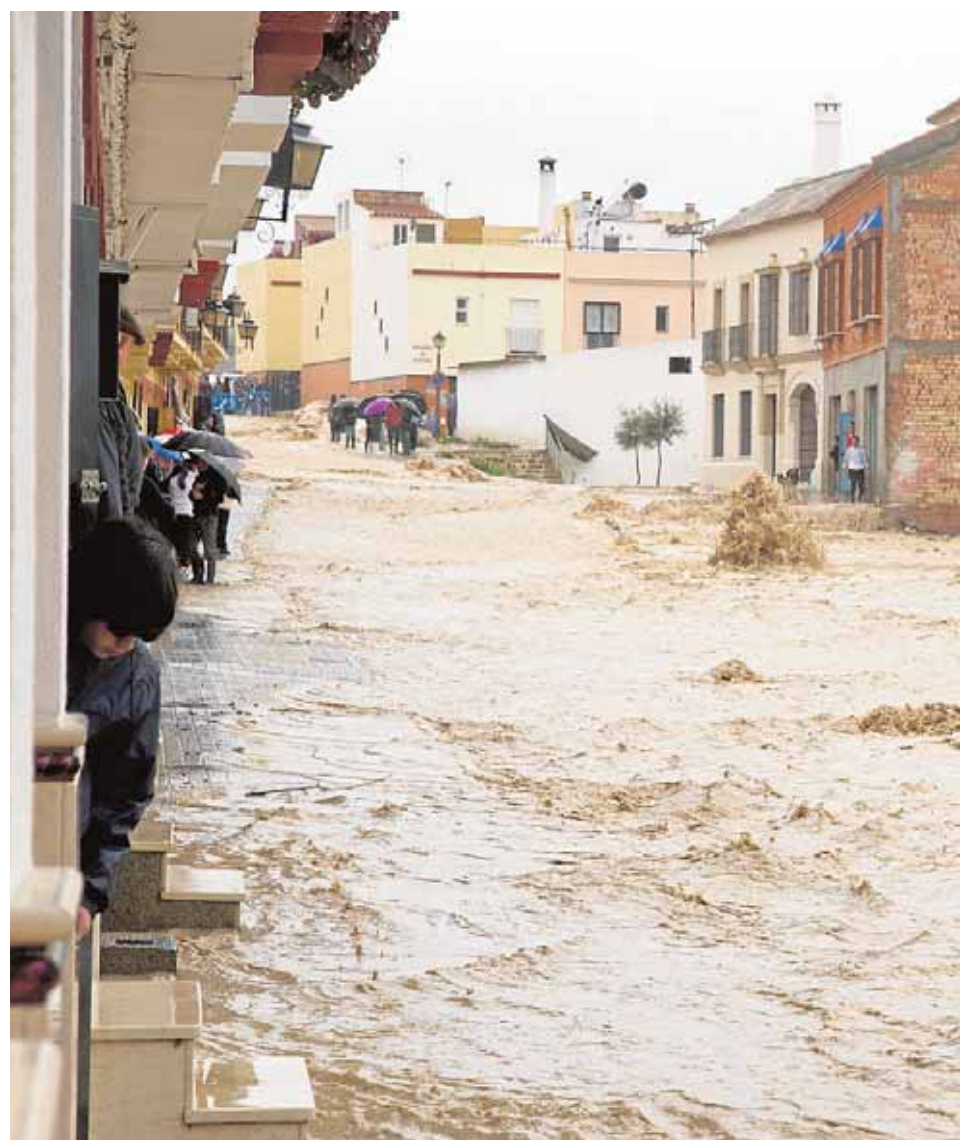
Durante las inundaciones de 2010, más de 800 viviendas de la ciudad fueron desalojadas.

Durante el proyecto se realizarán cuatro casos prácticos de zonas históricamente afectadas, uno por país participante, y ahí es donde entra el municipio de Écija, dada su situación, los