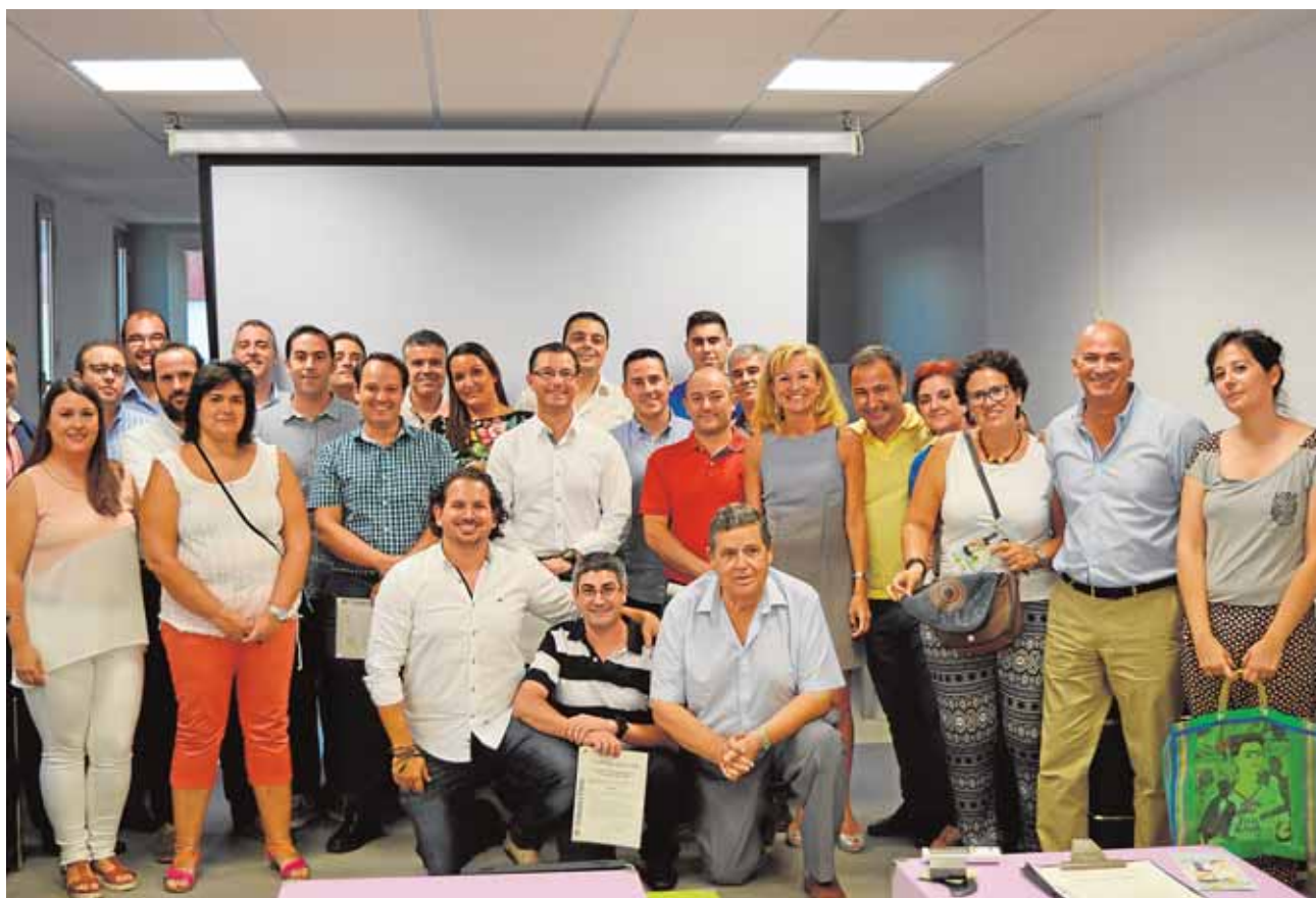
Los empresarios seleccionados recibieron las llaves de su nuevo espacio de trabajo