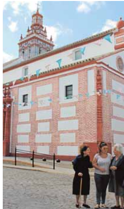
Iglesia de Santa María La Blanca A.L.

En total, de enero a junio el municipio recibió a 2.555 visitantes, que se calcula que aportaron 76.650 de euros en beneficios para el pueblo. De éstos, la mayor parte fueron locales, de la provincia y de Sevilla capital, seguidos de turistas de distintos rincones de Andalucía, nacionales y extranjeros. De forma contraria a lo habitual, la mayoría de los visitantes han acudido al municipio de forma individualizada (1.388) frente a los grupos (19 grupos).