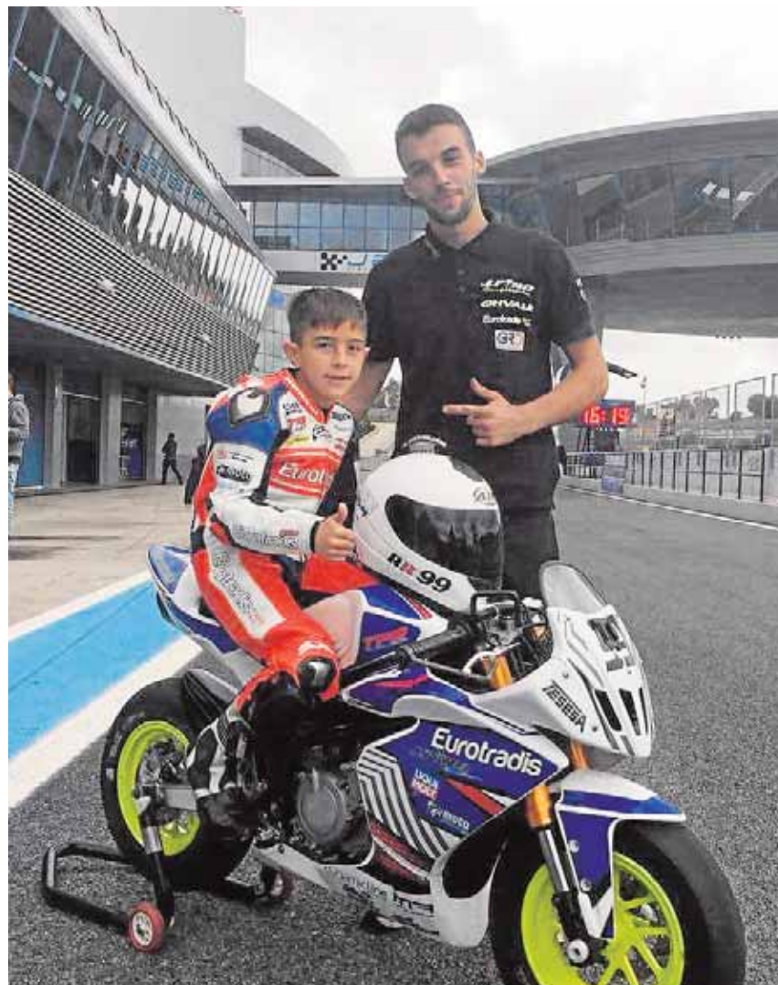
«RR», el campeón más joven de España

Pocos días después y sin despegarse de su nueva compañera ni un segundo, sus padres lo llevaron a un pequeño circuito que hay en Las Cabezas para que rodara su moto. Lo que en principio iba a ser una tarde feliz, pronto terminó en monumental enfado de «Erre», como lo conoce todo el mundo. Y es que al poco de estar en pista se incorporaron dos niños con motos de gasolina y más potentes que la suya, y al ver que le pasaban una y otra vez se bajó y dijo airado a sus padres: «Vámonos, yo no quiero esta moto, quiero una de gasolina».