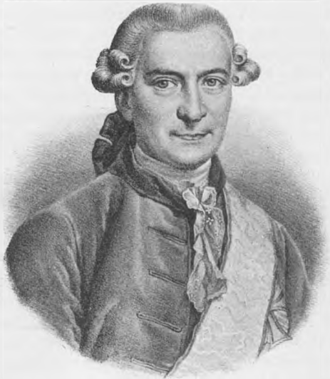
OWE HØEGH GULDBERG.

Kort efter stiftedes Enigheds-selskabet, det venskabelige og det danske Selskab, Tors-