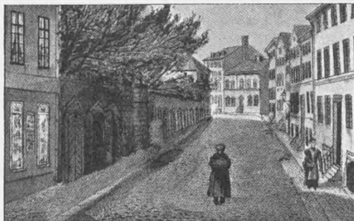
HELLIGEJSTSTRÆDE, TIL VENSTRE KLÆDEBODERNE.