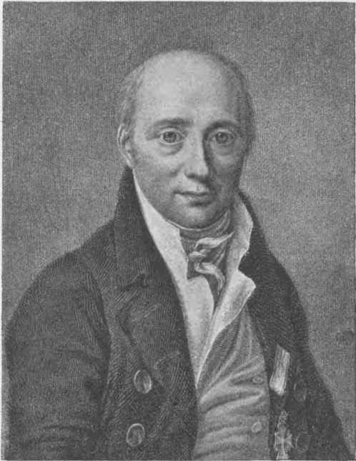
OLE HIERONYMUS MYNSTER.

hagsfølelse, som da han første Gang hørte Steffens i Klubben; han syntes, at Mynster maatte have Uret, naar han tordnede mod