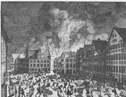
DEN GRUSOMME BRAND (AMAGERTORV).

Styrke, det gav at være sammen i saa alvorlige Øjeblik som Bondefrihedens og senere den grusomme Brands, sidst Københavns Belejrings. Han glæder sig over, at der ogsaa, som da Udvandringen skete i