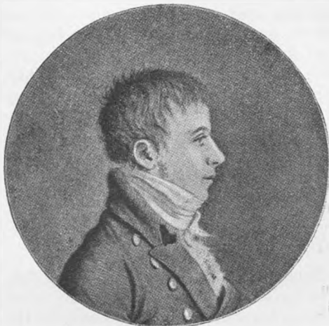
H. C. ØRSTED SOM UNG.

Der blev en Staahej. Oehlenschläger havde kaldt en af Klubbens Støtter en Dreng! Det var meget værre end alt det, Steffens havde sagt. Haarene rejste sig under Parykkerne, alle raabte i Munden paa hverandre, og dog var alle enige om, at det var en uhørt