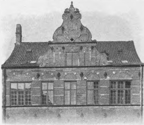
KLUBBENS VINDUER I EFTERSLÆGTENS GAARD, ØSTERGADE 54.

Som man nu i Paasken 1790 rykkede ind i Efterslægtsselskabets Forhus i anden Etage,