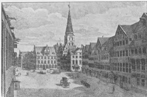
AMAGERTORV PAA KLUBBENS TID.