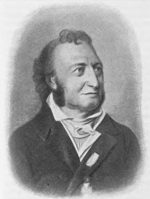
KNUD LYNE RAHBEK. Originalen tilhører Studenterforeningen.

Hvor mange af vor Tids Journalister vilde gaa saa uplettede ud af den historiske Doms Skærsild, som Rahbek gør?