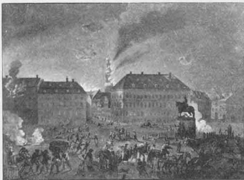
DEN RÆDSOMSTE NAT 1807 (KONGENS NYTORV).

Styrke, det gav at være sammen i saa alvorlige Øjeblik som Bondefrihedens og senere den grusomme Brands, sidst Københavns Belejrings. Han glæder sig over, at der ogsaa, som da Udvandringen skete i