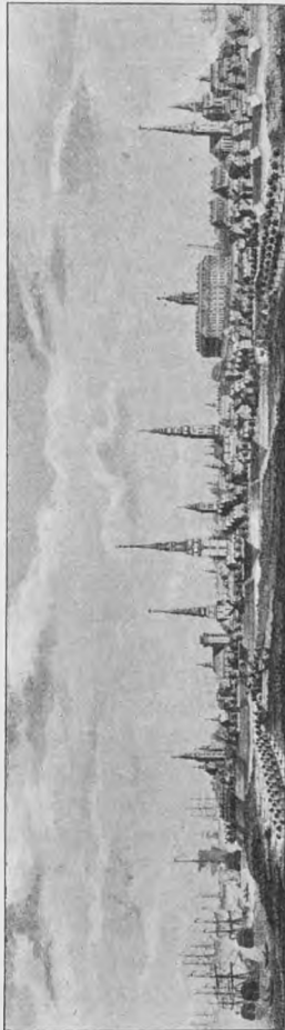
KØBENHAVN PAA KLUBBENS TID.