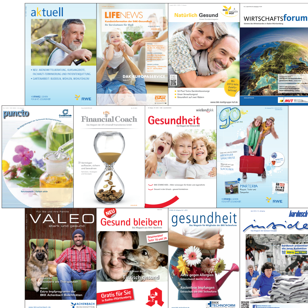
Eine Auswahl unserer Kundenmagazine.

Wir bieten ein maßgeschneidertes Leistungsspektrum für die Bedürfnisse unserer Kunden – von der Gestaltung bis zur kompletten Realisierung inklusive Erstellung von Content, Druck, Versand und Online-Version.