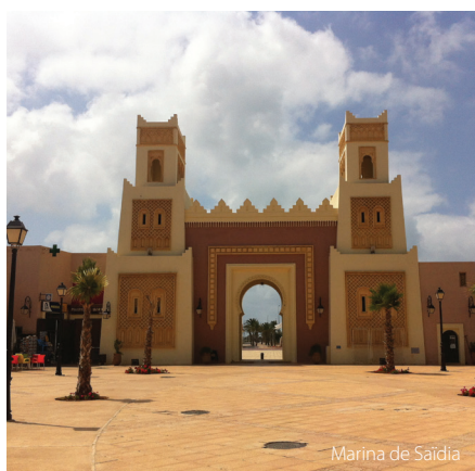
Marina de Saïdia