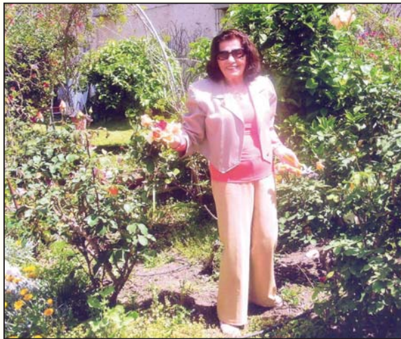
אני בגינה ובבית עם הפרחים שאני אוהבת