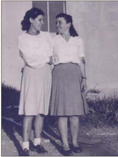
יכבד ואני בקיבוץ דן