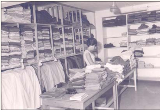
במחסן הבגדים של הילדים 1949/50

מילאתי תפקידים רבים במהלך השנים, להם נבחרתי בדרך דמוקרטית על פי שיחת הקיבוץ. הקדנציה הייתה לשלוש שנים אם אפשרות הארכה. העבודה הראשונה שלי הייתה בכרם הענבים של הקיבוץ והשנייה בבית התינוקות. מהר מאד נבחרתי למרכזת קומונה של בית הילדים, תפקיד אותו מילאתי כשבע שנים.