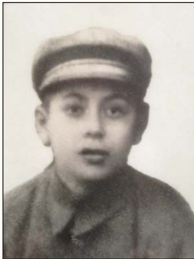
אחי בגיל 14