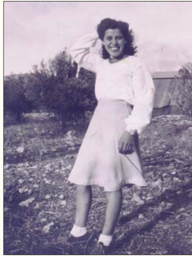
בקיבוץ דן, 1945