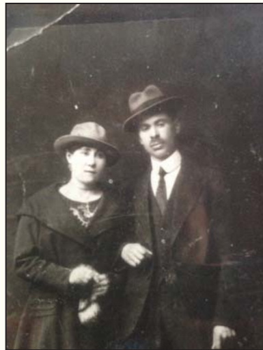
הורי (הצילום היחיד שנותר לי)