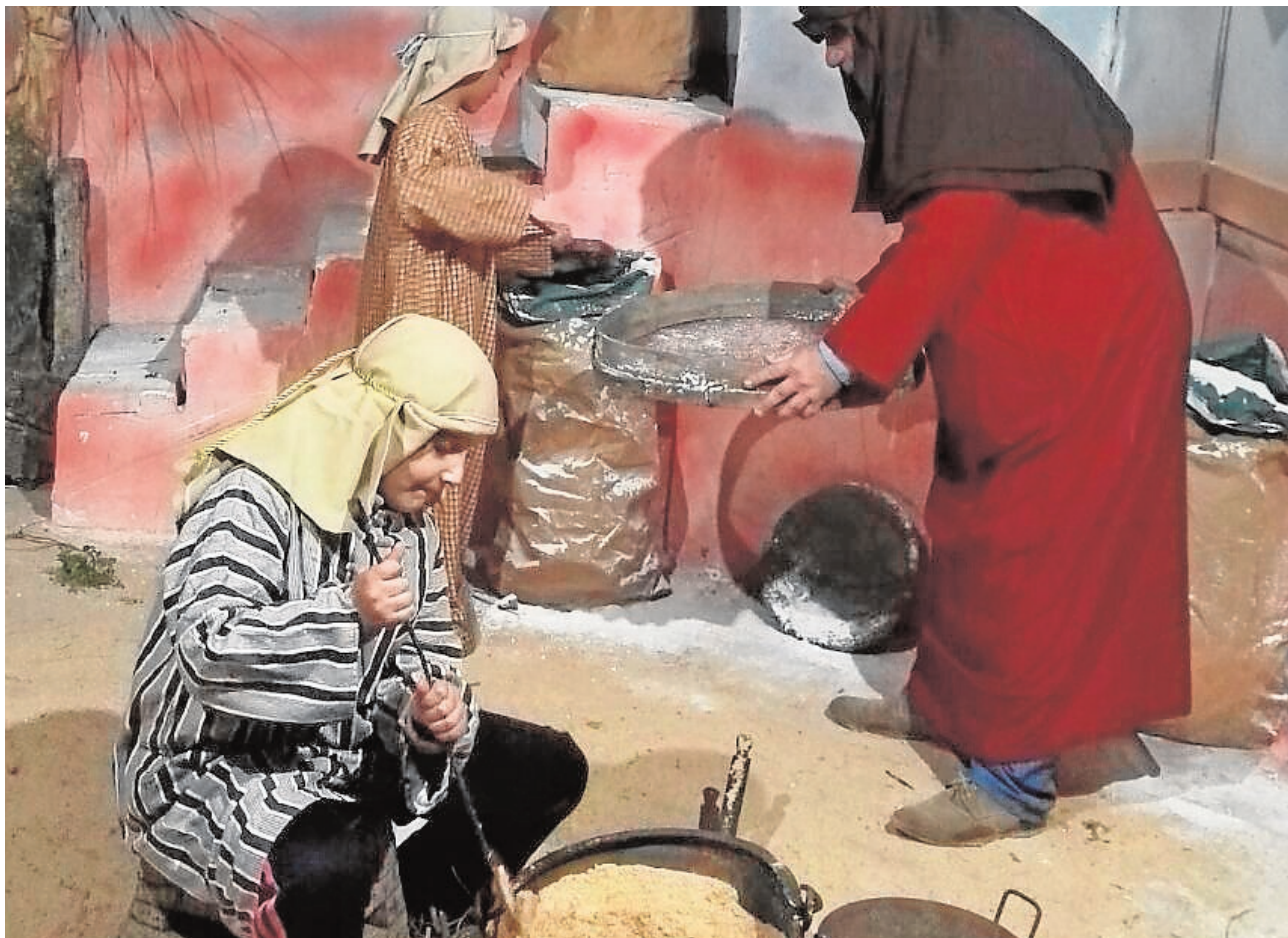
En el Belén Viviente de El Real de la Jara participan entre 30 y 40 personas

en el Cerro del Hierro». En esta actividad los participantes tendrán la oportunidad de excavar en un yacimiento paleontológico simulado, para interpretar lo que pudo ocurrir. Para participar es necesaria una inscripción previa. G.J.L.