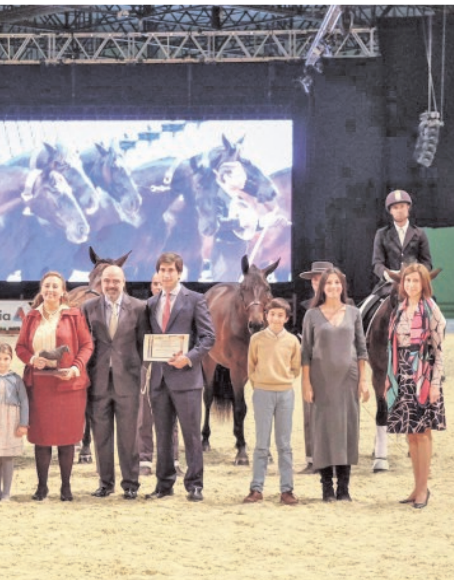
do su sello de belleza y excelencia