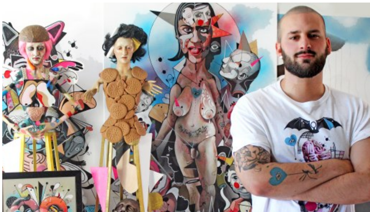
El tema central de Dalopo es el ser humano y su lucha para adaptarse al mundo que le rodea

La obra se representará mañana a las 18.30 horas en la Casa de la Cultura Miguel de Cervantes, donde padres y niños estepeños podrán participar en una función teatral que mezcla juegos, música, baile, disfraces y un objetivo educativo. B.M.