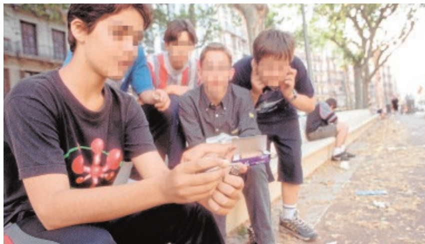
El lanzamiento pirotécnico estará sujeto a autorización previa policial J.C.R.

El acceso a una autorización para lanzar cohetes no se producirá de manera automática, requerirá de un informe de la jefatura de Policía Local tanto para eventos públicos o privados que vayan a festejarse. Una vez supervisado, los