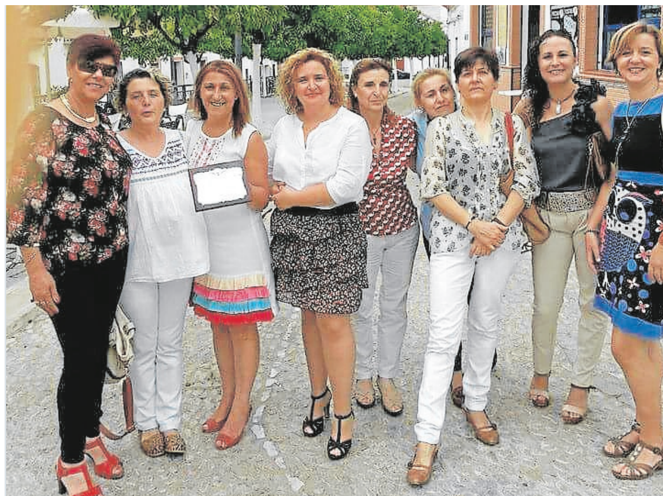
El humor y la improvisación suplen la falta de técnica del grupo de teatro aficionado La Costilla