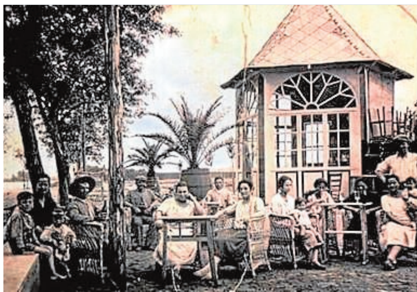
Comparativa del Kiosko Alfaro en los años 20 al actual en 2016

ficio de la cabalgata de reyes de la localidad. Esta competición solidaria en la que podrán participar un máximo de cinco equipos, contará con tres premios, un primer premio consistente en trofeo y equipación, y para el segundo y tercero, un trofeo.