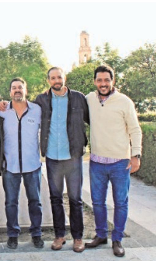
Monumento al Gallo de Morón