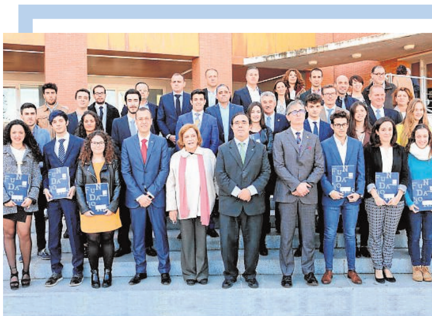
Los alumnos con mejor expediente con sus premios