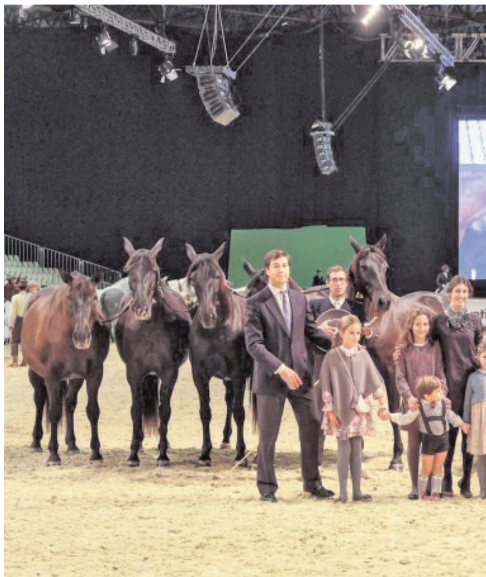
Durante siglos, los caballos de capa castaña de la ganadería Escalera han mantenido

Único semental de élite La ganadería presume con orgullo de «Ermitaño III», el primer y único reproductor de élite del mundo