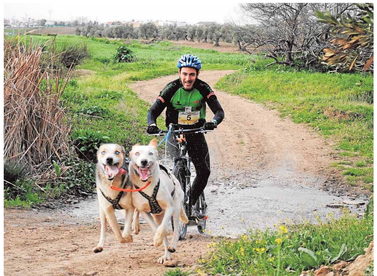
La modalidad de Bikejoring consiste en correr con una bicicleta tirada por uno o dos perros