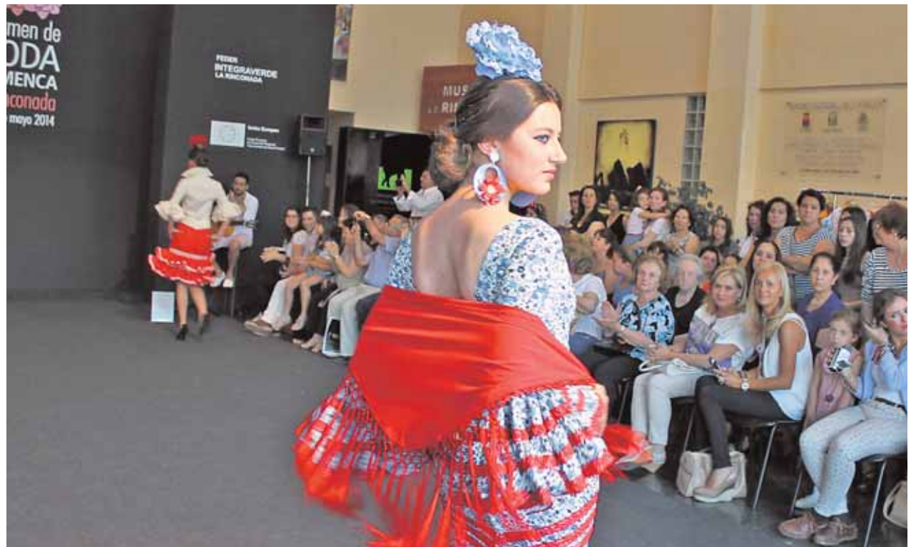
Desfile de moda flamenca de la pasada edición de esta iniciativa de apoyo al comercio local