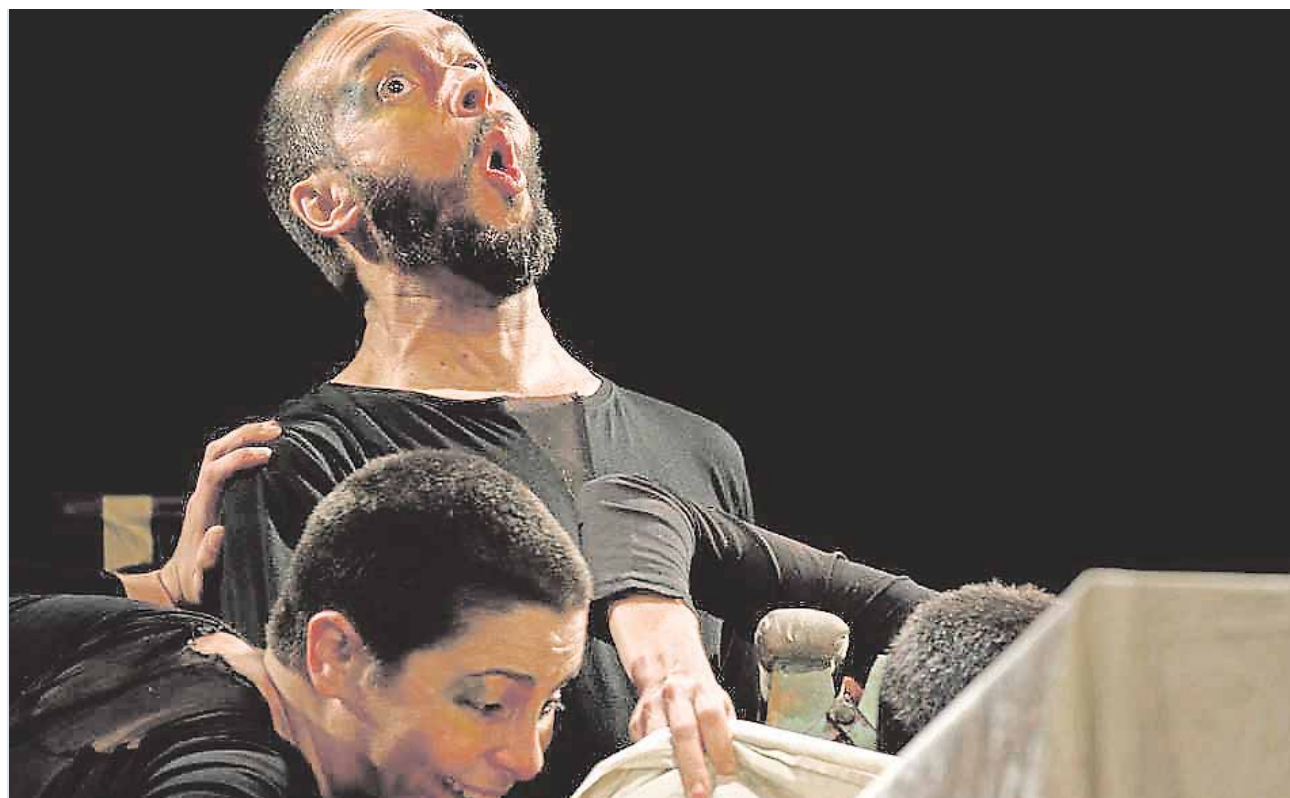
«Trasto Teatro» representando la obra «Los Satisfechos»