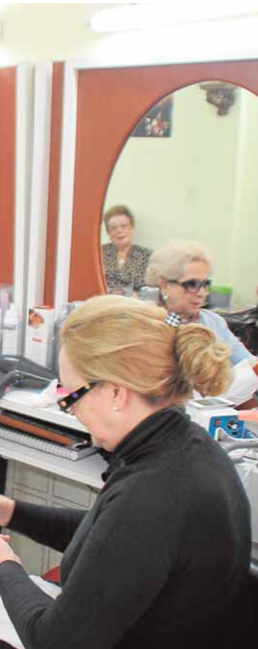
al de la calle Palacios Malaver

tes puedan aprender a crear sus propias cremas y aceites de masaje, a partir de productos naturales. El taller tendrá lugar a las 11.00 horas, con una duración de 1 hora y media y tendrá lugar en el Centro Cultural Casa de las Monjas.