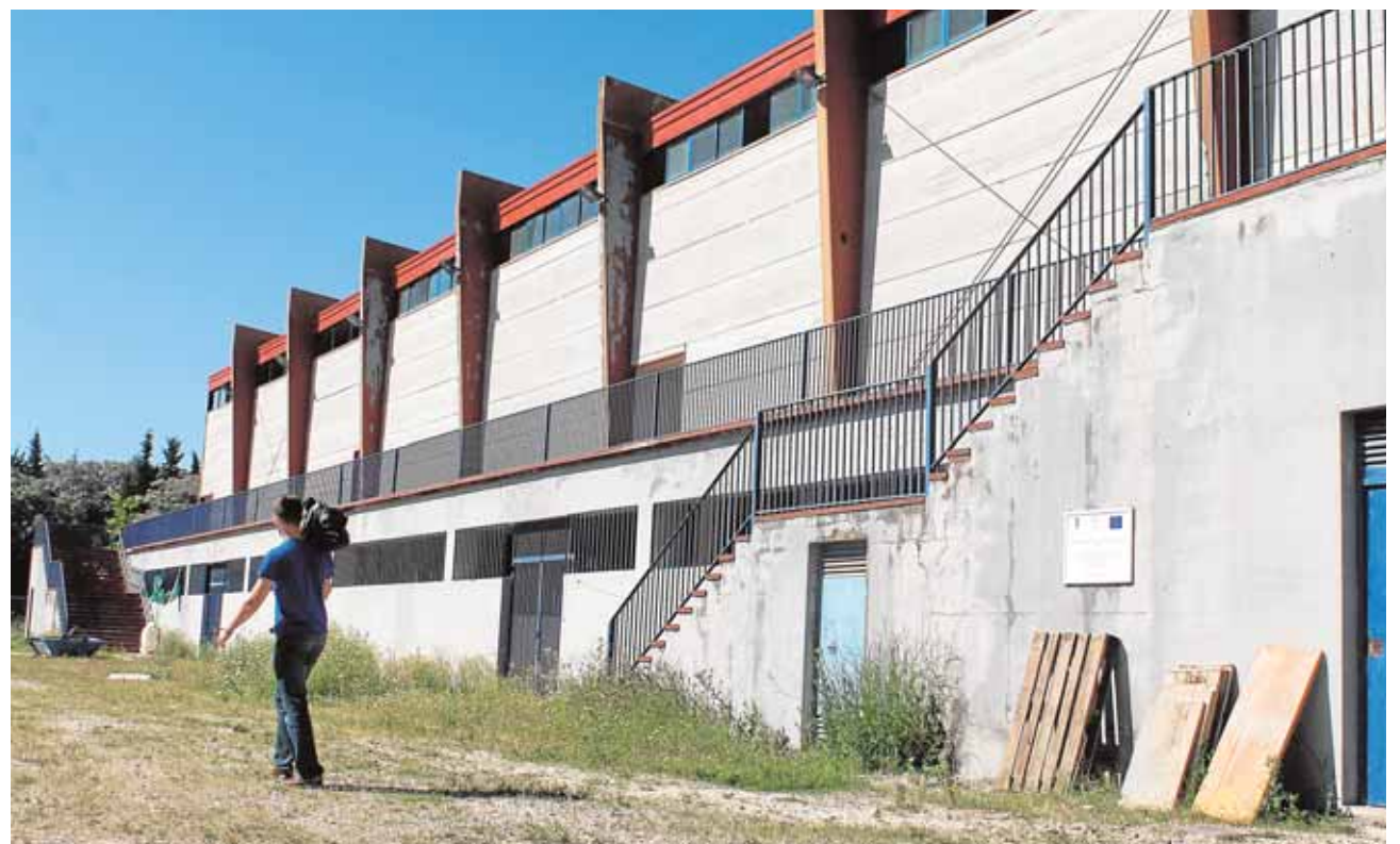
Imagen exterior del centro hípico, levantado en terrenos cedidos por el Ejército

Lo ideal, tal y como sugieren, sería contar con la financiación de una entidad pública que a su vez cediera la gestión a alguna empresa o fundación para que ésta desarrollara actividades de interés en el recinto, ya sean deportivas o de equinoterapia. En este sentido, señalan que la Fundación para el Desarrollo de las Terapias Ecuestres, entidad sin ánimo de lucro, mostró en el pasado su interés en la escuela, pero que, no obstante, no puede afrontar el costo del mantenimiento de las instalaciones.