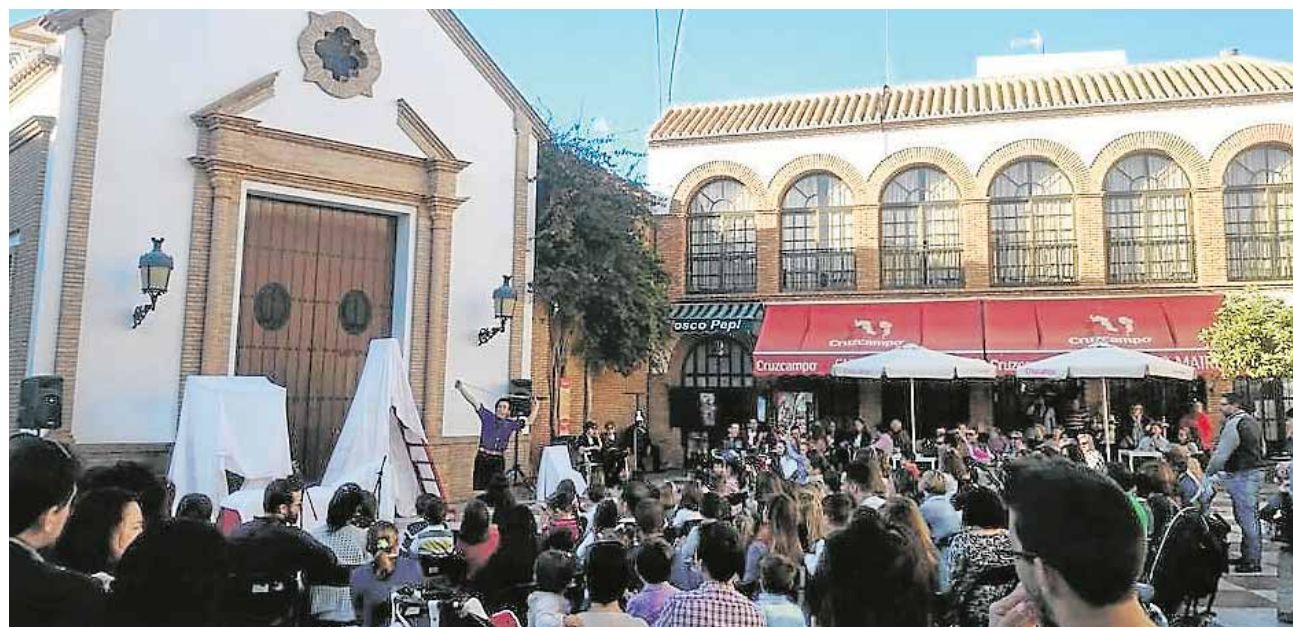
La pasada edición de la Semana Infantil de Teatro dejó un balance de más de 1.500 asistentes

Cultura teatral Mairena se ha consolidado como referente de las artes escénicas, afirma el Ayuntamiento