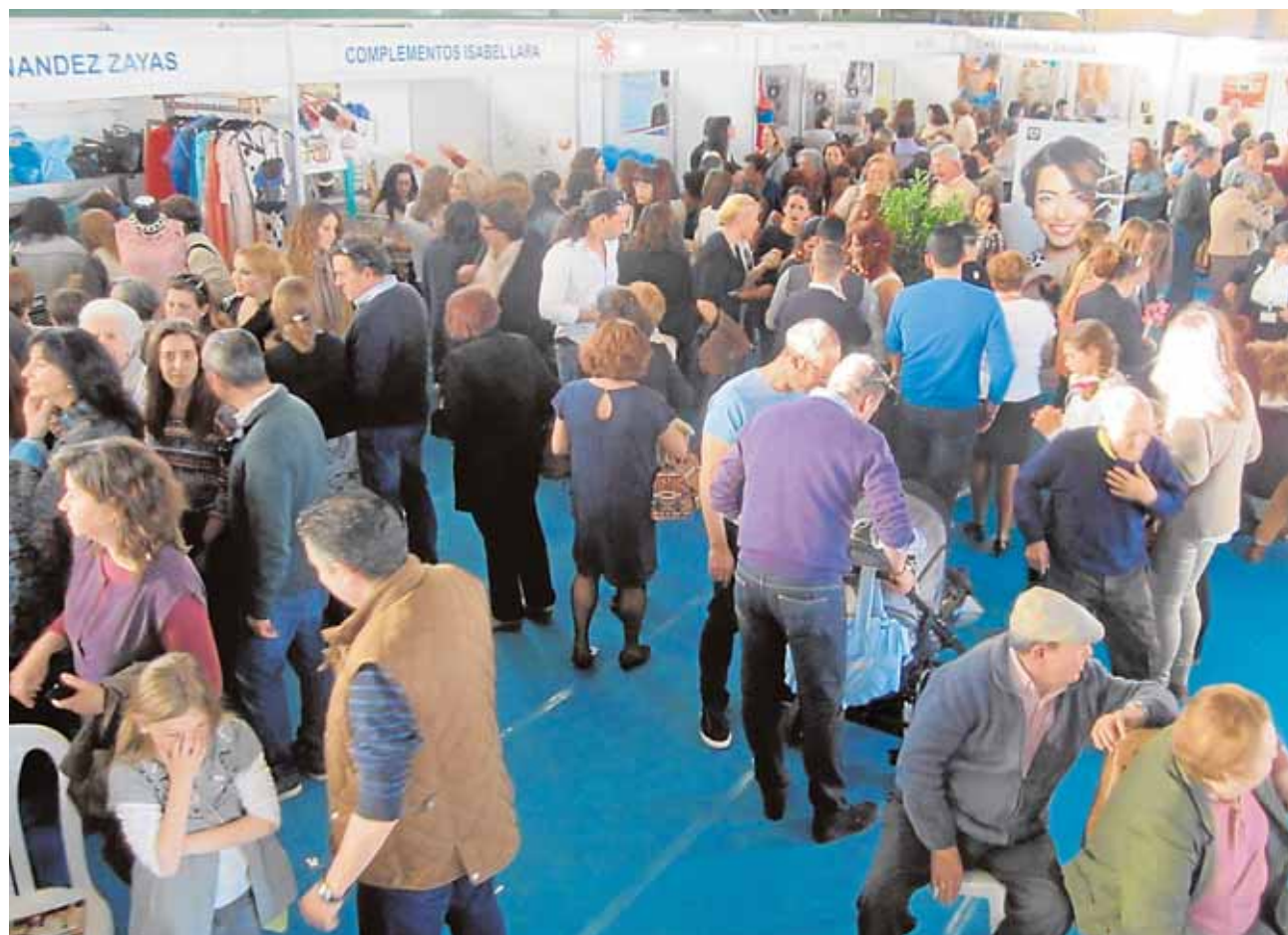
Empresas de diversos sectores impulsadas por mujeres presentarán sus servicios y productos en EME

que dicha empresa cerrara las instalaciones, una decisión que tomó de forma unilateral y comunicándolo con un cartel en la puerta de la instalaciones. La administración local ha interpuesto además una reclamación en concepto de daños y perjuicios.