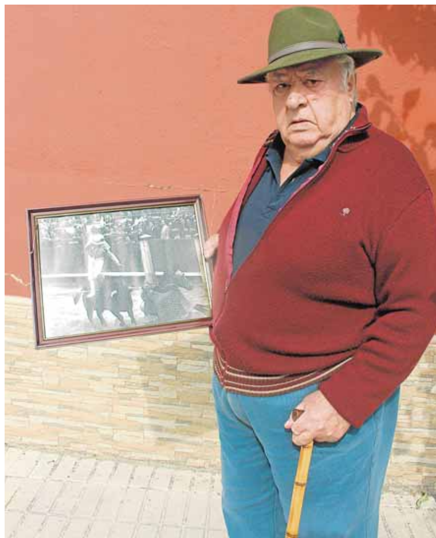
«Salitas» es el subalterno español que más ha toreado en América