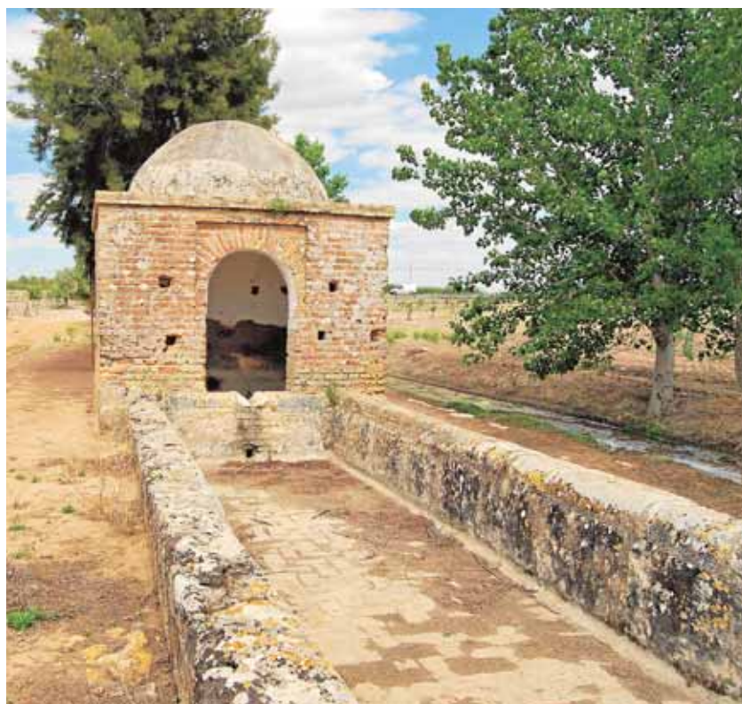
La Fuente Vieja del Campo es una construcción del siglo XIV

Hoy es posible ver las chimeneas que sirven para ventilar el sistema e incluso la obra seguiría funcionando perfectamente si no fuera porque hace unos años se produjo accidentalmente la rotura de una tubería.