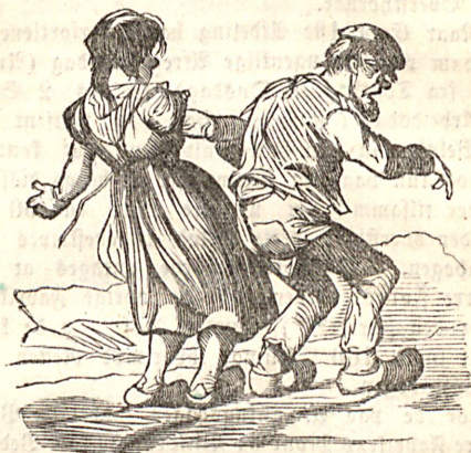
Kjærestefolkenes Hjemkomst Søndag Aften.

Hele Udbyttet af Overtarbejde er for Tiden kun ringe, det skal omtrent beløbe sig til 1000 Rd. aarlig.