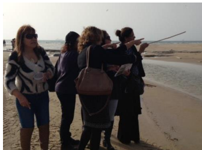
סיור גננות לשפך נחל לכיש