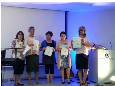
הענקת תעודות לגננות ביום שיא