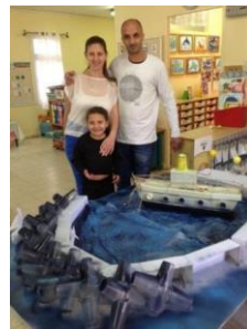
פעילות ילדים והורים