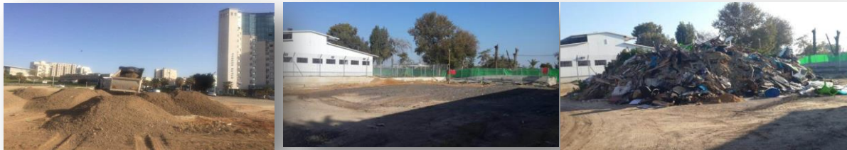
ניפוי וגריסת הפסולת אפשרה שימוש חוזר