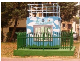
התמונות מתוך אתר האינטרנט של המשרד להג"ס

● תחנות ניטור באשדוד 4 תחנות לניטור זיהום אוויר של מזהמי הבסיס שמקורם בתעשייה ובתחבורה. תחנה נוספת תקום בחודשים הקרובים. בעיר גם תחנה למדידת מזהמים אורגניים נדיפים שמקורם בתעשייה ובתחבורה. בכל התחנות ובכל הפרמטרים נמדדים ריכוזים שרחוקים מהתקנים ומהערכים לאיכות אוויר שקבע המשרד להגנת הסביבה. את נתוני תחנות הניטור ניתן לראות באופן רציף באתר האינטרנט של האיגוד שכתובתו http://www.env.org.il . את נתוני הדיגום למזהמים האורגניים הנדיפים ניתן לראות בדוחות השנתיים שהאיגוד מפרסם מידי שנה.