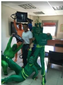
בתיק בד השתמשי, עשרות שקיות פלסטיק חסכתי!

תמונות מחלוקת תיקי בד לעובדי העירייה בשיתוף בני נוער במסגרת מעורבות חברתית באמצעות תאטרון "ברמוזה" ואיגוד ערים. את הסלוגן לתיק קיבלנו מנער בן 13.