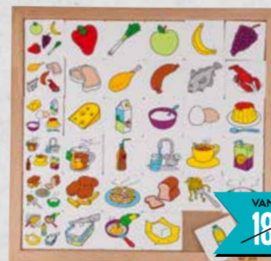
DIAGRAM VOEDING Kinderen plaatsen verschillende soorten eten en drinken in de juiste categorie. Zo leren ze spelenderwijs tot welke categorie het eten en drinken behoort. 2599547