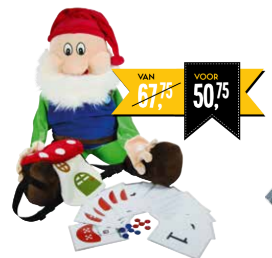
KABOUTER MET RUGZAK 2597154