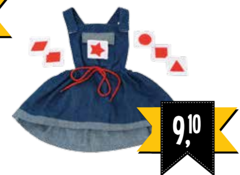
JEANS JURK MET 6 VORMEN 2597166