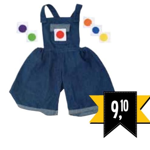
JEANS BROEK MET 6 KLEUREN 2597165