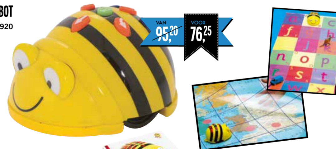
KLASSENSET 6 Bee-Bots inclusief dockingstation 1690929