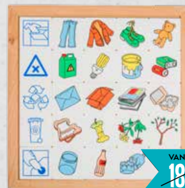
DIAGRAM MILIEU Kinderen sorteren verschillende soorten afval in de juiste categorie. Op de achterkant van de kaarten met afbeeldingen is het recycle logo te zien. 2599546