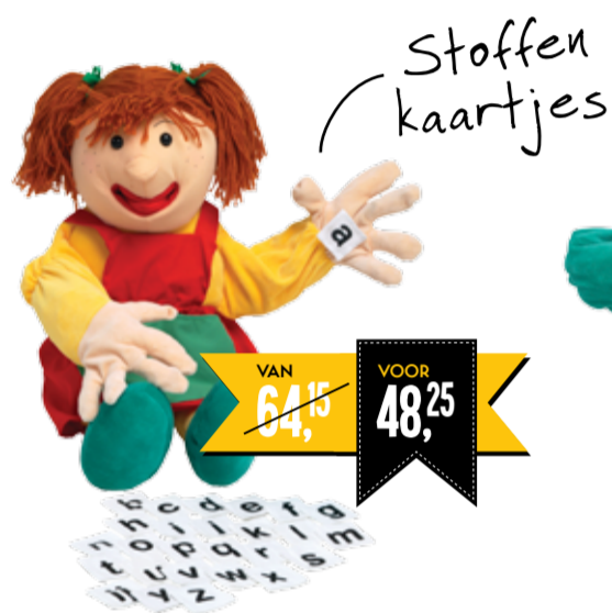
SAMANTHA MET ALFABET 2597161