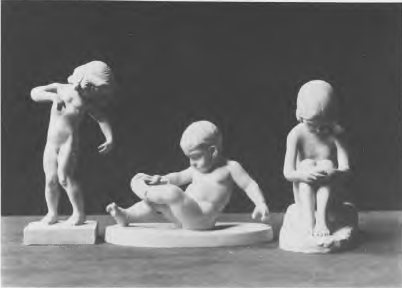
Børnestatuetter. Kai Niensens Venus Kallipygos til venstre fandtes i mange hjem.

Et nyt teknisk fremskridt opnåede man i 1920–22 ved fremstillingen af den såkaldte jadeglasur, der fik stor betydning for billedhuggeren Georg Thylstrups (1884–1930) arbejder for fabrikken. I årene 1924–30 udførte han en række stiliserede, folkelige eller næsten overdrevent groteske figurer i denne glasur, der blev meget populære både herhjemme og i udlandet. Flere museer i U.S.A., Kunstindustrimuseet i København og Kunstmuseet i Helsingfors erhvervede eksemplarer af disse. Specielt hans store, barokke havfrue vakte opmærksomhed, originalen blev erhvervet af Nationalmuseet i Stockholm, og et kunstner-eksemplar af Carnegie-Instituttet i Pittsburgh. Men også andre har arbejdet med jadeglasuren, først og fremmest må Kai Nielsen (1882–1924) nævnes for sin berømte figur Venus Kallipygos, den lille nøgne pige der med en yndefuld bevægelse ser sig bagud, så håret falder ned over ørerne. Både i den grønne jadeglasur og i lys terrakotta opnåede den en popularitet, der kunne måle sig med Thorvaldsens figurer i gamle dage. Den produceres iøvrigt stadigvæk af både Søholm og Kähler – Søholms udgave har endda Ipsens stempel i bunden!