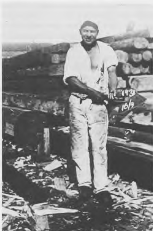
I 1930'erne blev brugen af bredbilen til tilhugning af tømmer stadig sjældnere. Københavns Tømmerlaug.

ling mellem murere, tømrere, snedkere, blikkenslagere og hvilke andre fag, der nu var inddraget i byggeprocessen, var skarp og blev nøje overholdt. I en vis forstand stillede de faglige traditioner sig i vejen for anvendelsen af ny teknologi. En omstændighed, der havde både negative og positive sider. Det positive bestod deri, at byggeriet derved undgik en alt for hovedkuls indførelse af ny teknologi. Det negative kom til udtryk derved, at fagene måske holdt for hårdnakket fast ved traditionerne, således at den ny teknologi blev indført af andre, hvorved teknologiens tilpasning til den håndværksmæssige tradition og omvendt blev besværliggjort. Det fond af viden og ekspertise, som håndværksfagene stod med, blev således udnyttet i en alt for ringe grad.