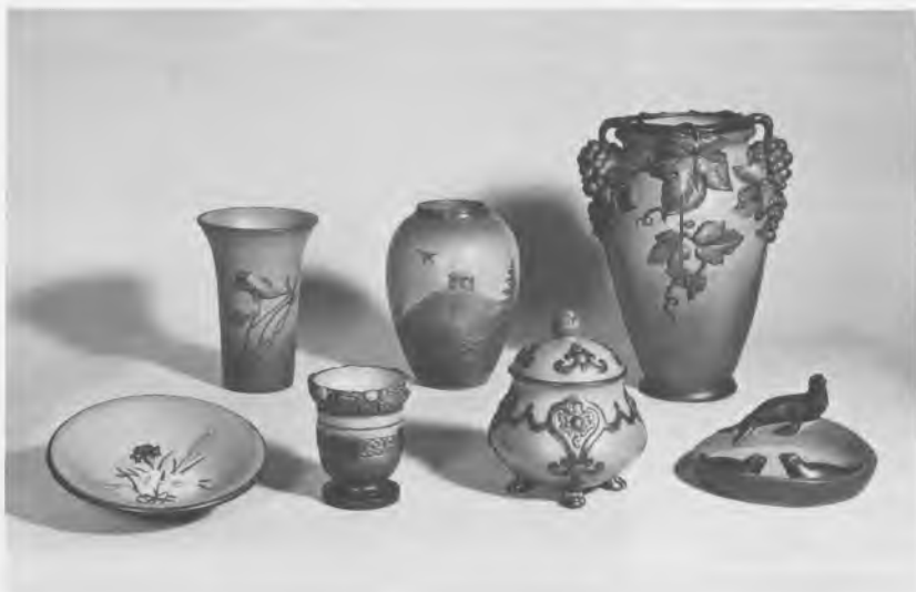
Vaser, askebægre og bonbonniere i matglasur – typiske bryllupsgaver i 1920'erne.