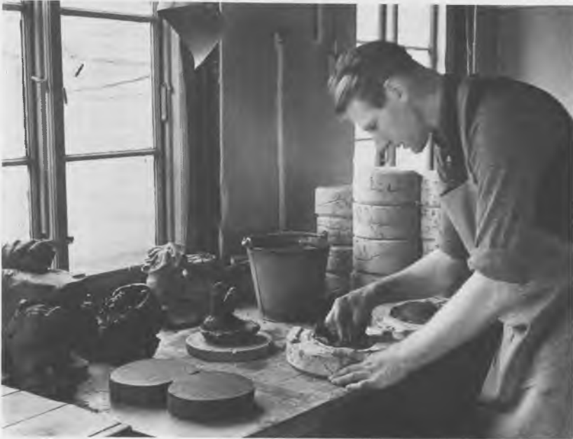
Leret presses ned i formene. Fotografi taget ved fabrikkens 100 års jubilæum i 1943.

(med det beskedne årlige honorar af 200 rigsdaler), indtil han i 1872 oprettede en fabrik for kallipasta-arbejder.