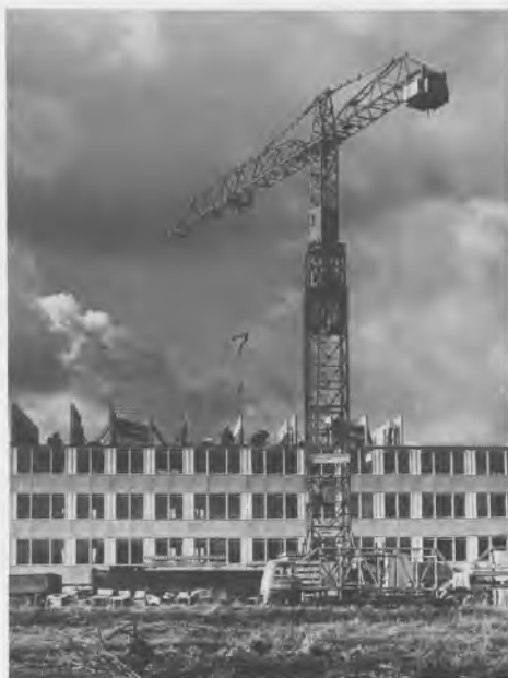
Montagebyggeri med kran.

ligeledes i 1970. Men tømmerlavet sagde nej til sammenslutningen. I sidste fase af forhandlingerne mente lavet at have fået vished for, hvad man hele tiden havde frygtet, at lavet ville få status som en lokalforening under Centralforeningen.