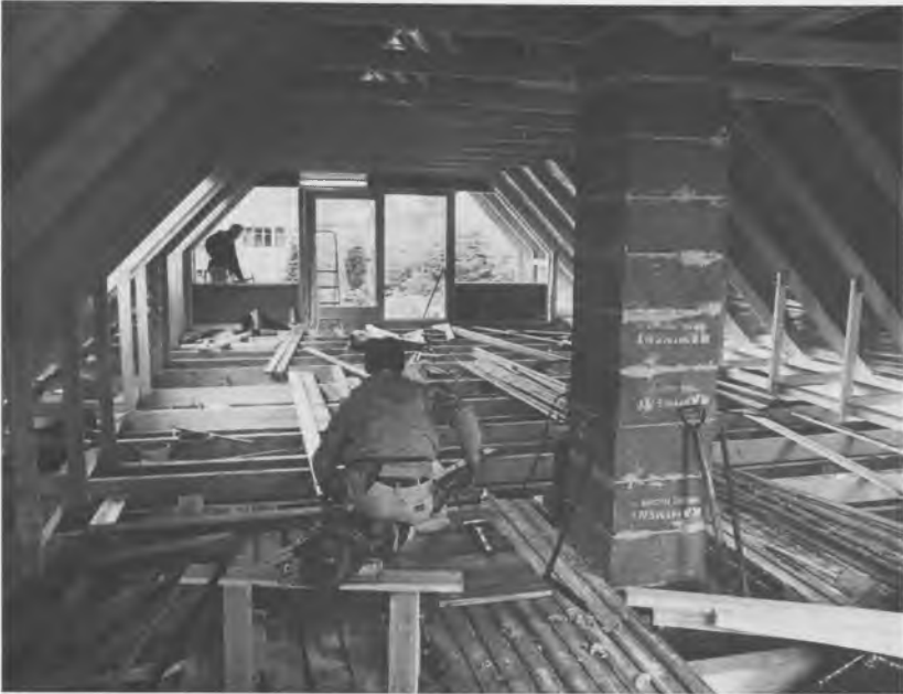
Præfabrikerede spær samlede med beslag.

sesprogrammer. I byggesektoren blev boligministeriet sat til at administrere de såkaldte counterpartmidler til produktivitetsforøgende foranstaltninger på byggeområdet. I 1953–54 uddannedes således 16 konsulenter i byggerationalisering, ligesom der blev arrangeret studierejser til USA. Counterpartmidler indgik også ved oprettelse af Byggeriets Maskinstationer (BMS), hvis formål var udlejning af materiel, der var for kostbart at anskaffe for den enkelte. Endelig blev Byggecentrum reorganiseret i 1956 ved hjælp af disse midler med henblik på at formidle viden om rationalisering af byggeproduktionen.