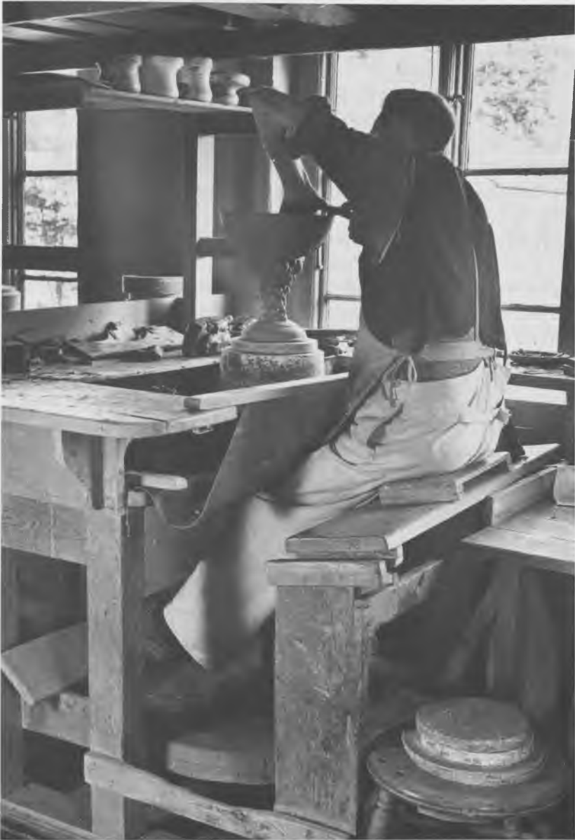
En vase, der er presset i formen, drejes ren indvendig. Fotografi fra 1943.