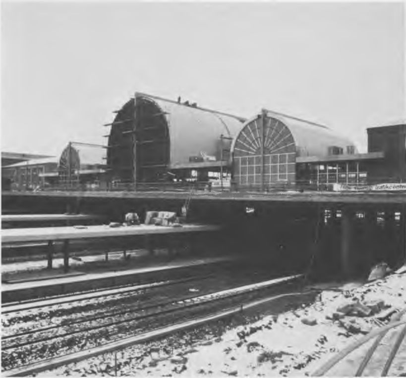
Hvælvingerne på Høje Taastrups nye banegård er bærende stalkonstruktioner beklædt med rustfrit stal.

for så vidt heller ikke. Modsat byggebranchen fremstod anlægsbranchen som en moderne kapitalistisk branche, der kunne påtage sig udførelsen af arbejder i en ikke tidligere set målestok. De store entreprenørvirksomheder begyndte for alvor at gøre sig gældende i byggesektoren.