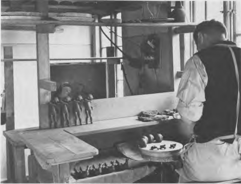
Figurnes enkelte dele samles med lervælling inden brændingen. Der går mange dele til en hel figur. Fotografi fra 1943.

noget nær en helligdom. Der kunne høre adskillige forme til samme model, for de mere komplicerede figurers vedkommende helt op til et par og tyve, og når de ikke var i brug, blev de opbevaret på det store formloft i øverste etage af bygningen.