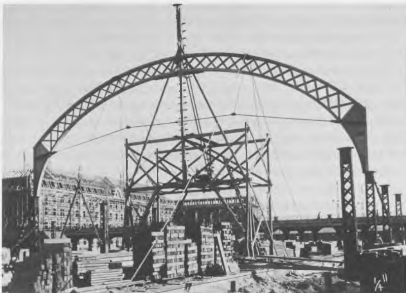
Fra opførelsen af Københavns hovedbanegård 1911. Perronhallernes gitterspær af træ var i forvejen samlede og blev hejset på plads ved hjælp af en tømmerkonstruktion. Unmacks album, Københavns Tømmerlaug.