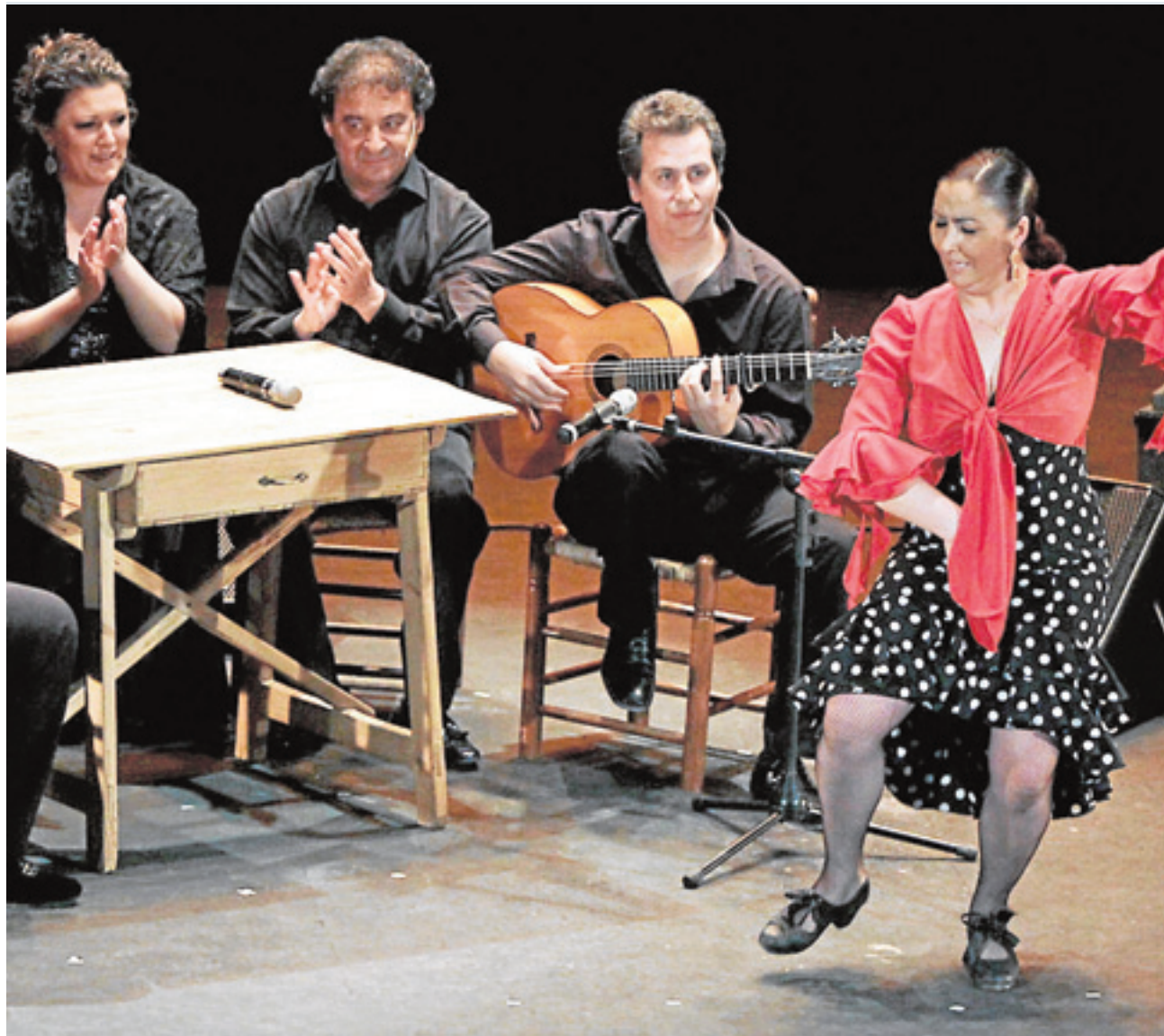
Jerez, también en vacaciones, sigue siendo el epicentro del arte flamenco. :: LA VOZ

Si empezamos por San Fernando hay que detenerse en la figura de Cama-