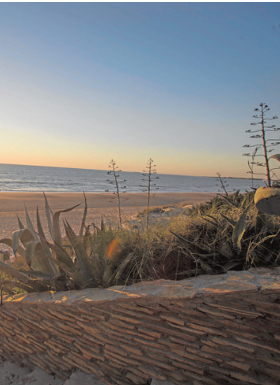
se zambulle en el mar cuando el día muere.

En el mar o en la montaña, desde la ciudad o desde el pueblo. Cádiz tiene eso que da opciones para elegir. Pero lo mejor de todo es que no hay que quedarse con una, que cada día se puede disfrutar de un atardecer diferente y conocer los curiosos rincones que esconde una provincia que si sabe de algo es de sol. De hecho es conocida como la Costa de la Luz, por ser uno de los lugares con más horas de Sol. Por ello pocos lugares muestran un atardecer como el de Cádiz, en el que el astro rey se recrea antes de dejar paso a la noche.