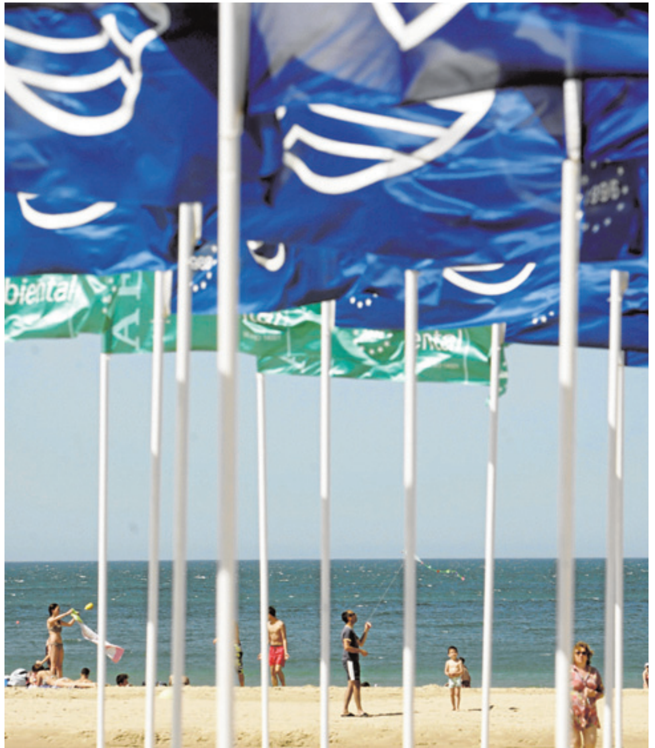
La provincia presume de las múltiples distinciones de calidad de sus playas.

Algeciras tiene playas que van de lo urbano a lo semiurbano, como es el caso de Getares. La Concha y el Chinarral son otros ejemplos, hasta llegar a lo más natural, como es el caso de las tres calas compuestas por un sistema rocoso. Por otro lado está El Rinconcillo, la playa más grande de Algeciras y la más reco-