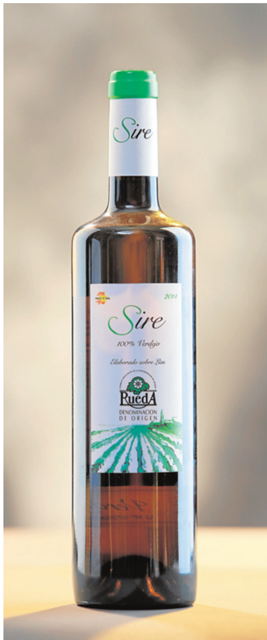
El Verdejo que llega a Cádiz directo desde las bodegas de Valladolid.