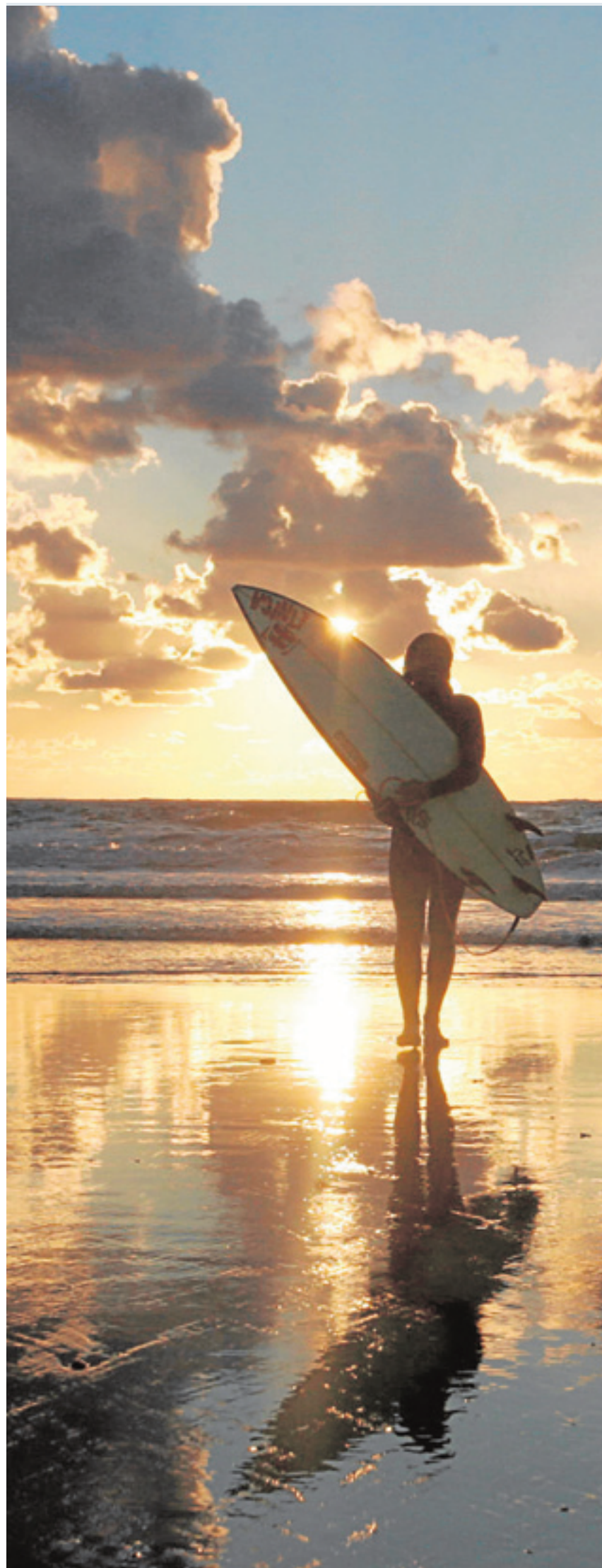
Una surfista sostiene su tabla en la Victoria mientras el sol cae.