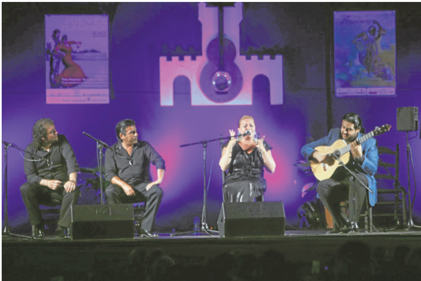
Los 'Jueves Flamencos' se han consolidado como uno de los grandes atractivos castizos de la noche gaditana.