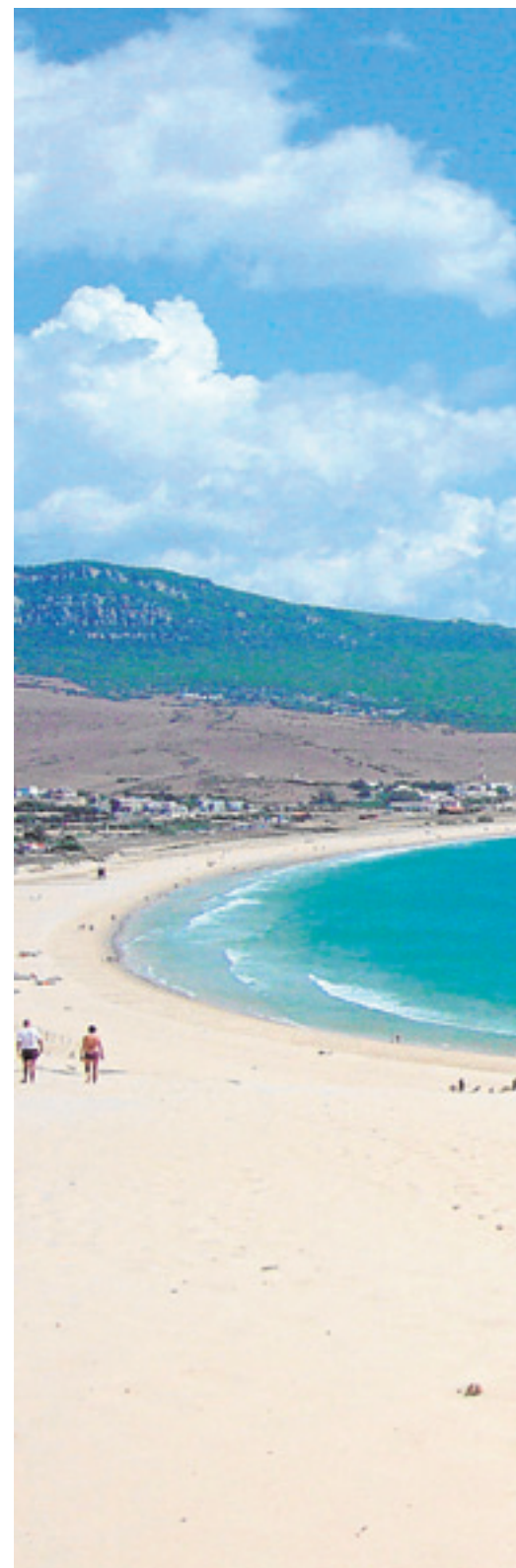
La playa de Bolonia, vista desde la duna

La arena es característica en cualquier playa o cala gaditana. Su textura hace que Cádiz sea un paraíso de costa puesto que adquiere, gracias a esa finura, un color blanquecino similar al de cualquier postal de los grandes destinos turísticos. La provincia tiene 260 kilómetros de costa y 138 kilómetros de playas: ca-