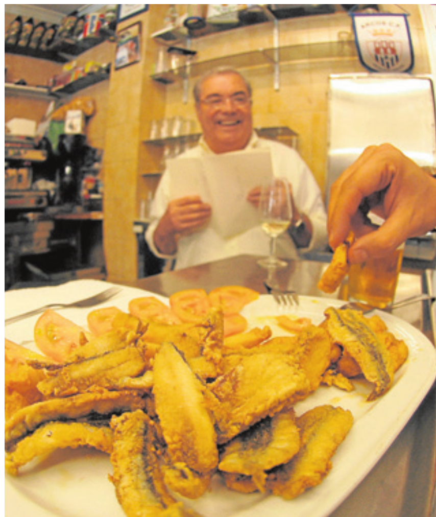
El pescaíto frito es uno de los reyes indiscutibles del verano:: LA VOZ