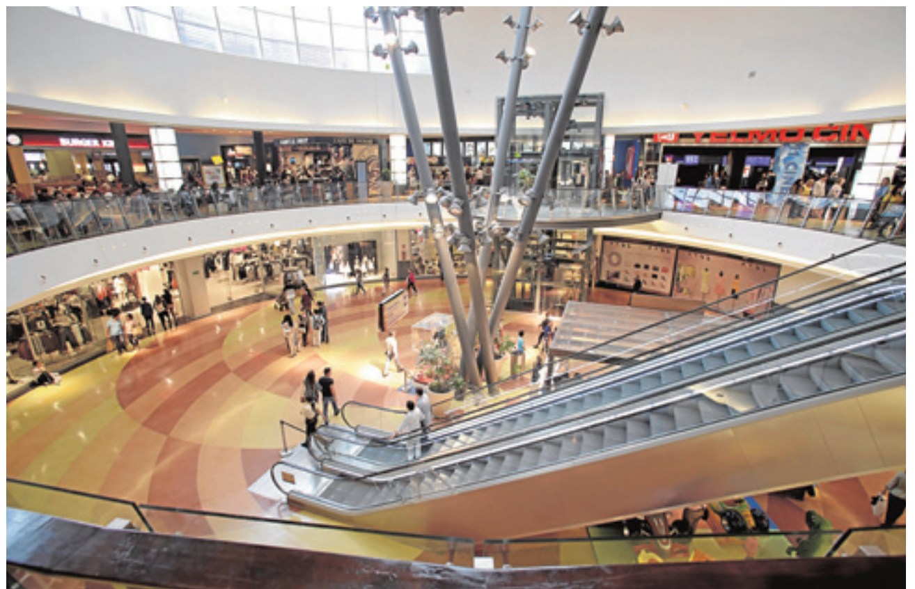
Zona de ocio y restauración del Centro Comercial Área Sur, con una gran oferta de entretenimiento. :: L. v.

Este verano se cumplen tres años desde que el Club Infantil Chiqui Sur abrió sus puertas por primera vez, un servicio gratuito que desde el primer momento siempre ha estado controlado por personal especializado. Más de 30.000 niños han pasado desde su inauguración por esta ludoteca dedicada a la diversión y al aprendizaje.