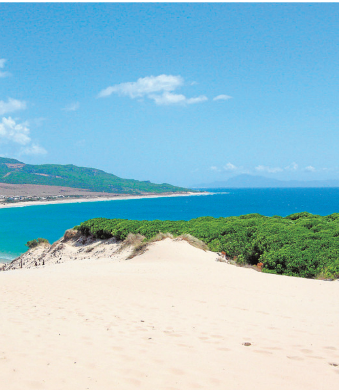
es una de las que más atrae a los visitantes de toda España.

radas vírgenes. Con más o menos servicios, pero todas con esa fina arena que pintan el paisaje de dunas.