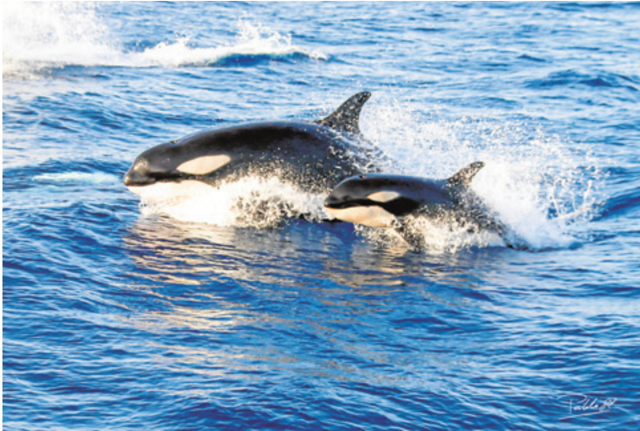
Orcas por el paso del Estrecho y avistadas por una de las embarcaciones con las que cuenta Turmares.