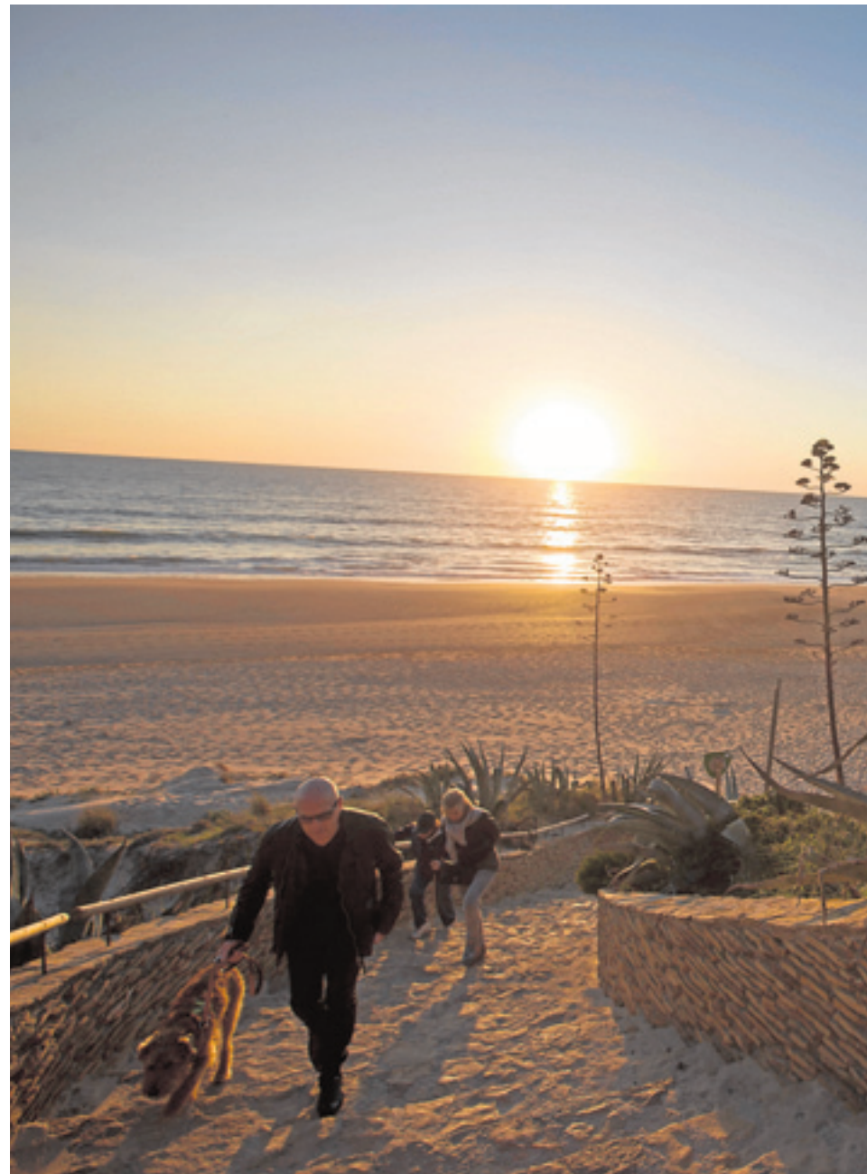
La práctica totalidad del litoral atlántico gaditano puede ver cómo el astro rey

No pueden faltar las puestas de sol en la playa y hay chiringuitos que saben cómo ambientar y aprovechar este fenómeno