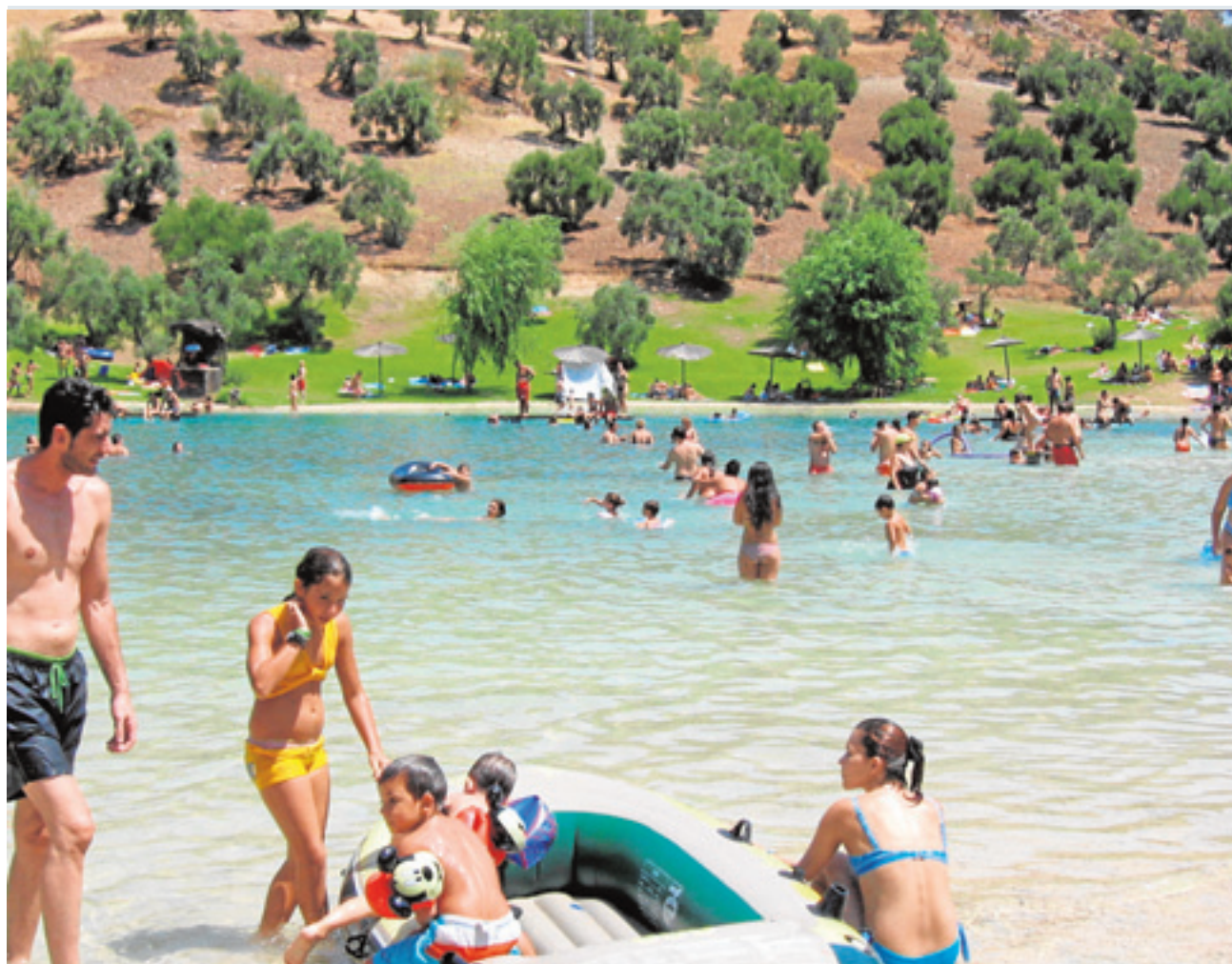
Decenas de gaditanos se acercan diariamente a Zahara cuando aprieta el calor.

Para llegar, hay que tomar la carretera de Grazalema, la CA-2300, y sin perder de vista en ningún momento el em-