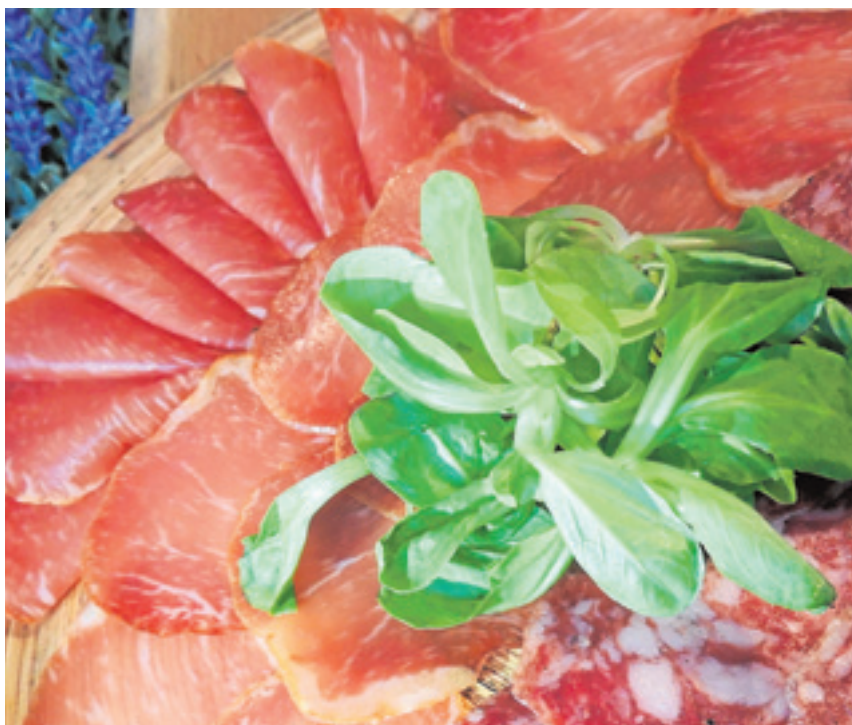
Gama de ibéricos procedentes desde pueblos como Monesterio.

El trato artesanal que ofrecen empresas como El Culebrín es lo que busca este distribuidor que ha conseguido que todo aquel que venga a Cádiz cuente también con los mejores productos del interior para combinar con aquellos de la costa. Tierra y mar sin moverse de la silla y a exigencia de los paladares más exquisitos.