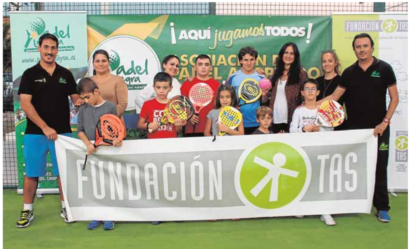
Alumnos, madres, profesorado de pádel y coordinadoras de la Fundación TAS en una de las sesiones de pádel L.R.1

Es por ello que la fundación y «Pádel Integra» firmaron en enero de 2013 un acuerdo de colaboración para impartir esta disciplina deportiva en auge a sus alumnos todos los martes de septiembre a junio. Esta asociación de pádel adaptado, que opera a nivel andaluz contando con escuelas en Málaga, Huelva, Cádiz y que tiene su sede en Sevilla, donde cuenta con 130 incritos y con un total de 4 escuelas, nació hace cuatro años con el objetivo de ofrecer a las personas con algún tipo de discapacidad un deporte que cuenta con multitud de aspectos positivos para