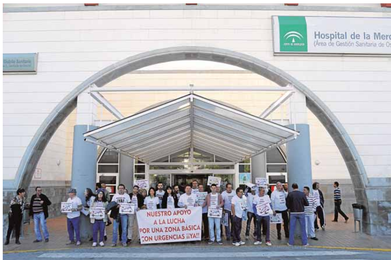
Miembros de la plataforma vecinal y alcaldes de la Sierra Sur en la concentración del pasado fin de semana

ha servido para la grabación del proyecto #SevillaBaila, que ha llevado hasta el ruedo ursaonense a bailarines de distintas modalidades que participan en este proyecto que pretenden aunar la cultura, la danza y las ciudades de Osuna y Sevilla. B.M.