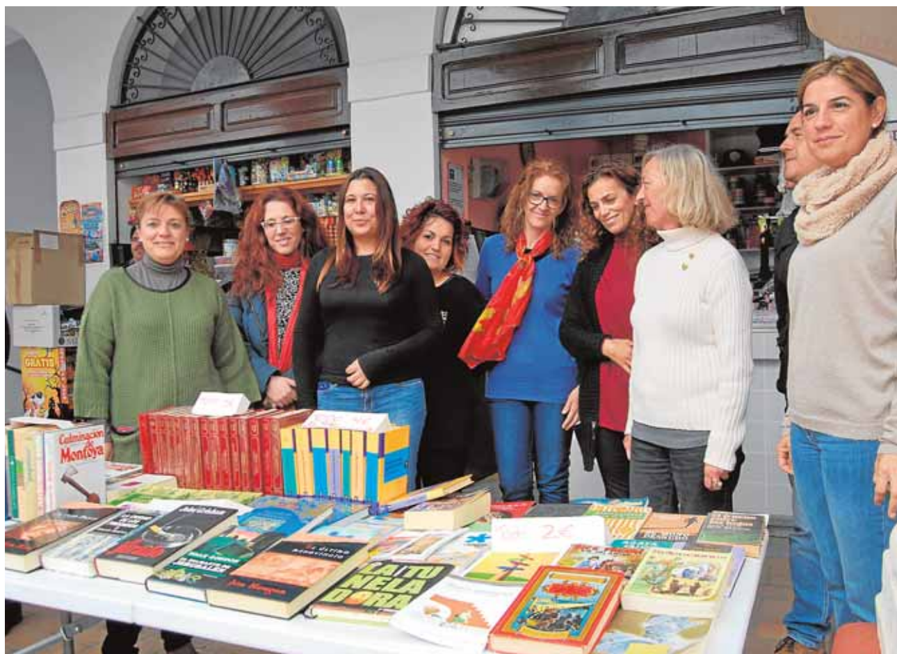
Un grupo de comerciantes en el mercadillo de libros que organizan una vez al mes

les especiales durante tres meses. La mayoría realizarán su labor en la delegación de Infraestructuras y en la empresa municipal Limancar. Se encargarán de manera especial de la limpieza y mantenimiento de calles, plazas y zonas verdes.