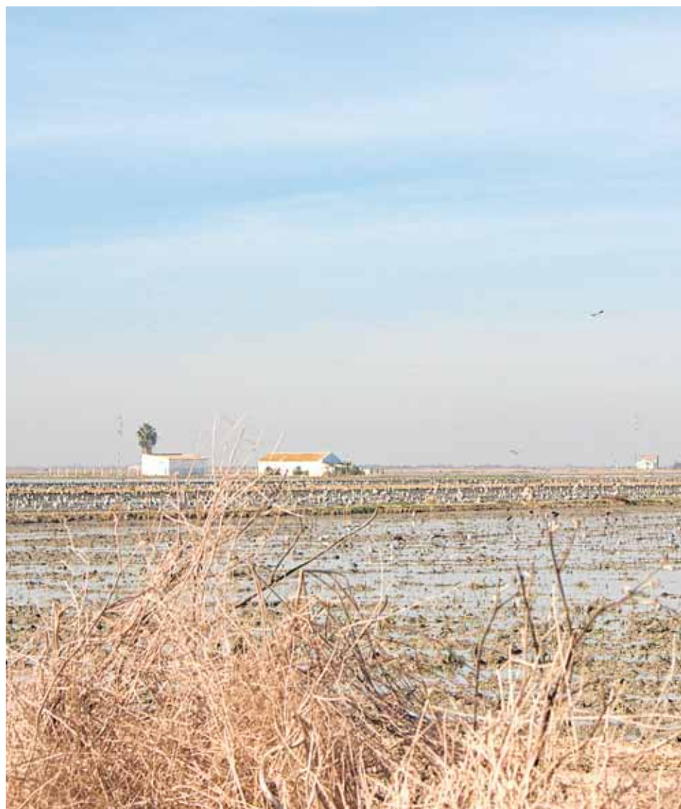
Tablas de arroz fangueadas en Isla Mayor, donde se rodó «La isla mínima»

La joya de la corona En Isla Mayor se cultivan diferentes variedades de arroz, siendo el «Marisma» el de mayor calidad