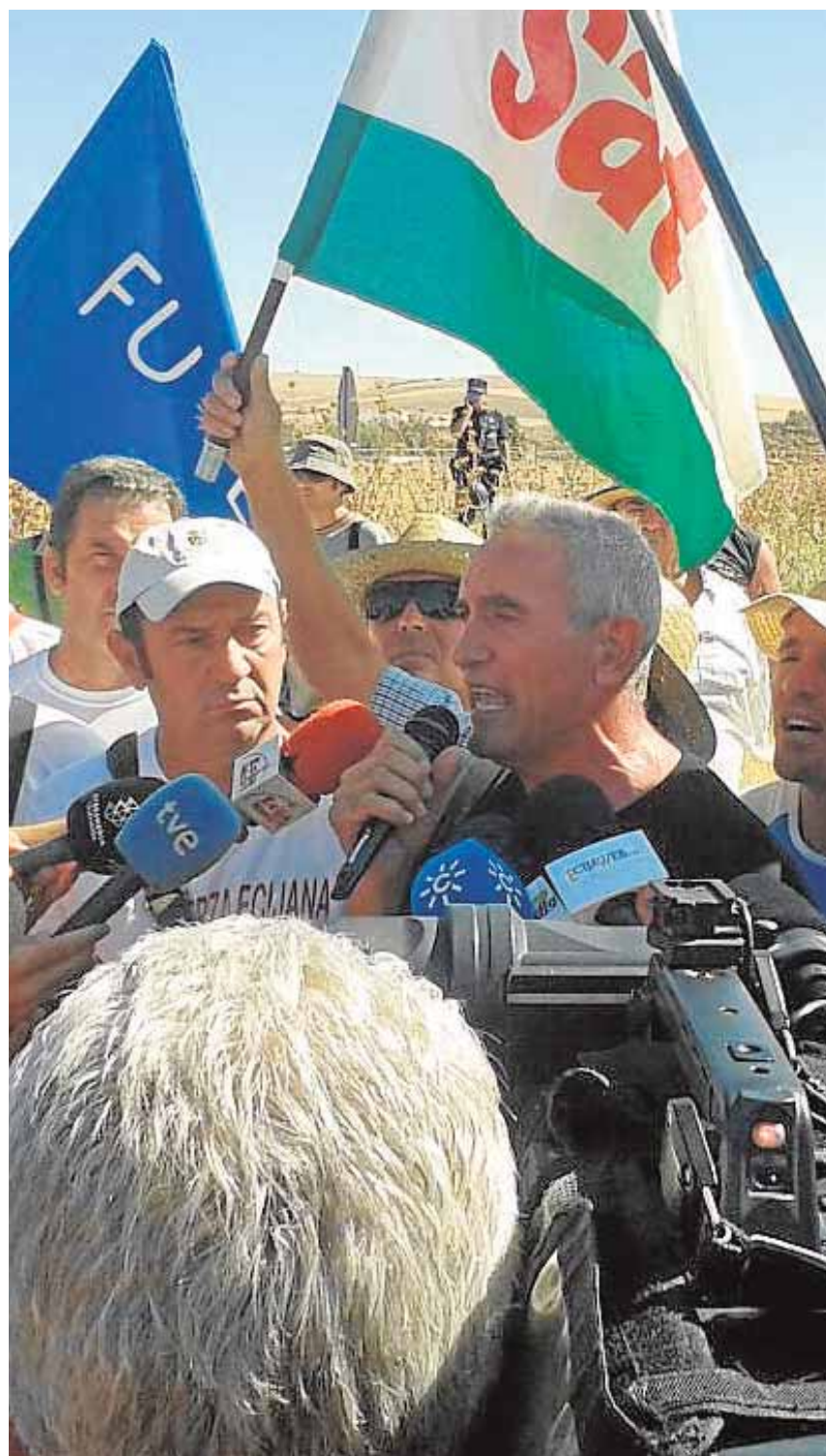
La finca Las Islas fue objeto de una ocupación el pasado verano

Los distintos grupos políticos han aludido a razones económicas, patrimoniales e incluso históricas para jus-