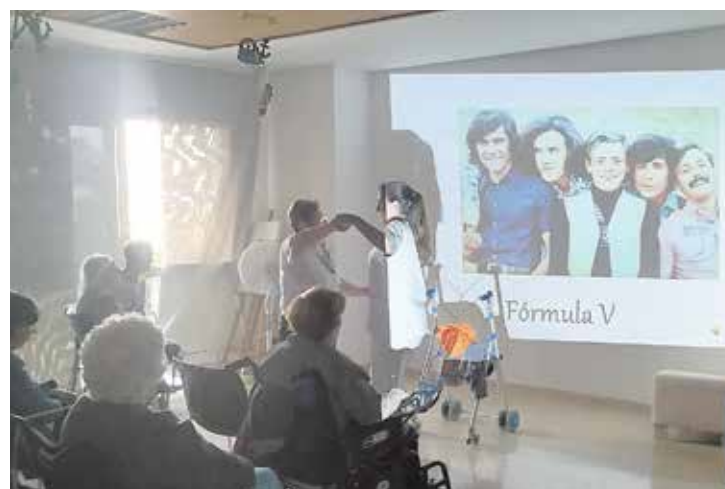
El taller gozó de una gran aceptación entre los usuarios