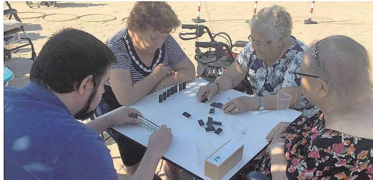
En este taller se realiza una gran variedad de actividades

ría realizamos algunas actividades como los juegos de mesa (bingo, cartas, parchís, dominó).