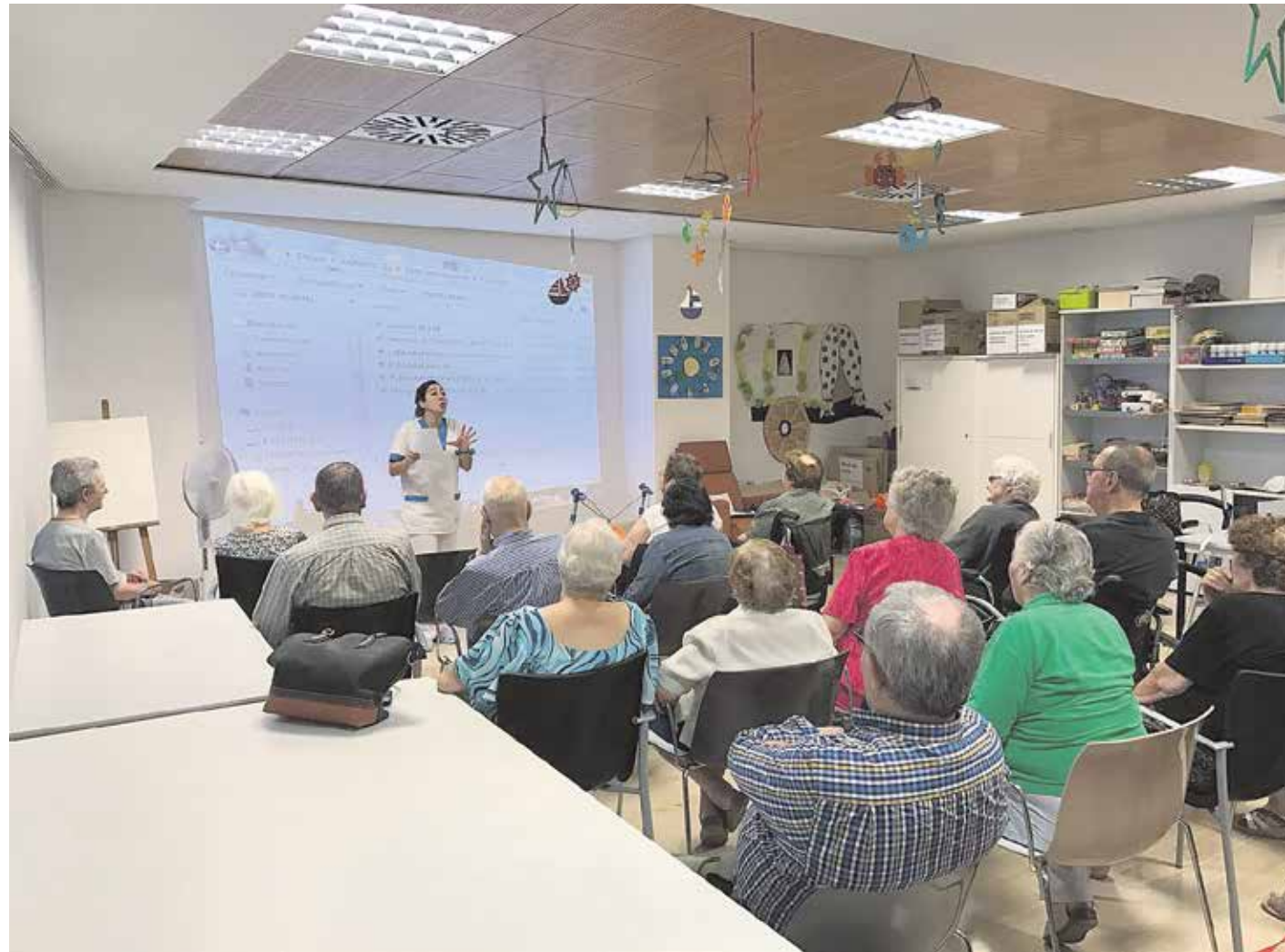
Durante el taller se usaron numerosos recursos como anuncios, fotos,

Al mismo tiempo que se estimulaba la movilización de recursos cognitivos, se favoreció la participación social, los sentimientos de bienestar y la autoestima de los residentes.