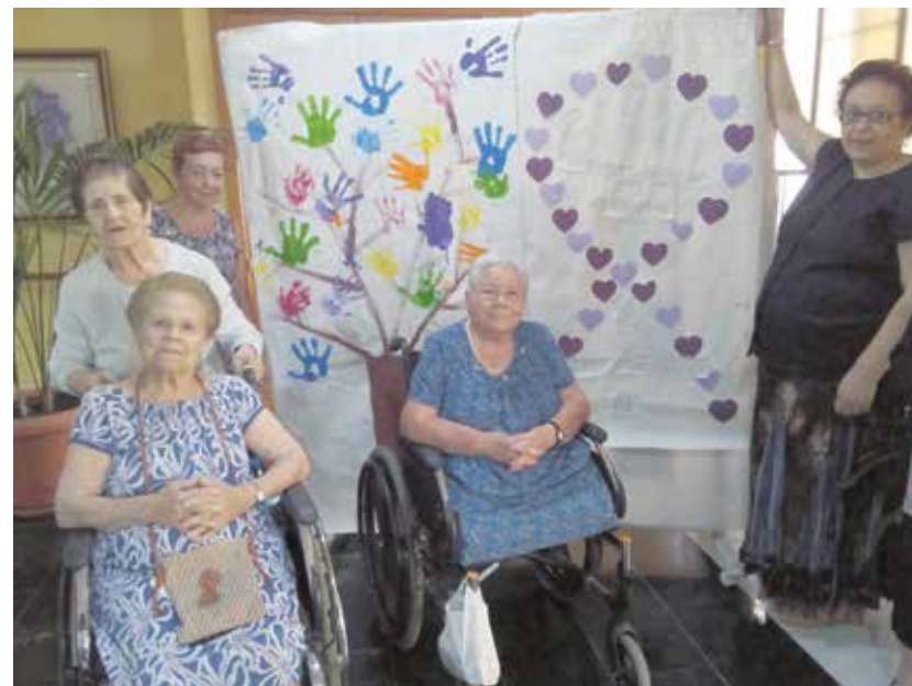
Algunas de las usuarias con el mural realizado

Estos talleres nos ayudan a la estimulación de la me-