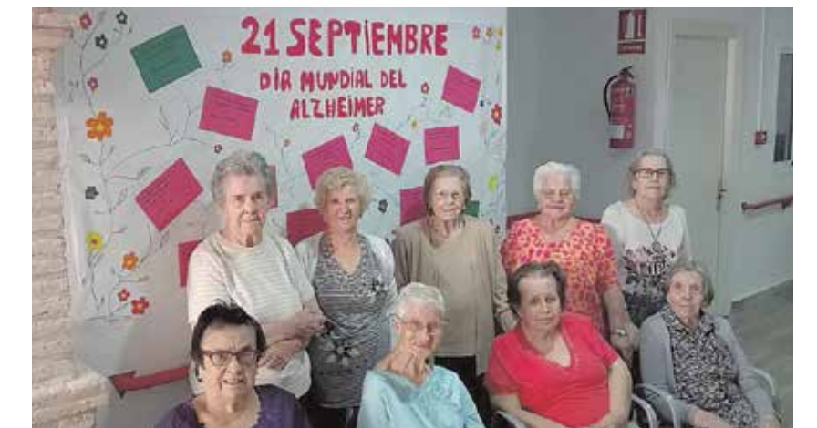
Las participantes en el Taller Muro de los Recuerdos

Hable el son de las viejas normas de mi corazón.