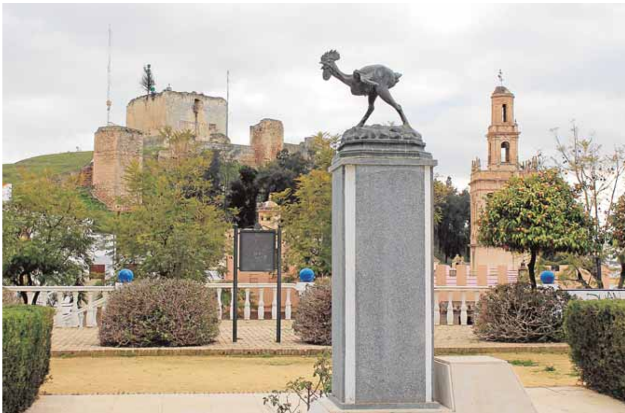
El Gallo de Morón en el Paseo con el Castillo y San Miguel de fondo

tendrá lugar el día 27, en la caseta municipal, a las once de la mañana, y las actividades se extenderán hasta el lunes 29. Entre otras actividades, habrá servicio de chocolates y churros todas las tardes, así como un desfile el domingo, a las cuatro.