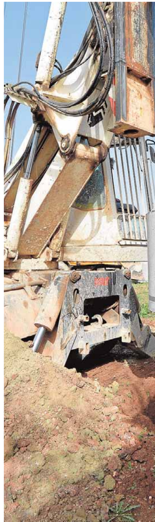
Construcción de un pozo de agua con maqui

Las peticiones de pozos servían normalmente para dar agua al ganado o para regar campos de cultivo, como el del algodón que se sembraba en Lantejuela. Unas necesidades que le dieron gran importancia a los poceros. «El tra-