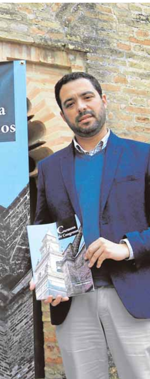
...omociona el turismo de congresos

Premio de España (GPE) 2015 de teatro, música, danza y actividades educativas relacionadas con la escena, en la categoría de certamen teatral. El certamen, que recibirá el premio el 22 de junio en Barcelona, ya prepara su quinta edición.