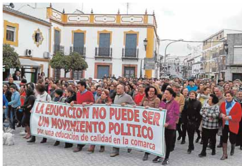
La manifestación recorrió las calles de la localidad