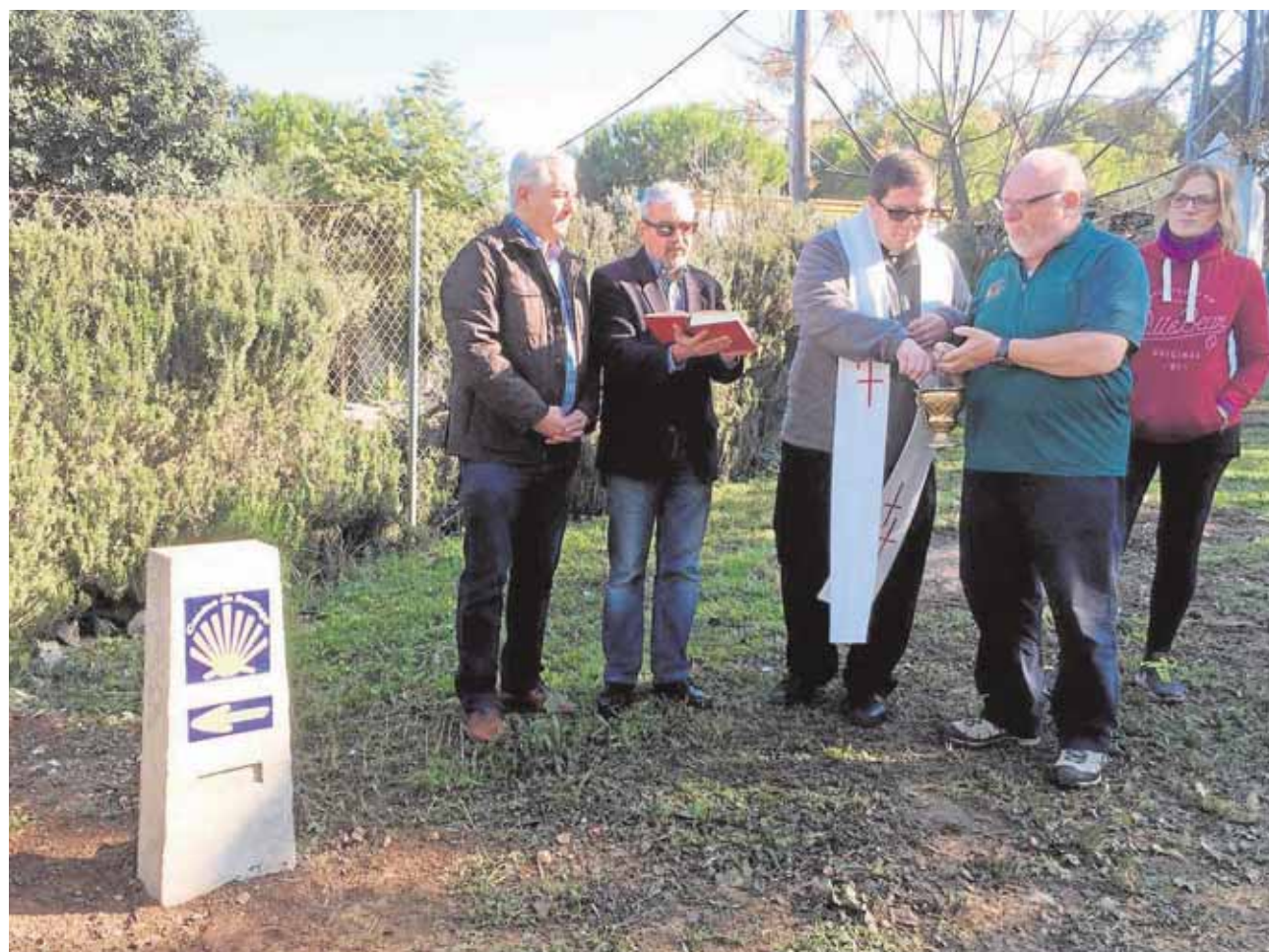
El monolito de la Vía Augusta del Camino de Santiago se localiza junto a la ermita de la Virgen del Rosario

Alternativa a otras rutas En cuatro años se espera multiplicar por cien los peregrinos que opten por esta ruta compostelana