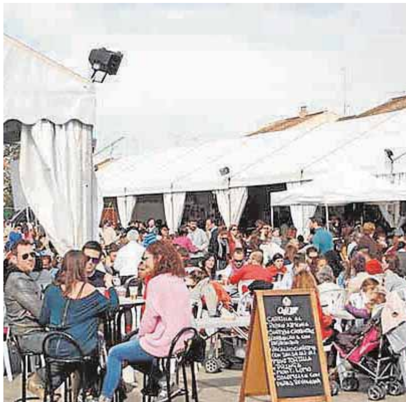
Las dos últimas ediciones recibió unas 20.000 visitas

ExpoMairena pretende afianzarse como el gran escaparate para la Innovación, el desarrollo socioeconómico y comercial de la comarca de Los Alcores, y se postula como candidato a plan ideal para la provincia de Sevilla durante el Puente de Andalucía. Esta renovada edición ofrecerá al visitante una importante variedad de empresas y servicios, con una participación de hasta un 70% del tejido empresarial local y un 15% de El Viso del Alcor, con expositores de sectores como la alimentación, moda, ocio, decoración, menaje, automoción, artesanía y agricultura ecológica. Además, dispondrá de zona de restauración donde degustar platos de la gastronomía mairenera y andaluza. Participan Elixir Tapas, restaurante El Cine, Lemon Food&Drink y catering Carrasque-