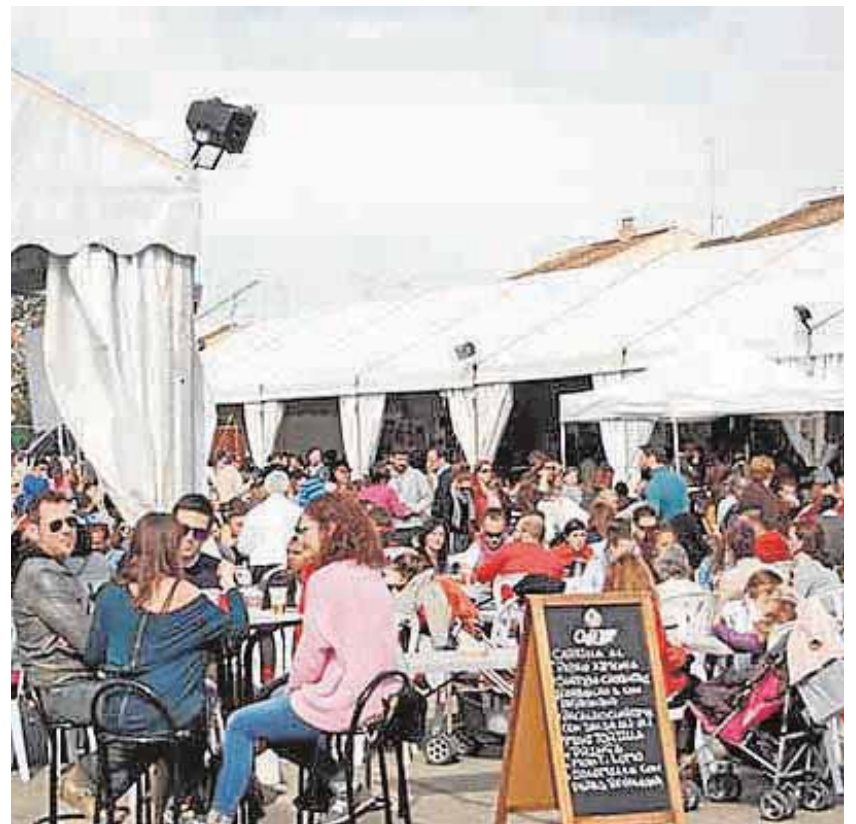
Las dos últimas ediciones recibió unas 20.000 visitas A.G.

ExpoMairena pretende afianzarse como el gran escaparate para la Innovación, el desarrollo socioeconómico y comercial de la comarca de Los Alcores, y se postula como candidato a plan ideal para la provincia de Sevilla durante el Puente de Andalucía. Esta renovada edición ofrecerá al visitante una importante variedad de empresas y servicios, con una participación de hasta un 70% del tejido empresarial local y un 15% de El Viso del Alcor, con expositores de sectores como la alimentación, moda, ocio, decoración, menaje, automoción, artesanía y agricultura ecológica. Además, dispondrá de zona de restauración donde degustar platos de la gastronomía mairenera y andaluza. Participan Elixir Tapas, restaurante El Cine, Lemon Food&Drink y catering Carrasque-