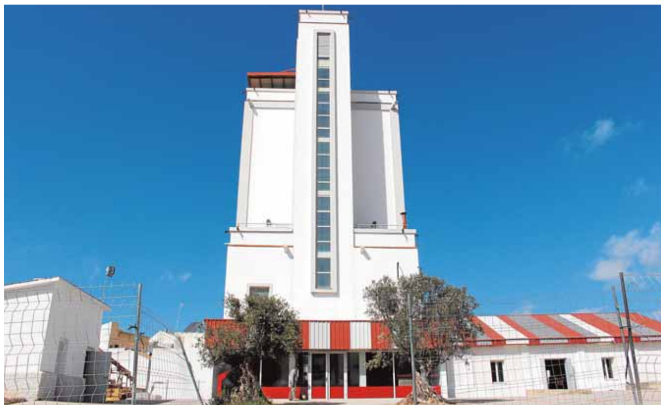
Vista del silo de Fuentes de Andalucía, edificio rehabilitado y musealizado que se abrirá en breve

Finalmente, frente a los signos del pasado se sitúa Gemosolar, símbolo del presente y del futuro al ser la primera planta a escala comercial en el mundo que aplica la tecnología de receptor de torre central y almacenamiento térmico en sales fundidas. Con 2.650 heliostatos repartidos en 185 hectáreas, asegura la producción eléctrica durante unas 6.500 horas al año.