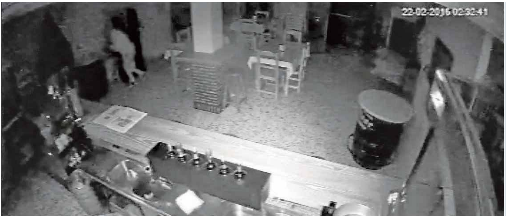
Una cámara de seguridad capta el momento en que un ladrón accede al bar Rocío, en Los Palacios, el pasado lunes

gran número de ornitólogos aficionados y profesionales en el momento más espectacular de la primavera en Doñana. En ella se podrá disfrutar de numerosas conferencias, rutas y actividades relacionadas con la ornitología. F.R.M.