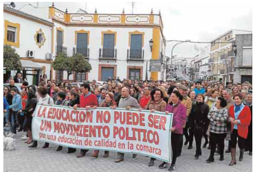
La manifestación recorrió las calles de la localidad