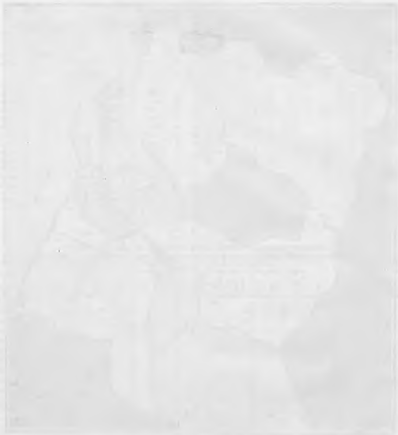
Topographic map of the region shown above.