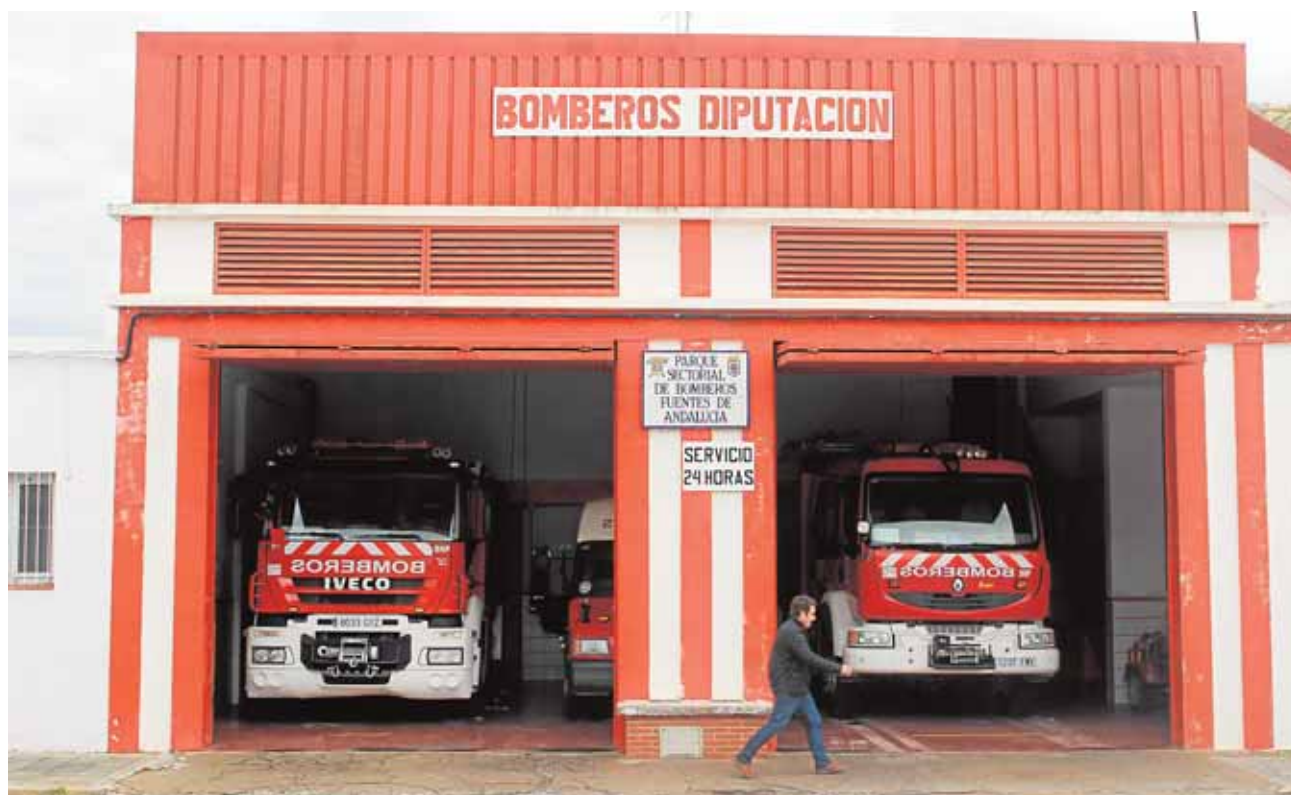
Fuentes de Andalucía cuenta con su propio parque de bomberos, que recibe ayudas de Diputación Provincial A.L.