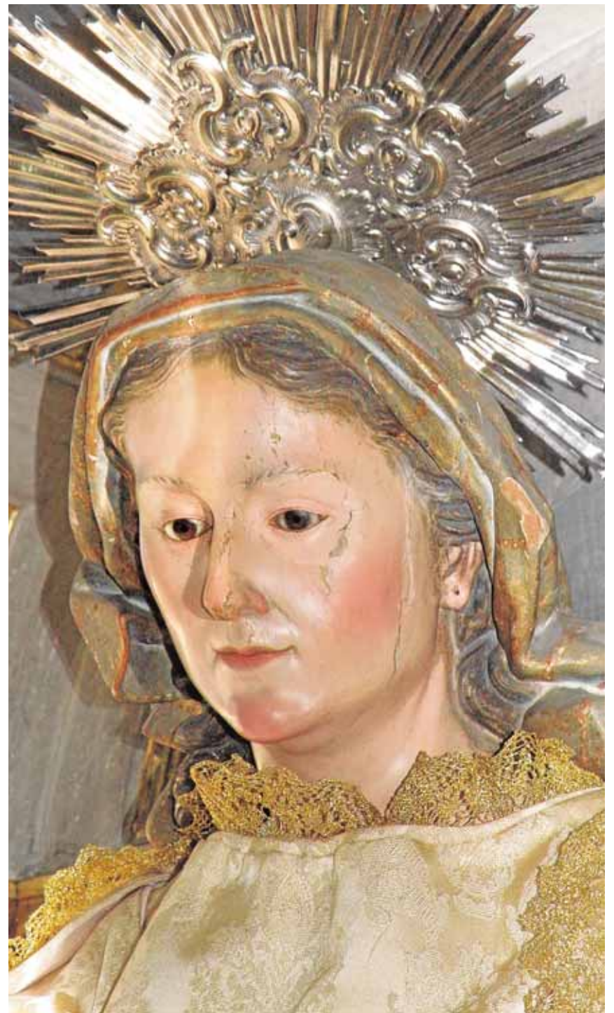
La imagen de Santa Ana puede verse en la iglesia de San Pedro

Una obra olvidada La imagen de la santa con la Virgen es una talla excepcional prácticamente olvidada en la historiografía