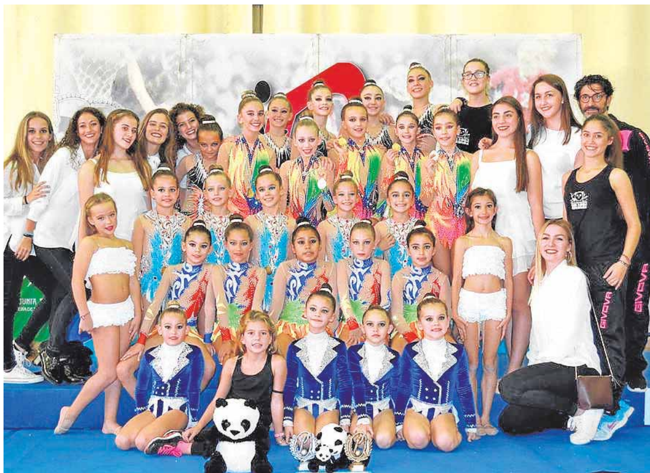
Club de Gimnasia Rítmica Oso Panda en el Torneo Nacional de Conjuntos Villa de la Rinconada

nativo de tres euros. Estos son la obra de teatro «Bufonerías», de Alfonso Zurro, el sábado 3 a las 19:30h en el Teatro Municipal; así como la actuación del cuarteto Emispherio, que se celebrará en la Iglesia Parroquial San Pedro Apostol a las 18:00 horas.