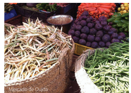
Mercado de Oujda