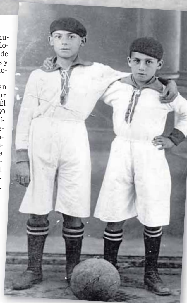
Dos aficionados locales en 1922

«El origen del fútbol en Osuna» es la primera parte de un proyecto personal que hablará en su primera parte del nacimiento de este deporte y su afición desde 1920 hasta la Guerra Civil. «En un futuro hablaré sobre el fútbol ursaeonense desde la posguerra hasta 1960 y la tercera parte sobre el fútbol hasta la actualidad». Reconoce que ha tenido que hacer esta división por la gran