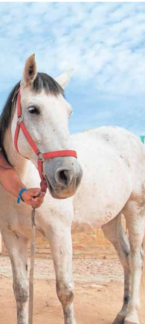
ín, del Club Caballista de Carmona A.M.

de Deportes informa que el plazo de inscripción se mantendrá abierto hasta el miércoles 16, siendo el tope de 600 participantes. La inscripción es gratuita para las categorías infantiles mientras que el resto deben abonar 5 euros a través de la web.