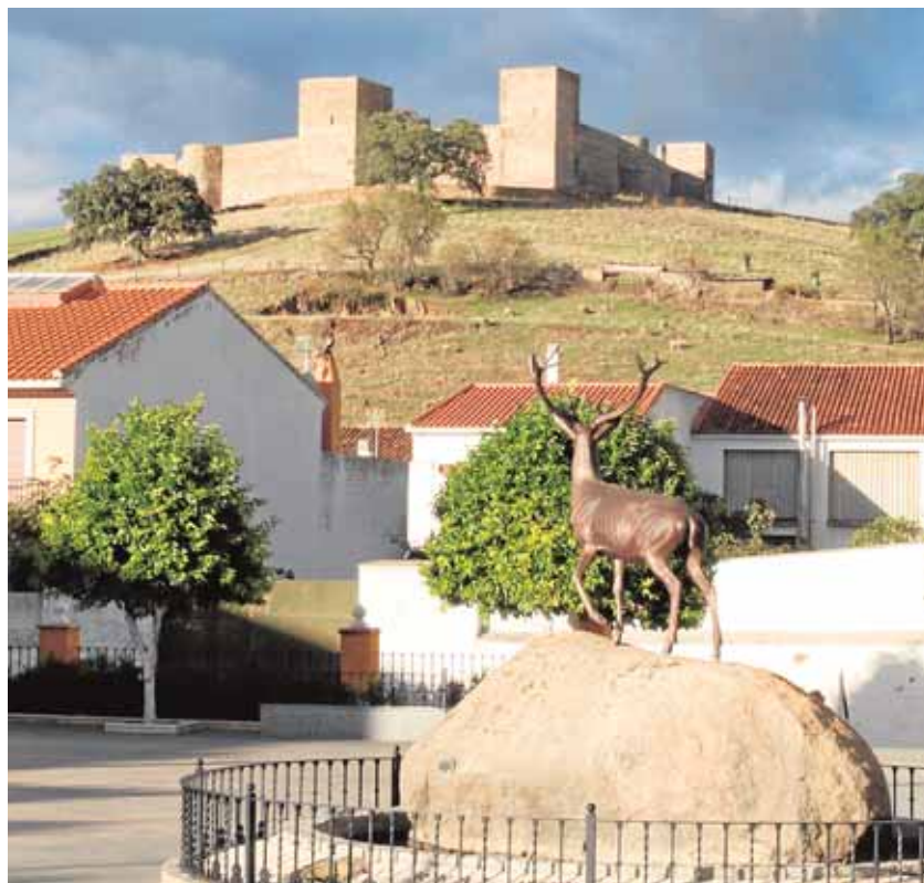
El museo espera ser otro atractivo turístico de El Real de la Jara

Mobiliario, materiales de cocina o de lavado, maquinaria agrícola, instrumental de ganadería o incluso adornos como cuadros, pinturas o re-