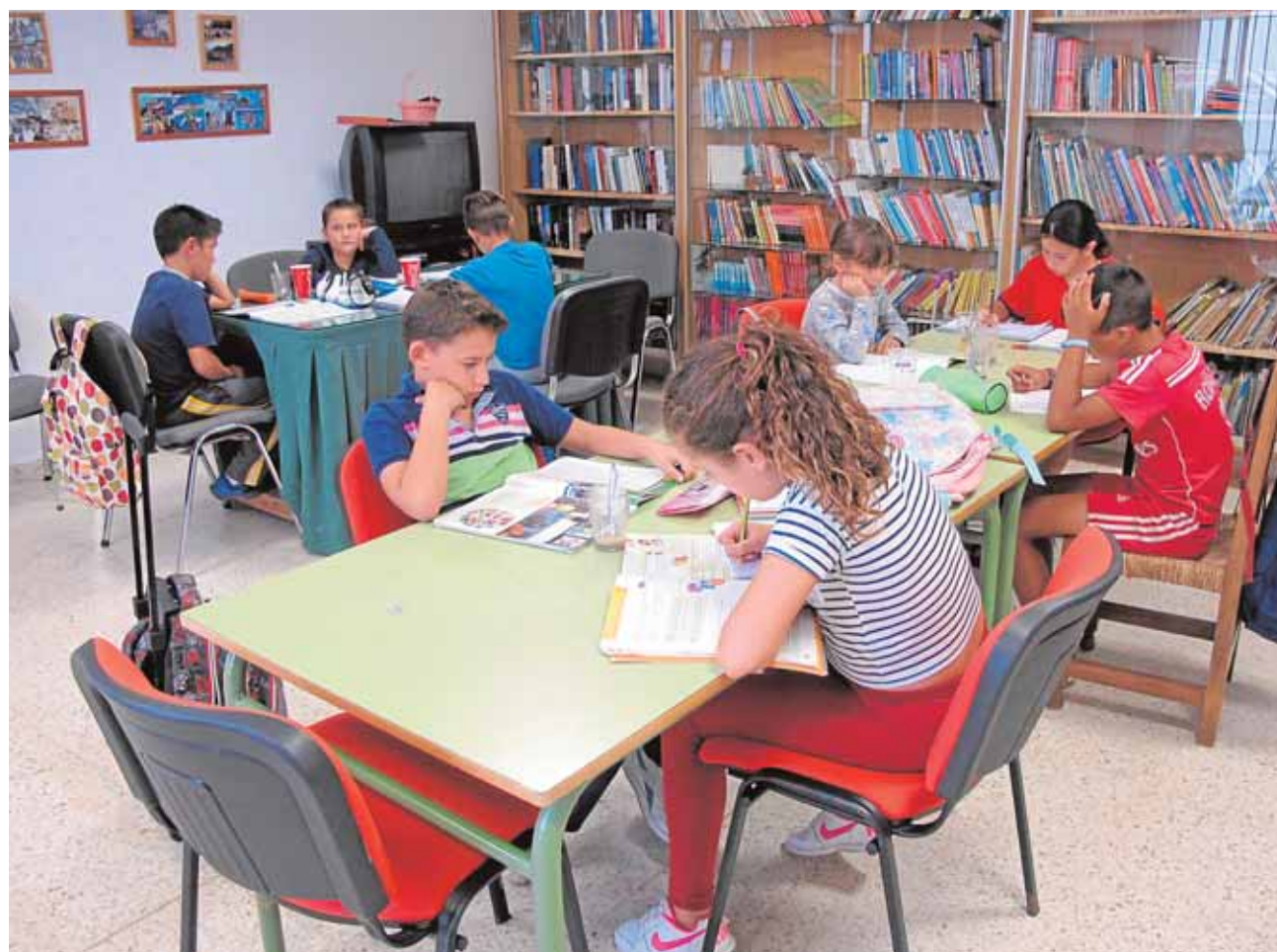
La educación es uno de los aspectos en los que más incide Alpred con los menores desfavorecidos