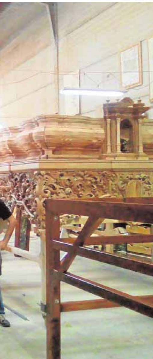
e carpintería y talla religiosa

tas actividades para disfrutar en familia durante la tarde del viernes. El objetivo es acercar de manera divertida el monumento natural del Cerro del Hierro a los más pequeños. La actividad es gratuita y se iniciará a las 17. horas. G.J.L.