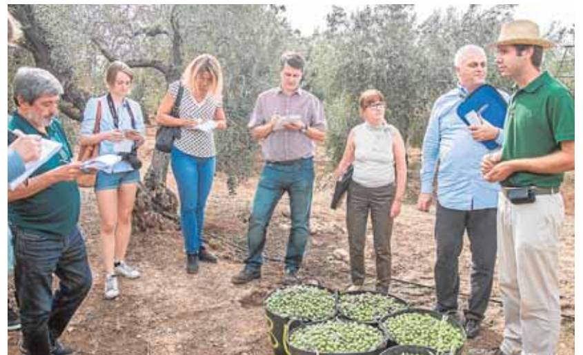
Los periodistas asistieron al trabajo que se hace en los olivares