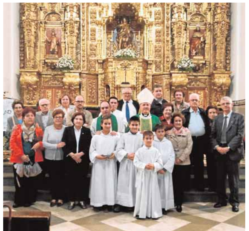
Varios miembros de la asociación junto al obispo tras la misa

El colofón a toda la semana llegará la tarde del sábado a partir de las 19 horas con la bendición e inauguración oficial de la Plaza Asociación Provida, situada en la confluencia de las calles Cristóbal Colón, Marchenilla y Armenta, donde se ubica la sede de la asociación. Con la inauguración se culmina el reconocimiento que el pleno municipal hizo «por tantísimos años de labor ayudando a tantas familias necesitadas».