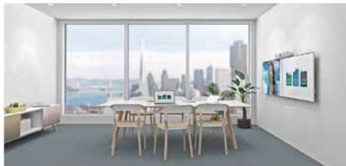
Cisco Spark Room Kit