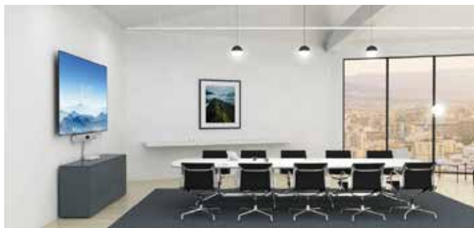
Cisco Spark Room Kit Plus