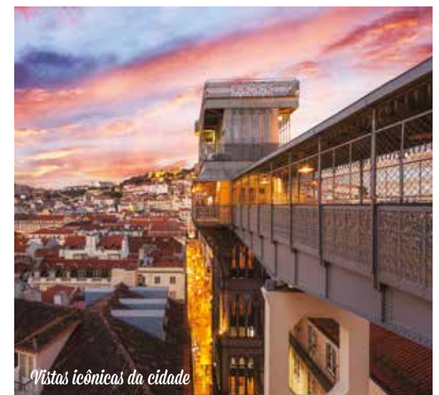
Vistas icônicas da cidade

Café da manhã no hotel. Traslado para o aeroporto de Lisboa.