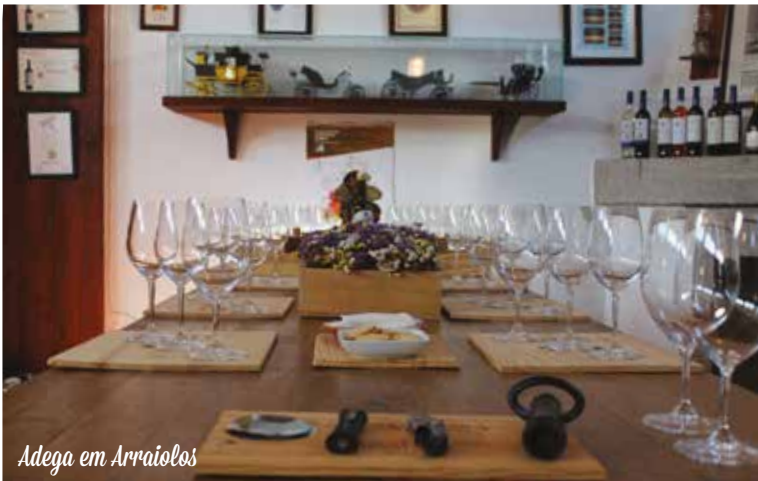
Adega em Arraiolos