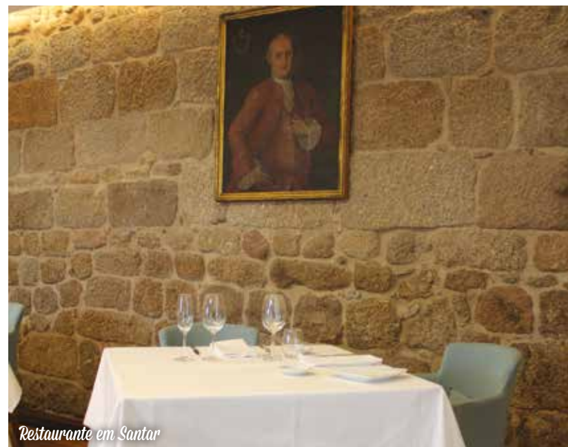
Restaurante em Santar