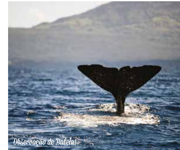
Observação de Baleias