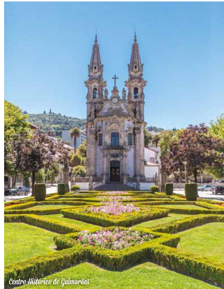
Centro Histórico de Guimarães