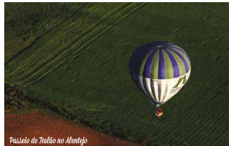
Passeio de Balão no Alentejo