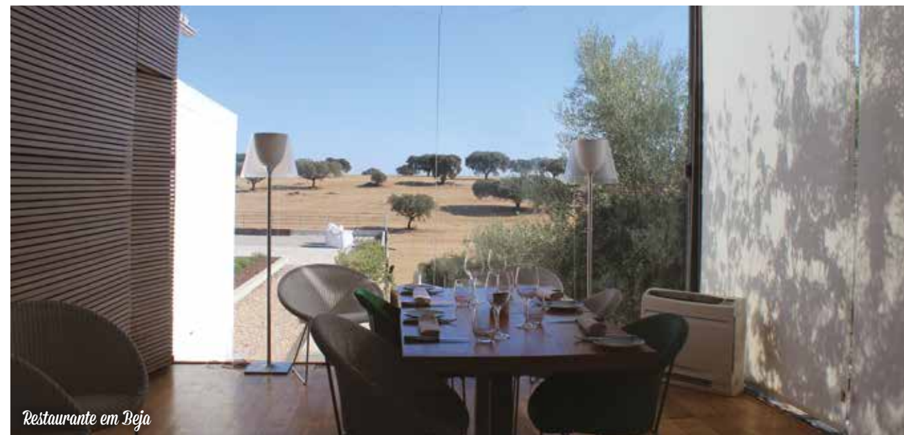
Restaurante em Beja