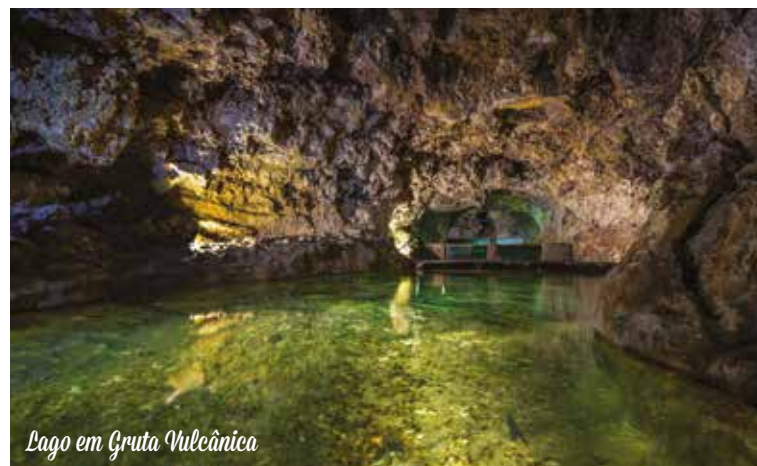
Lago em Gruta Vulcânica