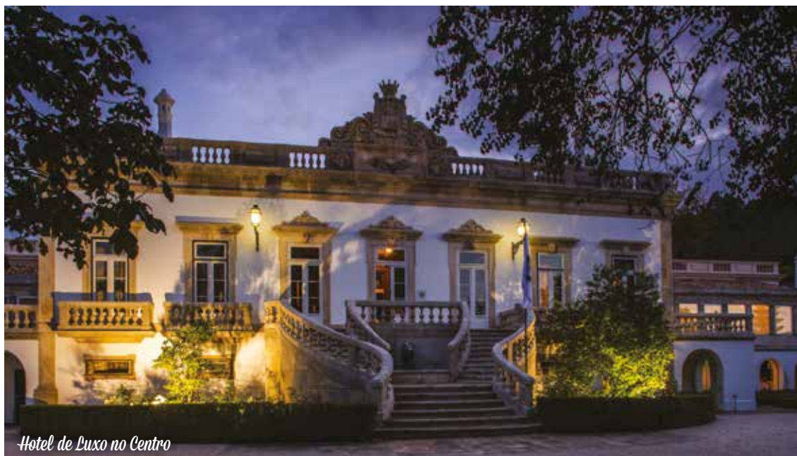
Hotel de Luxo no Centro