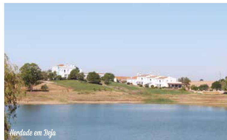
Herdade em Beja

que contam com salas majestosas cheias de histórias do país e local. O centro de Vila Viçosa está repleto de monumentos únicos, como o castelo, panteão das duquesas, igrejas que juntos contam a história da vila. À tarde, visitaremos uma vinícola de renome em Reguengos de Monsaraz com paisagem estonteante, hectares e hectares de vinhas, e produção própria de azeite. Após a visita, podemos escolher entre fazer um passeio de barco único nas águas do Alqueva, ou conhecer um museu de olaria, acabaremos o dia em Vidigueira.