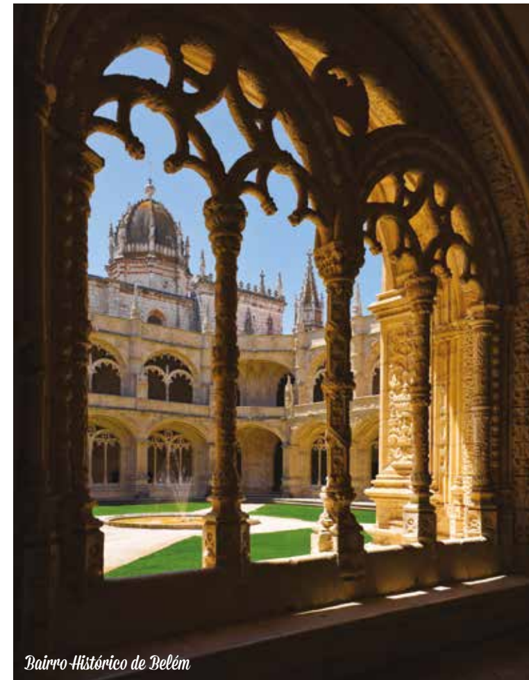
Bairro Histórico de Belém