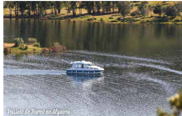
Passeio de Barco no Alqueva

Café da manhã no hotel. Desvendaremos os mistérios e histórias da cidade-museu do Alentejo, Vila Viçosa, também, conhecida como a capital do mármore em Portugal. Foi nesta vila que se mantiveram, durante vários séculos, os duques de Bragança até à Proclamação da República, bem como, as suas propriedades e o magnífico Paço Ducal de Vila Viçosa,