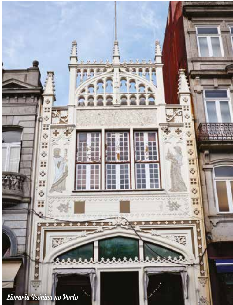
Livraria Lello no Porto