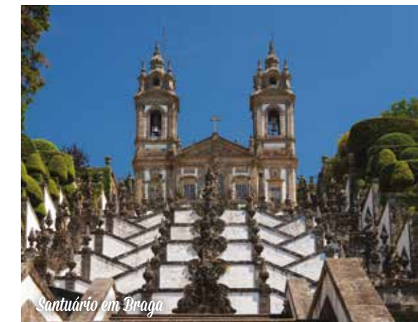
Santuário em Braga

Os preços abaixo mencionados são para duas pessoas, com base em alojamento em quarto duplo, de acordo com a categoria escolhida, válidos para o período indicado, e incluindo os serviços a seguir mencionados. O alojamento e serviços incluídos estão sujeitos a disponibilidade até o momento da reserva: