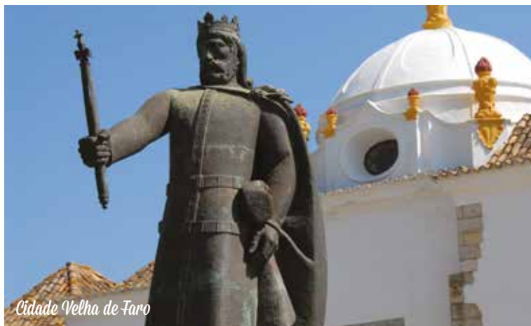
Cidade Velha de Faro