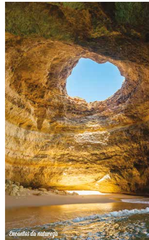
Encantos da natureza

Café da manhã no hotel. Traslado para o aeroporto de Faro.