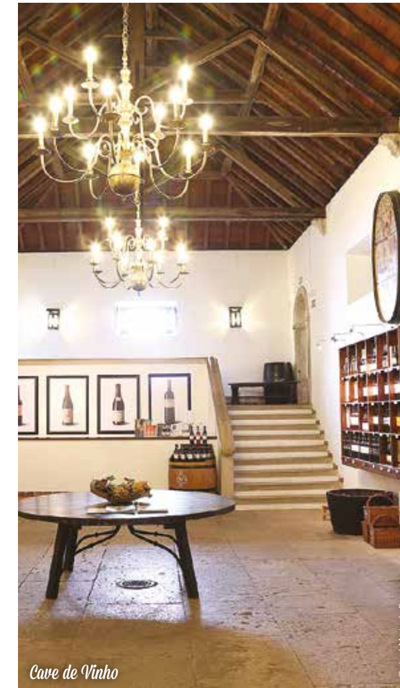
Cave de Vinho