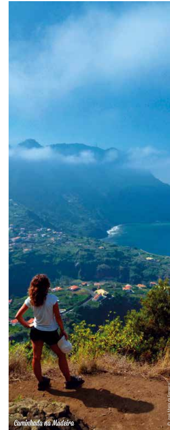
Caminhada na Madeira

Os preços abaixo mencionados são para duas pessoas, com base em alojamento em quarto duplo, de acordo com a categoria escolhida, válidos para o período indicado, e incluindo os serviços a seguir mencionados. O alojamento e serviços incluídos estão sujeitos a disponibilidade até o momento da reserva: