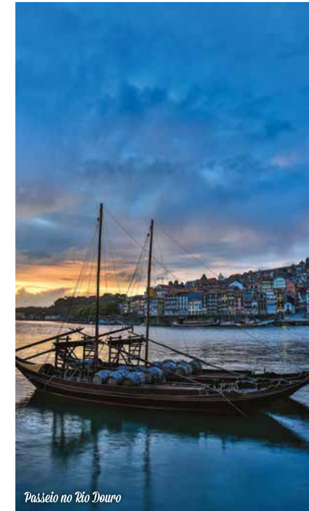
Passeio no Rio Douro