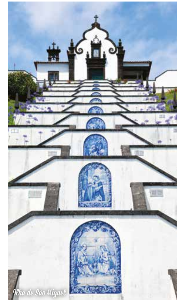
Ilha de São Miguel

Os preços abaixo mencionados são para duas pessoas, com base em alojamento em quarto duplo, de acordo com a categoria escolhida, válidos para o período indicado, e incluindo os serviços a seguir mencionados. O alojamento e serviços incluídos estão sujeitos a disponibilidade até o momento da reserva: