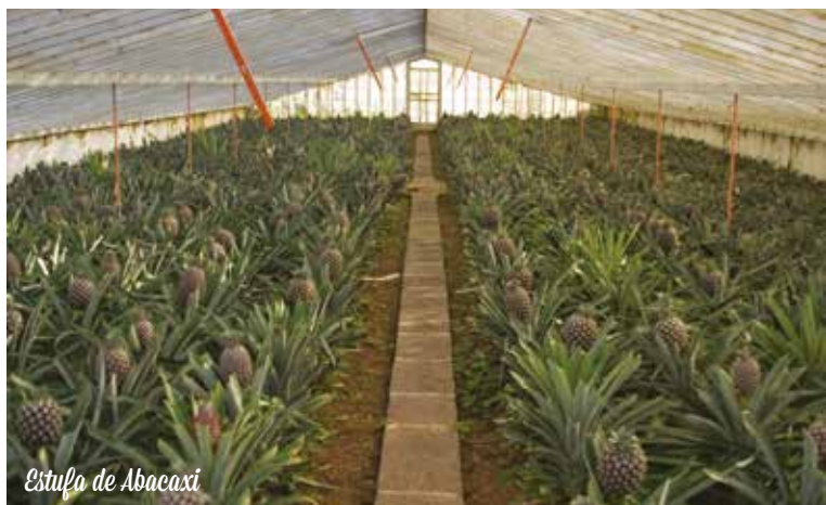
Estufa de Abacaxi