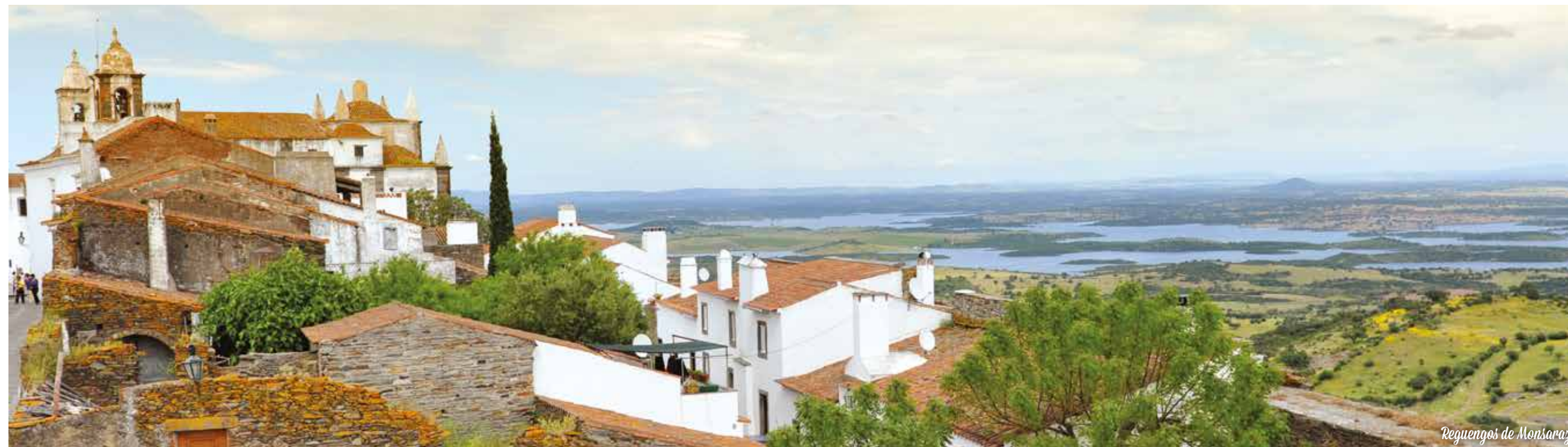
Reguengos de Monsaraz

Ao longo de sua estadia delicie-se com a gastronomia portuguesa, rapidamente irá perceber que sentar-se à mesa significa saborear as melhores iguarias que o litoral e o campo têm para oferecer. Cada região tem a sua característica, cada prato tem o seu tempero especial e cada prato tem o