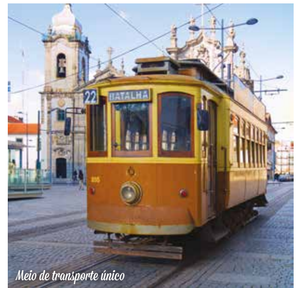
Meio de transporte único

Café da manhã no hotel. Traslado para o aeroporto do Porto.