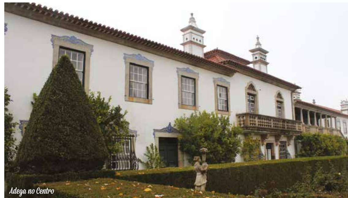
Adega no Centro