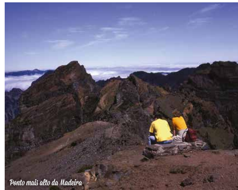
Ponto mais alto da Madeira