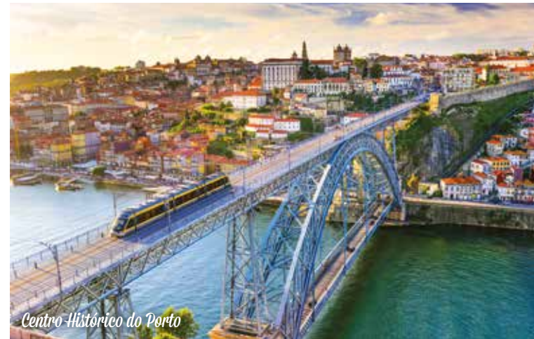
Centro Histórico do Porto