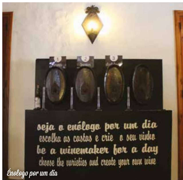
Enólogo por um dia