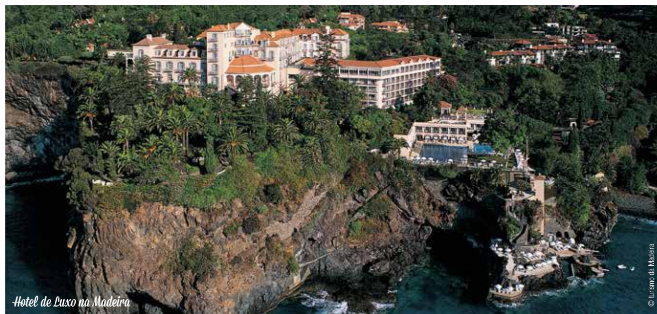
Hotel de Luxo na Madeira