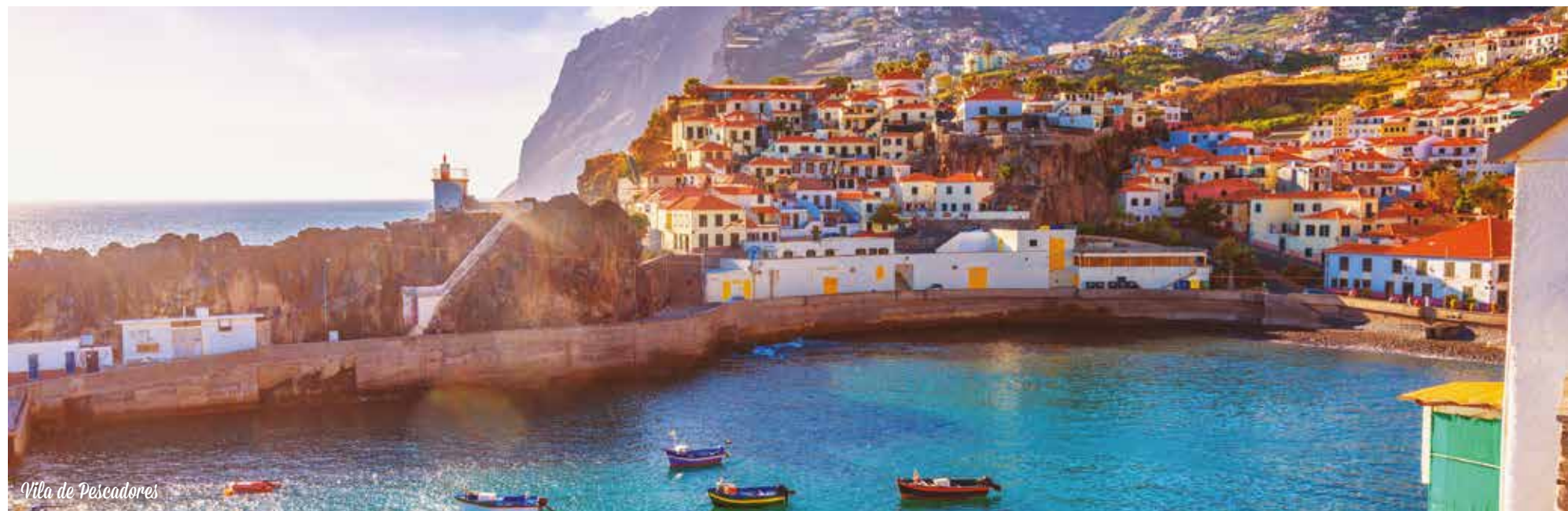
Vila de Pescadores