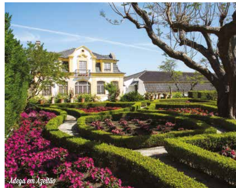
Adega em Azeitão