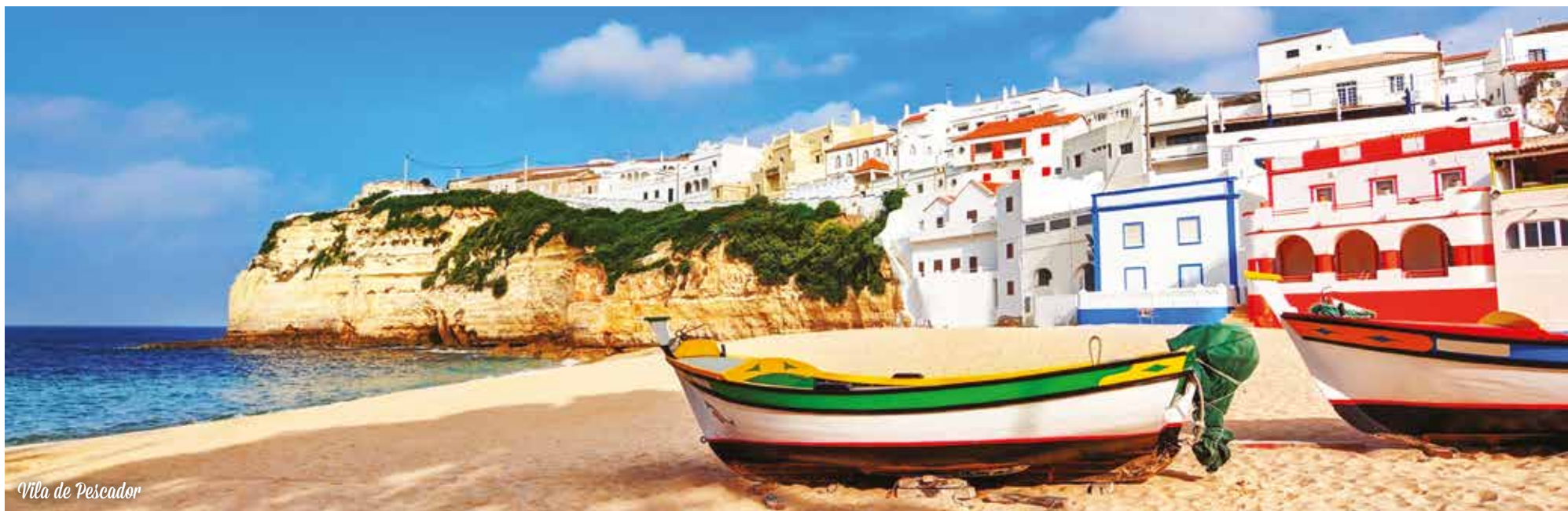
Vila de Pescador