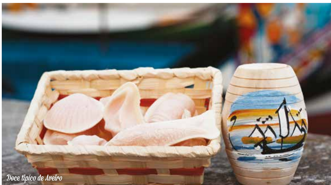
Doce típico de Aveiro