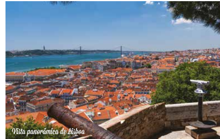
Vista panorâmica de Lisboa