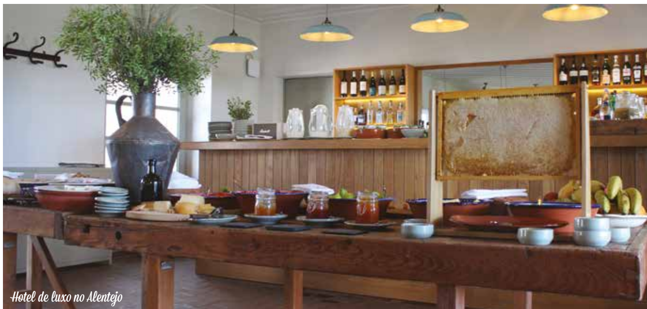
Hotel de luxo no Alentejo