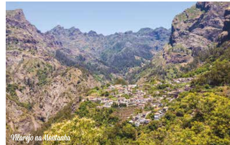
Vilarejo na Montanha