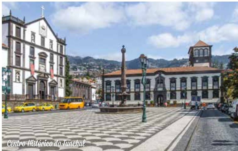
Centro Histórico do Funchal

Café da manhã no hotel. Traslado para o aeroporto do Funchal.