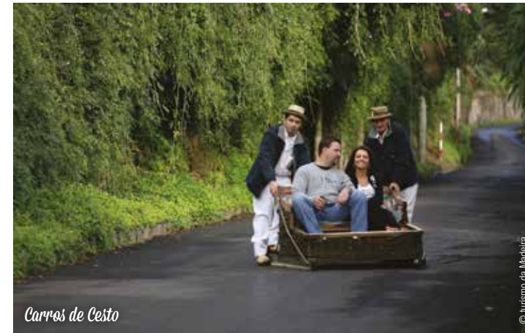
Carros de Cesto