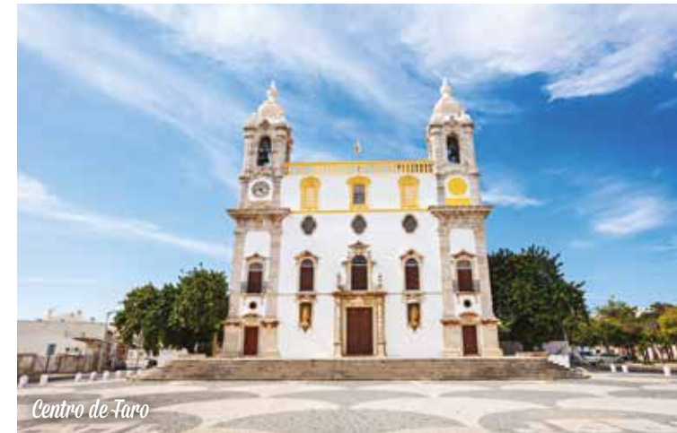
Centro de Faro