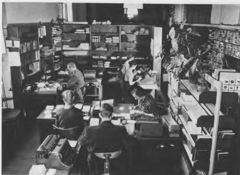
Katalogafdelingen i Nikolaj kirke 1957.

lertidig stopper for realiseringen af disse planer, skønt behovet blev mere og mere påtrængende, for som årsberetningerne for 1940–41 begynder: »Af velkendte Grunde har Bibliotekernes Virksomhed i dette Aar haft en Tilslutning i vort Folk saa stor som aldrig før.«