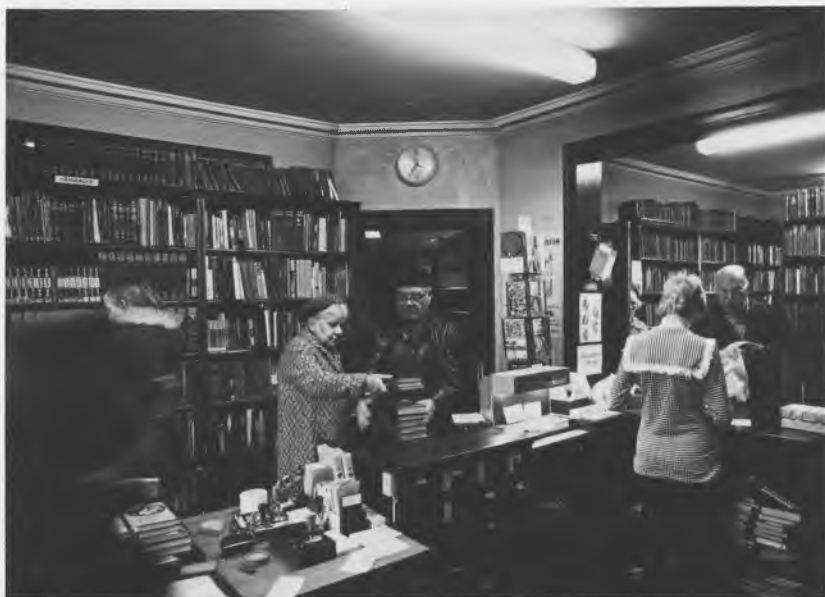
Biblioteket på Vibevej kort før lukningen.