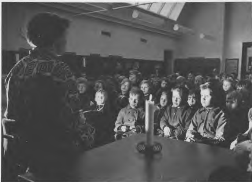
Eventyrtime i Frederiksholm bibliotek 1956. I dag kan man ikke samle børn til oplæsning i bibliotekerne.

til Ellebjergskolen. Bebygget areal 380 m 2 , hvortil kommer et lignende areal i kælderens til magasiner. Biblioteket var heldigt i sin udformning. Praktisk, rationelt, lyst og venligt. Det blev i en årrække Københavns biblioteksvæsenes stolthed, fremvist til fagfolk fra nær og fjern. Scrapbogen fortæller om besøg helt fra Canada og Indonesien – måske de dog ikke bare kom for at se Frederiksholm bibliotek. Men det blev vist frem til mange i alt fald. Beliggenheden ved »pælesøen« er idyllisk og ejendommelig. Til nordsiden P. Knudsensgade, med årene mere og mere støjende af tung trafik fra de vestlige indfaldsveje. En bebudet aflastning af P.Knudsensgade vil blive hilst velkommen også af biblioteket.