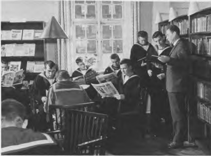
Fra kasernebiblioteket på Holmen.

bejde en plan for en særafdeling, der skulle tage sig af dette arbejde, og det indvilligede jeg i.