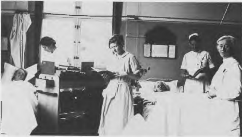
Patientbiblioteket på Kommunehospitallet kom i gang 1937. Her er man ude med bogvognen til sengeliggende patienter.