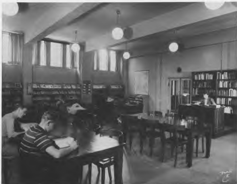
Læsesalen i Ølandsgade 1944. Bibliotekaren sidder bag bordet på en forhøjning, der har en umiskendelig lighed med et kateder. Møblerne er medbragt fra det gamle bibliotek på Amagerbrogade. Jonals Co. fot.

kontor, og læsesalsbesøget faldt mærkbart – en tydelig tendens i alle biblioteker. Den store læsesal lå øde hen som en trist jernbaneventesal, kun ved lånerarrangementer var den anvendelig med mange siddepladser og udmærket akustik, – men fremfor alt var savnet af et børnebibliotek i denne store bydel eklatant. »Børn har ingen adgang til reolerne« meddelte et skilt i Ølandsgades udlån i adskillige år. I slutningen af 60'erne kom der en lille lysning for Sundbybørnene. Ved fotonoteringens indførelse i 1962 blev det ene skrankerum overflødigt, og her blev indrettet et børnehjørne med en nødtørftig grundstamme af børnebøger – men uden børnebibliotekar. Det overfyldte og nedslidte bibliotek i Ølandsgade var nu efter 35 år forældet, og nødvendigheden af en udvidelse blev mere og mere påtrængende.