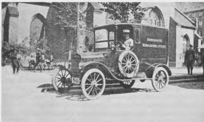
Omkring 1925 foregik transporten af bøger mellem bibliotekerne med denne varevogn. Bibliotekernes årsberetning 1918–25.