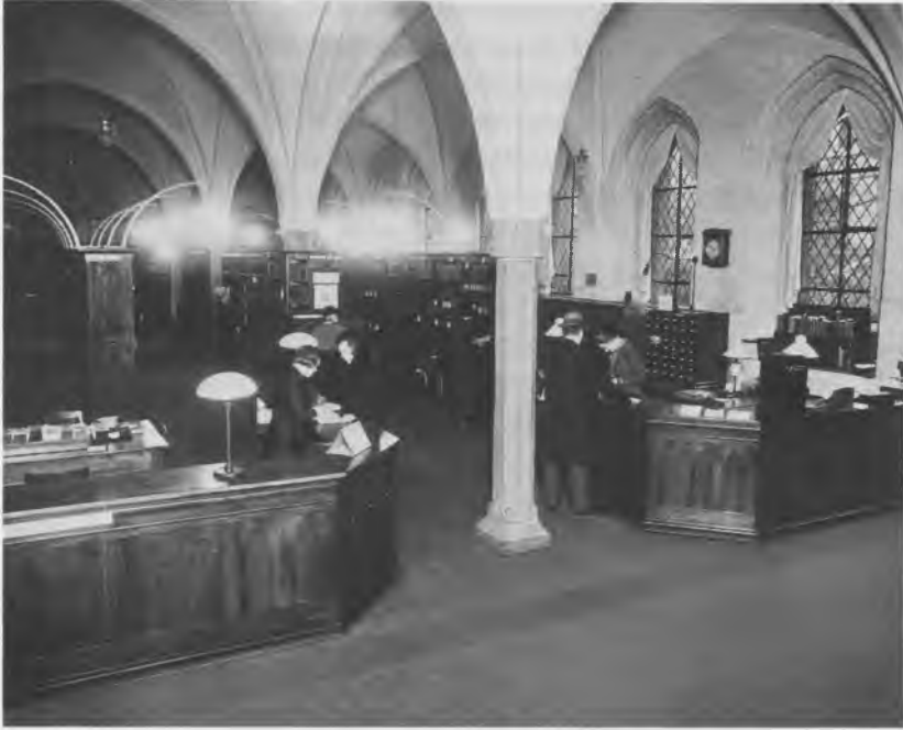
Udlånet i Helligåndshuset omkring 1930. Her havde publikum haft adgang til hylderne siden åbningen i 1918.

Derfor meldte pladsproblemerne sig også her, og i 1930 måtte man foretage en væsentlig ændring. I Vartov overtog biblioteksvæsenet lokaler i den såkaldte tværfløj og indrettede her en avislæsesal til afløsning af den, der ikke mere var plads til i hovedbiblioteket. I Helligåndshuset opgav man derfor avisholdet, læsesalen flyttedes, så den kun optog den inderste del af salen, og resten indrettedes til udlån med den oprindelige ekspedition til indmeldelse og aflevering af bøger og en ny ekspedition overfor til udstempling og til sortering af indkomne bøger. Det årlige udlån nærmede sig nu en kvart million og var det største i byen.