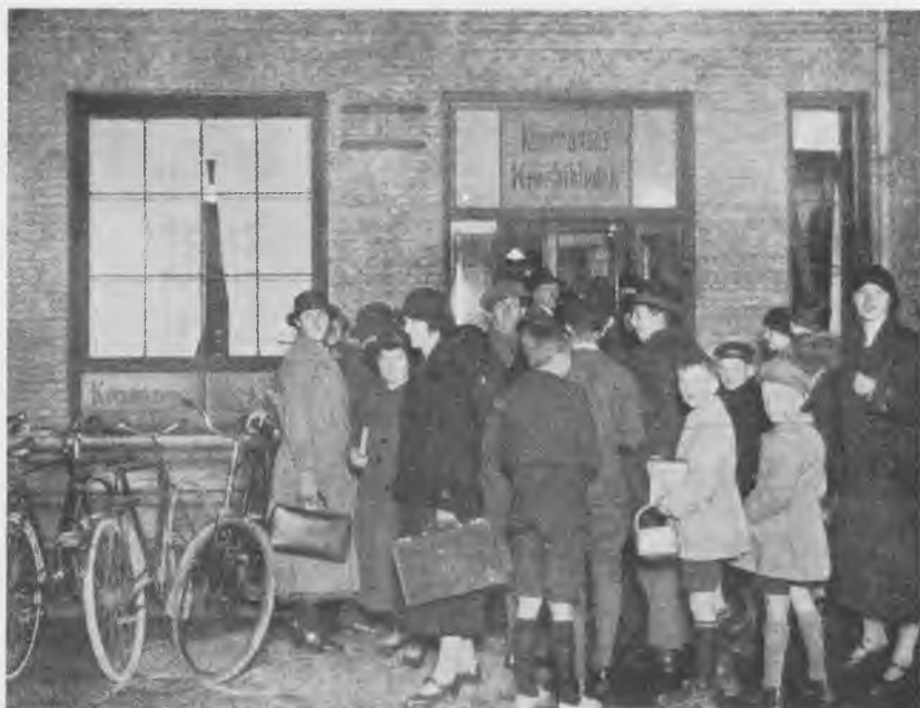
Trængsel foran indgangen til biblioteket på Østerbro kl. 7 aften. Bibliotekernes årsberetning 1918-25.

trængsel i udlånslokalerne, mest i den sidste halve eller hele time. Lånerne blev gang på gang anmodet om så vidt muligt at fordele besøget ligeligt over hele den daglige udlånstid. Bibliotekerne forbeholdt sig endda ret til kun at ekspedere et lånerkort pr. husstand i den travle tid. Børn over 10 år kunne gå bud for voksne, men de blev ikke ekspederet efter klokken halvotte.