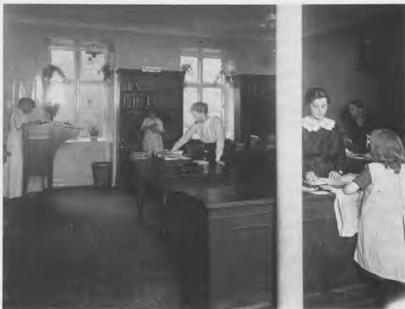
Udlånet i Griffenfeldsgade på Nørrebro 1915. Man havde allerede da fået åbne hylder, og at der også er tænkt på de helt unge ses af reolen i baggrunden med »Ungdomsbøger«.

handlerforening, 4) antagelse af en bogbinder til reparationsarbejder, 5) indrettelse af et fælleskontor, 6) leje af bibliotekslokaler uden bestyrerbolig. I oktober 1912 vedtager man at søge borgerrepræsentationens samtykke til afskaffelse af kontingent, og man vedtager at ansætte drenge til bogopsætning og lignende (der står udtrykkelig drenge ).