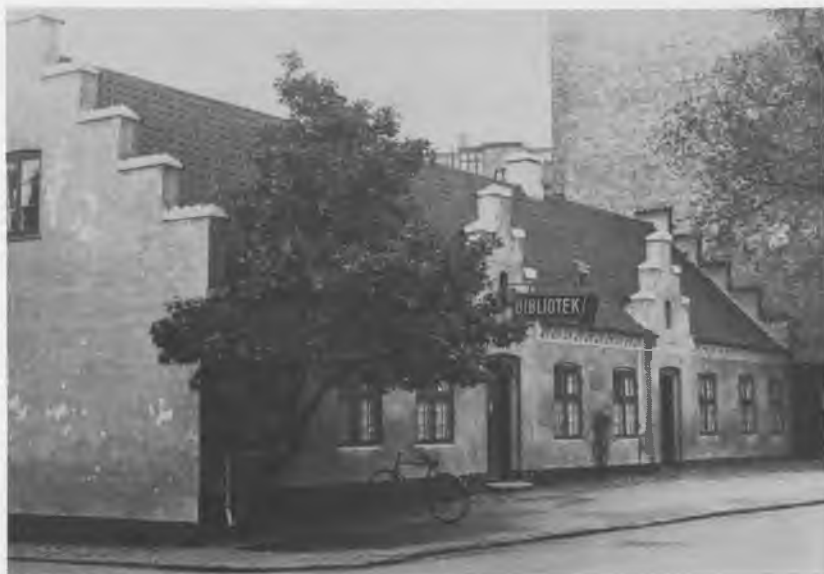
Rytterskolen i Valby omkring 1930, da biblioteket overtog hele bygningen.

rettet udlånslokale. Rytterskolen rummede i disse år endnu en kommunal »institution«, nemlig den såkaldte »rottemand«. I visse perioder var han posteret i bibliotekets mellemgang og modtog døde rotter formedelst 10 øre pr. stk. Halerne blev klippet af og opbevaret, mens rotterne blev kastet i en spand til senere destruktion.