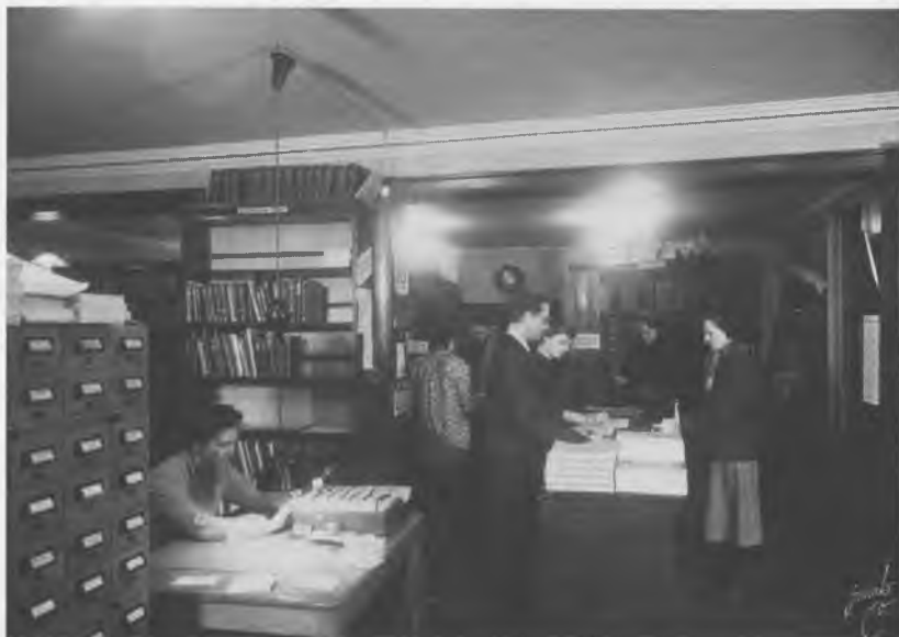
Nygaardsvej 45 i december 1952 kort før flytningen til Jagtvejen. Det meste af inventaret er fra slutningen af tyverne og mørkbejdset.

befolkning, varede det længe, før den rigtige mulighed frembød sig. Men man slog til, da der ved nytårstid 1953 opstod mulighed for at flytte ind i kommunens ejendom, Jagtvej 227, hvor kommunens kørselsafdeling flyttede ud. Fra et areal på 144 m 2 kom biblioteket nu op på over 500 m 2 , med 170 m 2 i stuen, hvor børnebiblioteket blev indrettet, og med en voksenafdeling på 1. sal på ca. 270 m 2 .