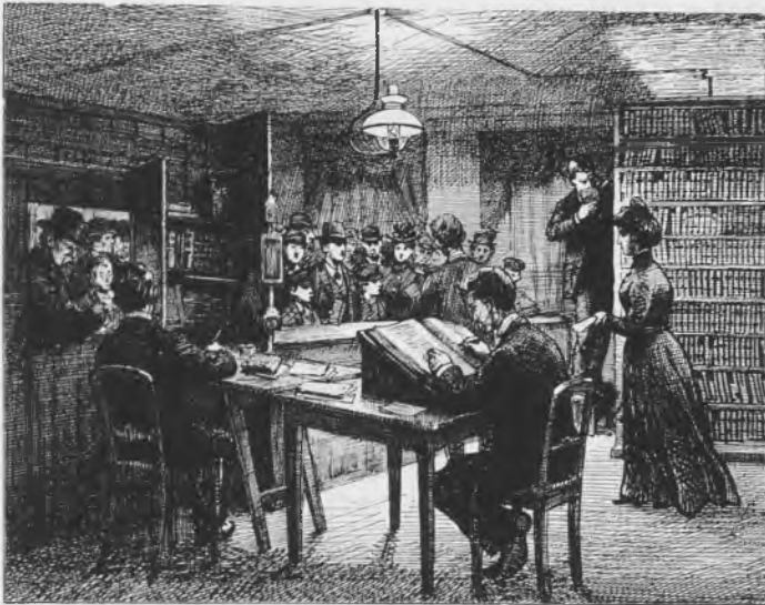
Udlånssalen på Nørrebro. Til venstre ved lugen foregår indskrivningen af lånere, der måtte blive foran skranken, mens bibliotekspersonalet hentede nye bøger og satte de læste på plads. I forgrunden ses bibliotekaren, der førte lånerprotokollen og forhandlede med lånerne »i særlige tilfælde«. Efter tegning af Tom Petersen.

Pladsen i bibliotekerne tillod som regel kun brugen af en enkelt protokol af mægtigt omfang. En hovedfejl ved protokolsystemet var, at noteringen kun kunne udføres af en enkelt person ad gangen. Selv om skrivningen var forenklet til et minimum, klagede personalet alligevel meget over det besværlige ekspeditionssystem. Protokolsystemet umuliggjorde i øvrigt enhver form for tilforladelig statistik over, hvad der blev læst. Protokollerne blev afskaffet i 1903, men da var man også nået op på 400.000 udlån om året.