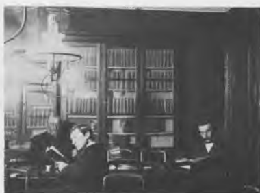
Kommunens folkebibliotek nr. 5, 1902. Tv. bibliotekaren med den store lånerprotokol, th. læsesalen i gaslampens skær.