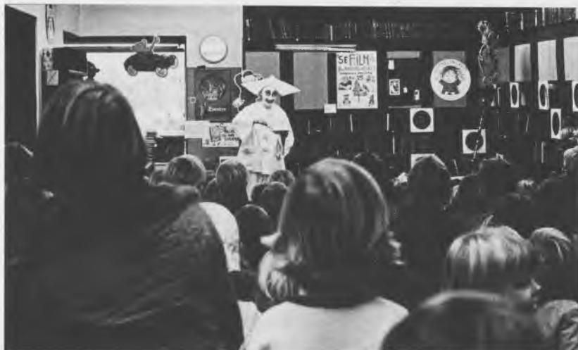
Pjerrot optræder for børn i Christianshavns bibliotek 1972.

De traditionelle eventyrtimer var for længst bukket under i konkurrencen med billedmedierne. Nu blev der afholdt professionelle lånerarrangementer, filmforevisninger, tryllekunstneroptræden og børneteaterforestillinger. Dertil kom i enkelte afdelinger med musik muligheden for pladeaflytning. Alt i alt blev børnebibliotekernes udvidede fritidstilbud så stor en succes, at det voldte daglige problemer at tilpasse børnenes støjniveau til de voksnes rimelige ønsker om et fredeligt biblioteksbesøg, og selv om den fælles skrankebetjening og den frie adgang afdelingerne imellem fastholdtes, måtte der ved senere lokaleindretninger tages et afgørende hensyn til voksnes og børns forskellige adfærd i biblioteket.