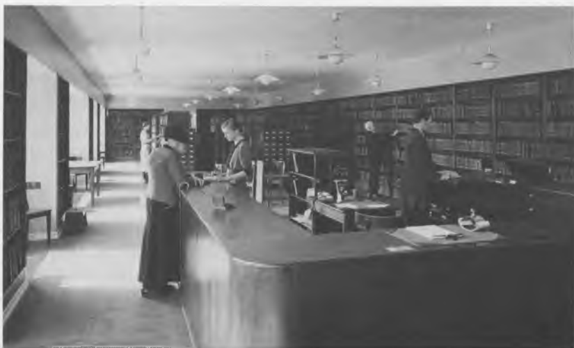
Udlånet på Christianshavn i begyndelsen af trediverne. Indretningen er typisk for perioden fra 1930 til 1950 med reoler i parallelle rækker med godt udsyn fra skranken ned gennem gangene, så man kunne holde øje med, hvad der foregik.

serne ved »Lagkagehuset« blev der også rørt ved spørgsmålet om det berettigede i at anvende førstesalen i dette hus til lokaler for et kreds-bibliotek. Men en ledende artikel i »Politiken« 24. juni 1931 fastslog, at »selvfølgelig skal folkebibliotekerne have så gode lokaler som muligt. Lokaler, hvor folk kan sidde og læse, værelser til studiekredse, således at det meget betydningsfulde kulturarbejde, de udfører, kan få den størst mulige virkning . . . «.