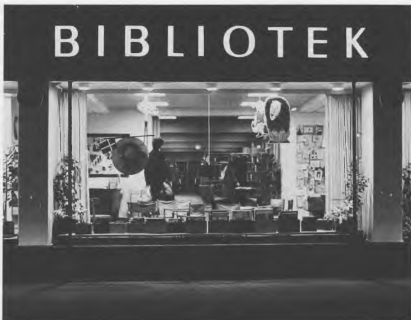
Facaden mod Østerbrogade. I 1970'erne rykkede bibliotekerne næsten helt ud på gaden med store vinduer og farverige udstillinger og reklamer, her for børnebiblioteket.

loftshøjde og det frie udsyn over reolerne, og med udsigten mod den store gård og kirkegården, hvor man kan følge de skiftende årstider, undgik man helt bibliotekssalsfornemmelse. Man havde som sagt ikke regnet med, at dette bibliotek, med sin placering mellem kirkegårde og ambassader i et tyndt befolket nærområde, og kun synligt fra gaden ved sin indgang, snart ville sprænge rammerne både med hensyn til bogudlån og bogbestand, og at det i løbet af få år voksede til at blive byens største kredsbibliotek.