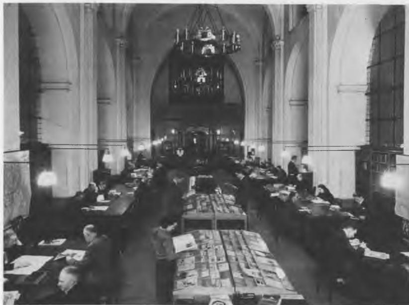
Hovedbibliotekets læsesal 1949 i midterskibet i Nikolaj kirkebygning med orglet, der somme tider leverede morgenmusik, i baggrunden.

ciallitteratur og musikaler. Kirkesalen var forbeholdt kirkelige handlinger, møder og koncerter. Den havde et udmærket orgel, og mange formiddage arbejdede personalet til akkompagnement af koncertprøvernes sang og orgelspil.