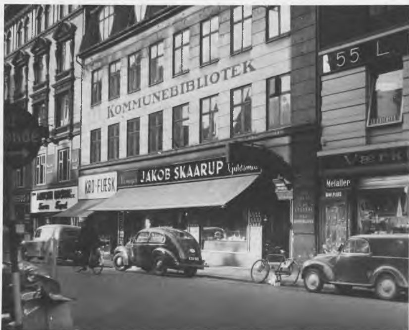
Bibliotekets facade mod Griffenfeldsgade i begyndelsen af 1950erne.

stoppet, var der ingen muligheder for større ændringer i bibliotekernes lokaleforhold og status. Der havde hidtil kun været udlån til børn i 4 biblioteker, men i oktober 1945 kom også Nørrebro blandt disse, og at der har været et behov viste sig i et ganske pænt udlån 1946-47 på 39.635 bind.