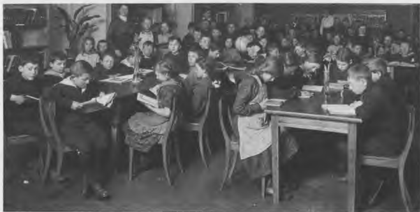
Undervisning af skolebørn i børnelæsestuen i Griffenfeldsgade.

Der havde hidtil været begrænset plads for børn på bibliotekernes læsestuer, og da man indså, at behovet var stort, oprettedes to børne-