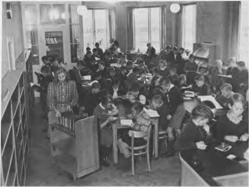
Klassebesøg i børnebiblioteket 1948.

blev biblioteket officielt indviet ved en lille højtidelighed, hvor biblioteksbestyrelsen og institutionens ledelse var til stede, og hvortil J. Tørring var inviteret.