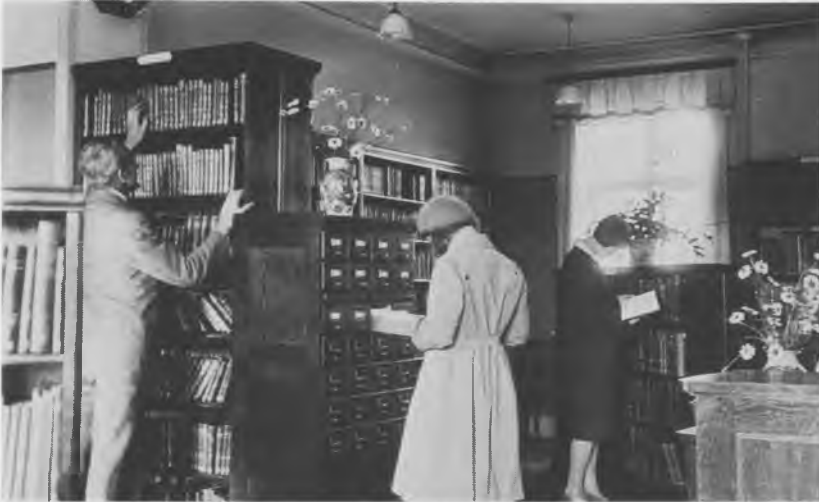
Filialbiblioteket, Absalonsgade 3, hvor bymuseet nu har kontorer. Biblioteket eksisterede 1925–37.