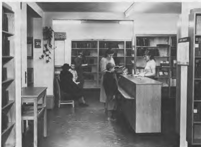
Det nye bibliotek i Filosofvænget 1951, endnu med god plads på hylderne. Axel Rom fot.

lånte bøger, og her havde kontoreleven sin plads. Til studentermedhjælperen var der en høj taburet, når hun trængte til at sidde. Bogopsætter havde man ikke, bogvogn selvfølgelig heller ikke, der var ikke plads til den. Den der for øjeblikket havde tid, greb en stak bøger og satte dem på plads. Og plads på hylderne var der nok af med de store udlån. Der var et fantastisk godt forhold både mellem personalet indbyrdes og til lånerne.