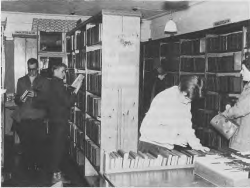
Biblioteket på Jyllingevej tæt pakket med bøger.