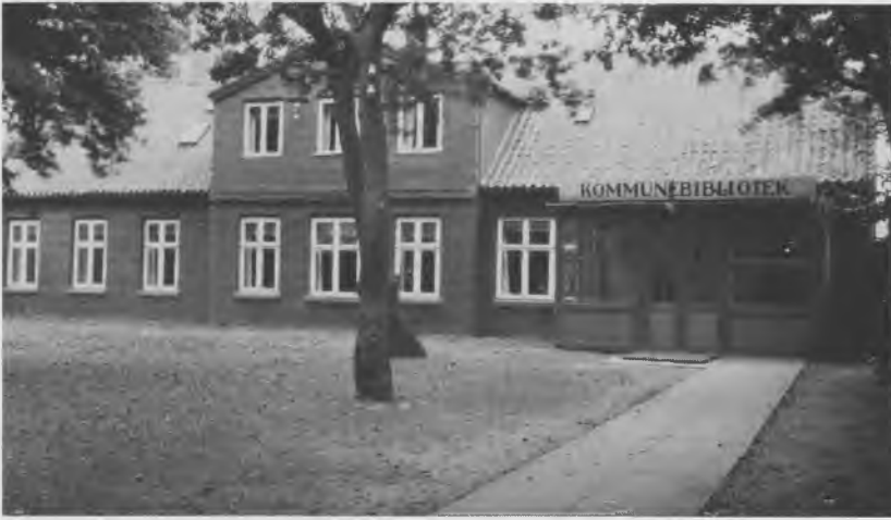
Sundby kredsbibliotek, Amagerbrogade 62, i slutningen af tyverne. Beretning 1925–30.

plads til læsesal, og udlånet var så lille, at der ikke kunne indrettes åbne hylder. Denne bygning var kun tænkt som et midlertidigt opholdssted for biblioteket, men først syv år senere fik man et nyt lejemål i stand og flyttede til Amagerbrogade 62 i en mindre bygning, hvor den tidligere restauration St. Pauli havde haft til huse. De 300 m 2 her blev i stueetagen delt op i udlånssal med åbne hylder og læsesal for voksne, og i loftetagen blev indrettet kontor, bogmagasin, studie-kredslokale og køkken. Samtidig blev den nye udlånsfilial på Islands Brygge lagt ind under Sundby kredsbibliotek – den blev efter tolv års forløb overført til kredsbiblioteket på Christianshavn.