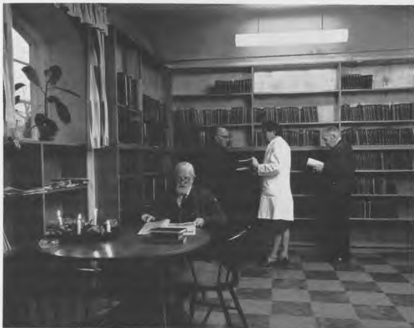
Biblioteket i De gamles By 1965.

salen og langt fra ideelt, men vi måtte dokumentere, at der var et behov. Det viste der sig at være, og efter et par års forløb fik biblioteket sit eget tilfredsstillende lokale. Mønstret for oprettelse af bibliotek på Tranehavegård og Nørrebrovænge var omtrent det samme, og biblioteket bor nu flere steder i en af de små lejligheder i pensionistboligerne.