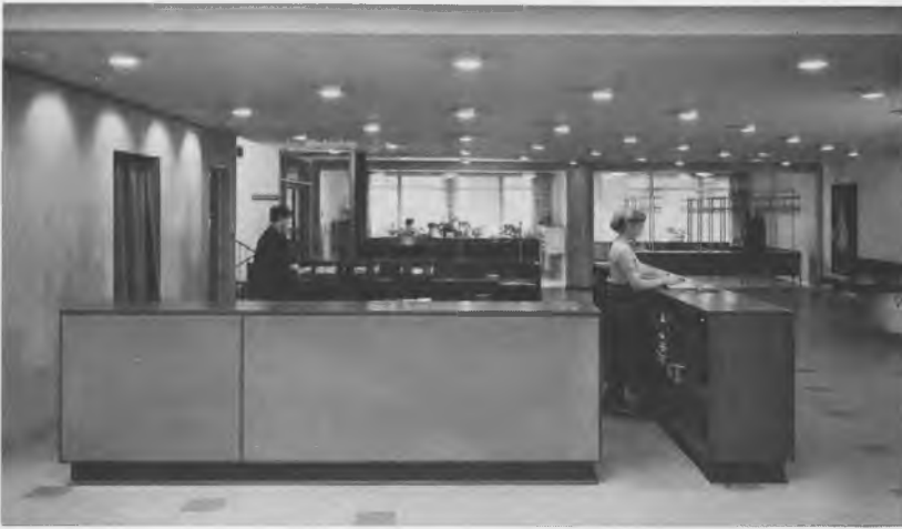
Skranken i hovedbiblioteket på Kulturvet, som den oprindelig meget stilrent var indrettet. Strüwing fot. 1958.

ideerne stammer fra slutningen af forrige århundrede og går ud på at dele det store bibliotek op i mindre enheder med hver sine emneområder. F. eks. er der afdelinger, kaldet »fagsale«, for geografi, historie, humaniora, praktiske fag osv. En fagsal rummer såvel tidsskrifter og håndbøger som udlånslitteratur. En sådan afdeling kan blive aktuel, når en bogbestand kommer op på omkring 150.000 bind. Med en bogbestand i denne størrelsesorden, vil det være umuligt for den enkelte bibliotekar at foretage en forsvarlig bogpleje, og at give publikum en kvalificeret betjening. En arbejdsdeling vil være nødvendig. Cleveland Public Library var det første folkebibliotek, der i 1913 blev indrettet efter dette system. Københavns Kommunes hovedbibliotek var det første større bibliotek i Skandinavien, som var totalt fagsalsdelt.