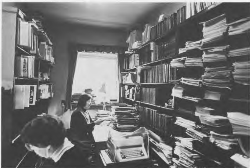
Kontor på biblioteket i Filosofvænget i 1970erne.

slet ikke var noget børnebibliotek i kvarteret. Fra 1956 havde der været offentligt børnebibliotek på Holbergskolen, men dels lå det helt ude ved kommunegrænsen, dels viste det sig i praksis, at meget få børn kom der uden for skoletiden. Derfor overgik det i 1966 til skolebibliotekerne. Siden da havde kvarterets børn måttet klare sig med en billedbogskrybbe, 2 reoler med børnebøger, 1 med ungdomsbøger og en vindueskarm med tegneserier. Lånerne tog varmt del i bekymringerne – mest på personalets vegne – og nogen forsøgte at finde muligheder for nye lokaler. Lidt trøst var der i, at næsten alle beklagelser endte i: Men her er jo så hyggeligt.