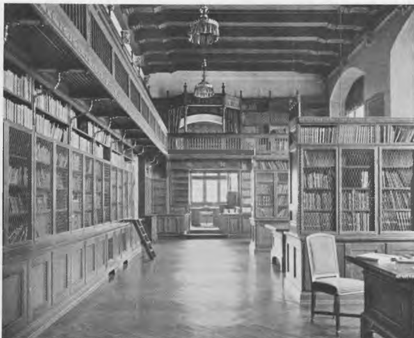
Rådhusbiblioteket indgår i rådhusets repræsentationslokaler. Fra bibliotekarens oprindelige arbejdsplads midt i billedet – karnappen ud mod rådhuspladsen – går en trappe op til det omløbende egetræsgalleri med reoler.

tet 1896 med den opgave at være »til Brug for Kommunalbestyrelsens Medlemmer og Kommunens Tjenestemænd samt til Nytte for disse og Byens Borgere ved Studiet af Hovedstadens Historie«, blev i 1922 lagt under biblioteksvæsenets bestyrelse med stadsbibliotekaren som chef.