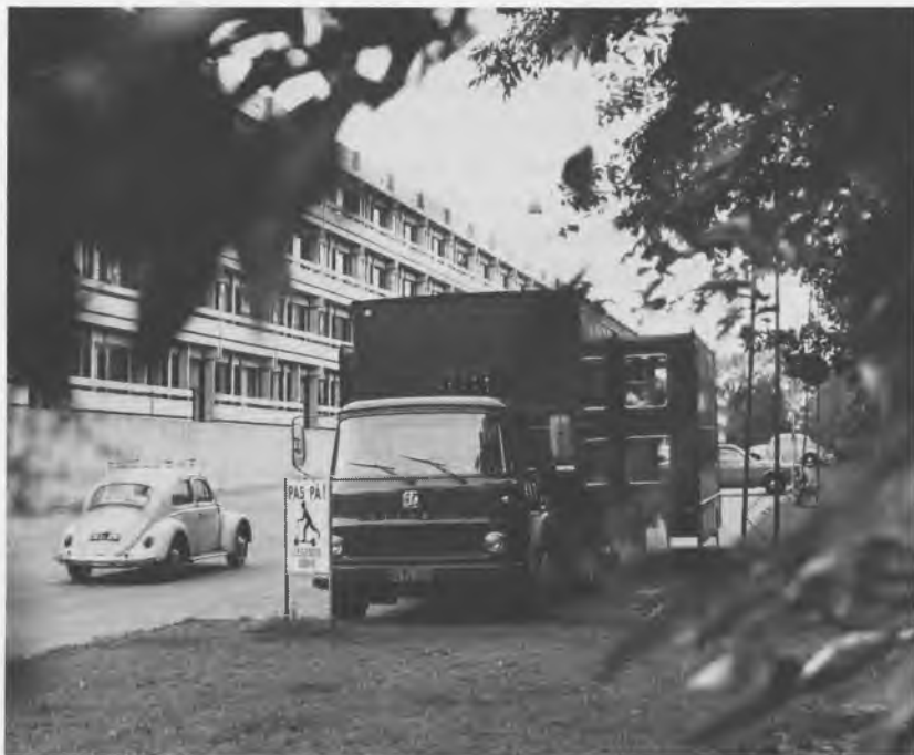
Bogbussen på Rymarksvej.

muligheder for stoppestedernes placering. Det blev en streng vinter med megen sne – men også problemet med snerydning før bussens ankomst på de forskellige stoppesteder blev ordnet med grundejerforeninger og viceværter. Toiletproblemet på de enkelte stop fandt man også nogenlunde løsninger på.