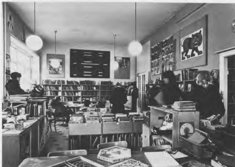
Børnebiblioteket 1979. Som det ses i forgrunden, bruger man nu mange andre materialer end bøger i biblioteket.

gel: bogbestanden var svulmet op i årenes løb, og det lave udlånstal gjorde det vanskeligere og vanskeligere at få plads til bøgerne.