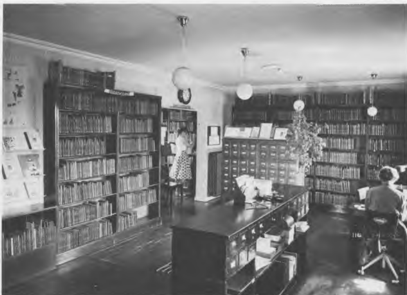
Det hyggelige bibliotek på Islevhusvej 1959.

1940–41: »til Læsestue, Afdeling for Børn eller til Studiekredsarbejde er her ingen Plads«. Der skulle gå næsten 20 år, før bydelen fik sit eget børnebibliotek.